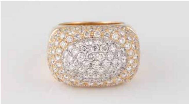
170 | BRILLANT-RING Gelbgold, Weißgold. Ringmaß ca. 55, Ges.-Gew. ca. 23,3 g. Gest. 750. Ca. 141 Brillanten, zusammen ca. 5,0 ct., etwa Top Wesselton-Wesselton, VS-SI. € 6.200,-