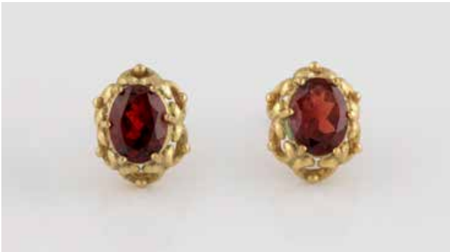
448 | PAAR OHRSTECKER Gelbgold. 1,2 x 1 cm, Ges.-Gew. ca. 2,4 g. Gest. 333. Jeweils ein oval facettierter Granatstein, zusammen ca. 2,4 ct. € 50,-