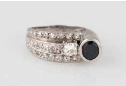
201 | EDELSTEIN-RING Platin, Iridium. Ringmaß ca. 53,5, Ges.-Gew. ca. 9,5 g. Gest. Plat. 10 (%) Irid.. Ein oval facettierter Saphir, ca. 5,6 x 4,9 mm, Höhe nicht messbar, 24 Diamanten im Brillant- und 8/8-Schliff, zusammen ca. 0,7 ct. € 1.100,-