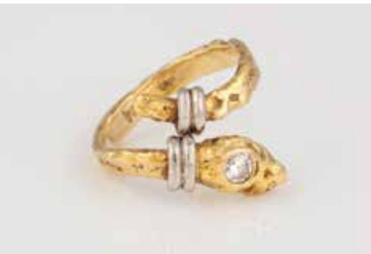
100 | SCHLANGEN-RING MIT BRILLANT Gelbgold, Platin. Ringmaß ca. 48, Ges.-Gew. ca. 5,1 g. Gest. 750, Herstellerzeichen. Ein Brillant, ca. 0,13 ct., etwa Top Wesselton, P1. Angaben laut Expertise. Expertise: Garantie-Urkunde Goldschmiede J. Weiland, Mainz. € 220,-