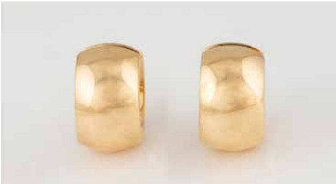
488 | PAAR OHRCREOLEN ‚WEMPE‘ Gelbgold. 1,9 x 1,1 cm, Ges.-Gew. ca. 20,6 g (gefüllt?). Gest. 750, Herstellerzeichen. Part. leicht gedrückt. € 950,-