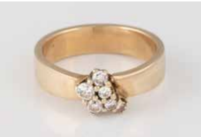
103 | DIAMANT-RING Gelbgold. Ringmaß ca. 50, Ges.-Gew. ca. 4,3 g. Geprüft 14 K. Sechs Diamanten im 8/8- und Brillantschliff, zusammen ca. 0,2 ct. € 150,-