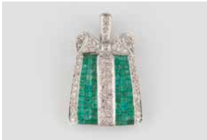
296 | EDELSTEIN-ANHÄNGER Weißgold. 3,0 x 2,0 cm, Ges.-Gew. ca. 8,6 g. Gest. 750. 61 Brillanten, zusammen ca. 0,5 ct., 78 Smaragde, vornehmlich rechteckig facettiert, einer durch rund facettierten ersetzt. Min. besch. € 850,-