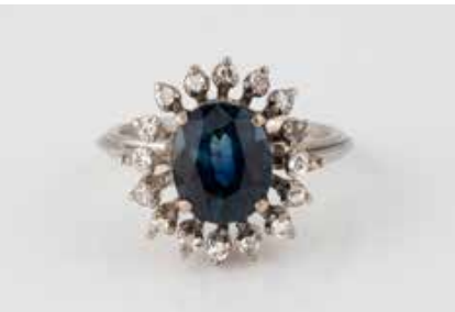
192 | SAPHIR-RING Schiene geprüft Platin. Ringmaß ca. 55, Ges.-Gew. ca. 6,8 g. Ein oval facettierter Saphir, ca. 3,2 ct., 16 Diamanten im 8/8-Schliff, zusammen ca. 0,16 ct. Min. besch. € 900,-