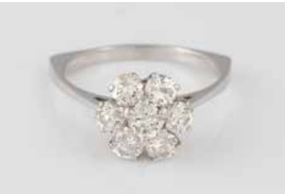
77 | BRILLANT-RING Weißgold. Ringmaß ca. 60,5, Ges.-Gew. ca. 4,1 g. Gest. 750, Herstellerzeichen. Ein Brillant, ca. 0,31 ct., etwa Wesselton Piqué, sechs Brillanten, zusammen ca. 1,47 ct., etwa Wesselton Piqué. Angaben zu den Brillanten laut Expertise. Expertise: K&C Atelier-Garantie, Dezember 1970. € 1.000,-