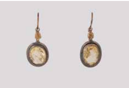
505 | PAAR OHRHÄNGER Gelbgold, Vergoldung. L. 2,3 cm, Ges.-Gew. ca. 2,5 g. Oberteil (nachträglich ergänzt) gest. 585, Steinfassung geprüft Metall, vergoldet. Jeweils ein oval facettierter Citrin. Besch. € 80,-