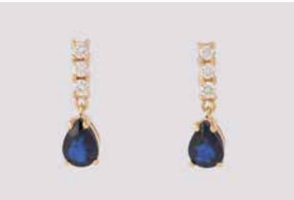
213 | PAAR EDELSTEIN-OHRSTECKER Gelbgold. L. 1,6 cm, Ges.-Gew. ca. 2,4 g. Gest. 750. Jeweils ein tropfenförmig facettierter Saphir, zus. ca. 1,26 ct., zus. sechs Brillanten, zus. ca. 0,24 ct., etwa Top Wesselton - Wesselton, VS-SI. € 500,-