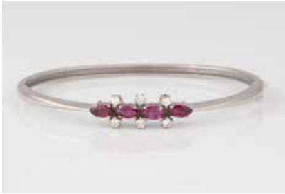
280 | EDELSTEIN-ARMREIF Weißgold. Innenmaß ca. 5,9 x 4,7 cm, Ges.-Gew. ca. 15,0 g. Gest. 585, Caratangabe der Diaman- ten gemarkt. Vier Rubine im Navetteschliff, zu- sammen ca. 1,24 ct., sechs Brillanten, zusam- men ca. 0,28 ct., etwa Top Wesselton - Wesselton, VS-SI. Einlieferung aus Juwelierschließung. € 650,-