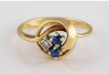
218 | EDELSTEIN-RING Gelbgold. Ringmaß ca. 52,5, Ges.-Gew. ca. 2,6 g. Gest. 585. Zwei rund facettierte Saphire, ein Diamant im 8/8-Schliff. € 70,-