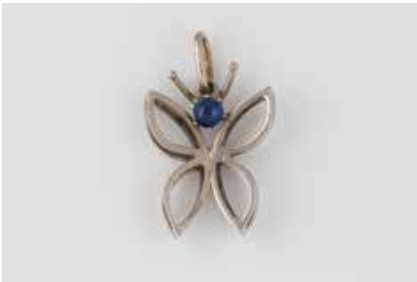
234 | ANHÄNGER ‚SCHMETTERLING‘ Weißgold. 2,3 x 1,5 cm, Ges.-Gew. ca. 1,9 g. Geprüft 18 K. Anhänger in Form eines Schmetterlings, ein Saphir-Cabochon, ca. 0,2 ct. Leichte Tragespuren. € 100,-