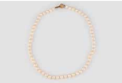
538 | PERL-COLLIER Gelbgold. L. 41,5 cm, Ges.-Gew. ca. 25,4 g. Gest. 585. D. der Perlen ca. 6,9 mm. € 120,-