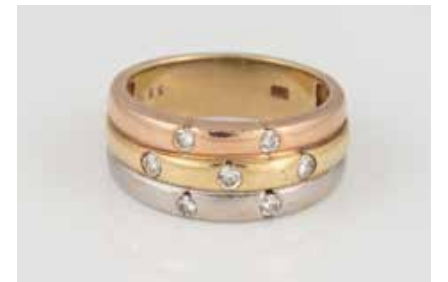
6 | BRILLANT-RING Gelbgold, Weißgold, Rotgold. Ringmaß ca. 56, Ges.-Gew. ca. 7,2 g. Gest. 585, Carat- und Reinheitsangabe der Diamanten gemarkt. Sie- ben Brillanten, zusammen ca. 0,33 ct., SI. € 300,-