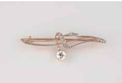
53 | DIAMANT-NADEL Gelbgold, Rotgold. 4,4 cm, Ges.-Gew. ca. 4,4 g. Geprüft 14 K. Ein Diamant im Altschliff, ca. 0,5 ct., etwa Wesselton, VS-SI, 16 Diamanten, zu- sammen ca. 0,2 ct. € 830,-