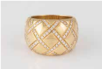
41 | BRILLANT-RING ‚WEMPE‘ Gelbgold. Ringmaß ca. 53, Ges.-Gew. ca. 17,1 g. Gest. 18 K, Herstellerzeichen. Ca. 134 Brillanten, zus. ca. 1,07 ct. € 2.300,-