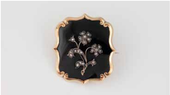
479 | MEMORIAL-BROSCH Gelbgold, Rotgold, Silber. 3,9 x 3,5 cm, Ges.-Gew. ca. 15,8 g. Geprüft 14 K. Aufgesetztes Blütendekor auf konvexer Onyxplatte, besetzt mit Diamantrosen, eine fehlend, Rückseite mit Sichtfenster und wohl Blüteneinlage, persönliche Gravur „[...] 1844 [...]“. € 1.100,-