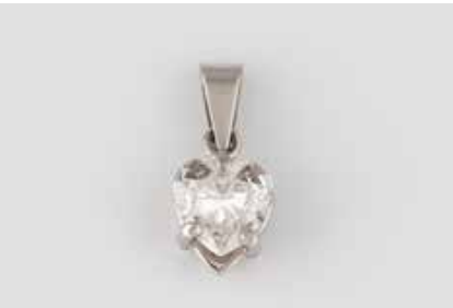
136 | DIAMANT-ANHÄNGER Weißgold. 1,4 x 0,7 cm, Ges.-Gew. ca. 0,6 g. Gest. 750. Ein Diamant im Herzschliff, ca. 0,62 ct. Kalette facettiert. € 650,-