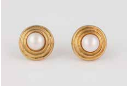
334 | PAAR PERL-OHRSTECKER Gelbgold. D. ca. 1,8 cm, Ges.-Gew. ca. 6,2 g. Gest. 750, Herstellerzeichen. Jeweils eine Perle, D. ca. 8,6 mm. Unterer Teil der Perle nicht sichtbar, geschlossen gearbeitet, Rand möglicherweise gefüllt. Sicherheitsstecker sekundär, nicht mitgemessen. € 250,-