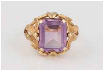
254 | AMETHYST-RING Gelbgold. Ringmaß ca. 54,5, Ges.-Gew. ca. 5,0 g. Geprüft 14 K, Punzierungen leicht verschlagen. Ein Amethyst, ca. 4,5 ct. Stein leicht locker in der Fassung. € 220,-