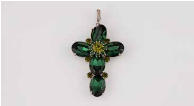
455 | ,COSTUME JEWELLERY' - KREUZ-ANHÄNGER Metall. 7,4 x 4,1 cm. Grüne, facettierte Schmucksteine. Besch. € 100,-