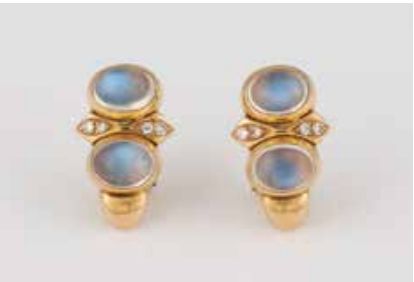
425 | PAAR OHRCLIPS Gelbgold. 2,1 x 1,4 cm, Ges.-Gew. ca. 9,8 g. Gest. 585, Herstellerzeichen. Jeweils zwei Mondstein(?) Cabochons, ca. 7,9 x 5,1 mm, verso geschlossen gearbeitet. Jeweils vier Brillanten, zusammen ca. 0,12 ct. € 300,-