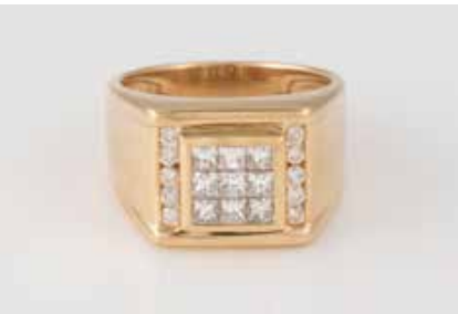
22 | BRILLANT-RING Gelbgold. Ringmaß ca. 59, Ges.-Gew. ca. 12,3 g. Gest. 18 K, Caratangabe der Diamanten gemarkt. 19 Diamanten im Brillant- und Princess-Schliff, zusammen ca. 1,10 ct., etwa Top Wesselton, VS-SI. € 1.500,-