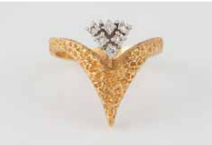
106 | BRILLANT-RING Gelbgold, Weißgold. Ringmaß ca. 58, Ges.- Gew. ca. 5,6 g. Gest. 750. Sechs Brillanten, zu- sammen ca. 0,15 ct. € 350,-