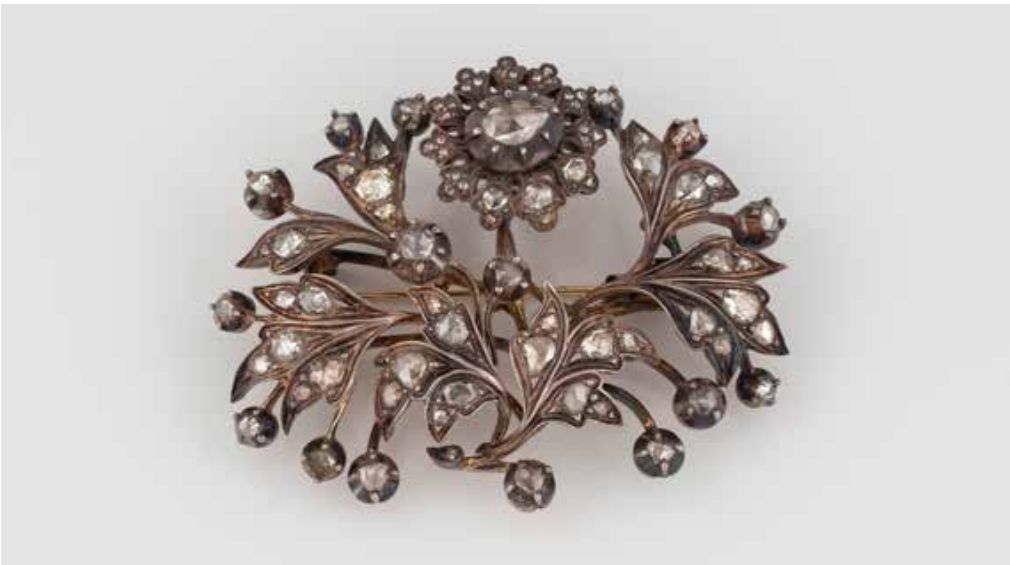
169 | DIAMANT-BROSCH Gelbgold, Silber. 5,9 x 4,6 cm, Ges.-Gew. ca. 29,1 g. Gold geprüft zwischen 8 und 14 K. Vollständig mit Diamantbesatz im Rosenschliff. Nadel später ergänzt. € 1.500,-