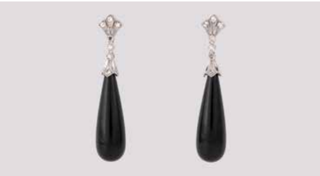
498 | PAAR ONYX-OHRHÄNGER MIT DIAMANTEN Weißgold. L. 4,8 cm, Ges.-Gew. ca. 10,5 g. Gest. 585. Jeweils eine Onyx-Pampel, ca. 29,0 x 9,5 mm, zusammen 20 Diamanten im 8/8-Schliff, zus. ca. 0,36 ct., etwa Top Wesselton, VS-SI. € 480,-