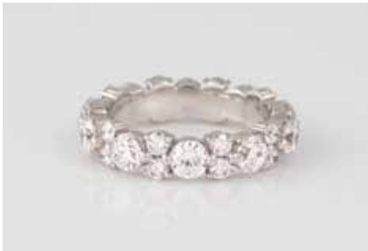
35 | ETERNITY-RING Weißgold. Ringmaß ca. 54, Ges.-Gew. ca. 5,3 g. 18 K. 30 Brillanten, zusammen ca. 3,50 ct., etwa Top Wesselton, VS-SI. € 3.500,-