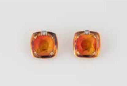
474 | PAAR OHRCLIPS ‚KATZLER‘ Gelbgold. 1,6 x 1,5 cm, Ges.-Gew. ca. 9,6 g. Gest. 585, Herstellerzeichen. Jeweils ein rechteckig facettierter, gelb-orangefarbener Stein, jeweils ein Brillant, zus. ca. 0,05 ct. Part. angelaufen. € 280,-