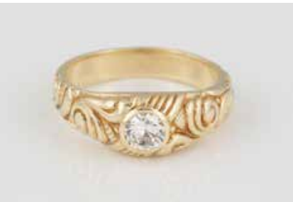
21 | BRILLANT-RING Gelbgold. Ringmaß ca. 61, Ges.-Gew. ca. 9,1 g. Gest. 585. Ein Brillant, ca. 0,49 ct. € 380,-