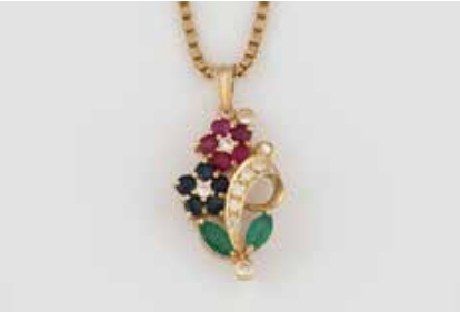
468 | EDELSTEIN-ANHÄNGER MIT KETTE Gelbgold. Anhänger L. 2,6 cm, Kette L. 45 cm. Ges.-Gew. zus. ca. 9,3 g. Beide Stücke gest. 585. Anhänger mit 10 rund facettierte Rubine und Saphire, zwei Smaragde im Navetteschliff, 11 Diamanten im 8/8- und Brillantschliff, zus. ca. 0,16 ct. € 280,-