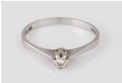
547 | BRILLANT-RING Weißgold. Ringmaß ca. 56, Ges.-Gew. ca. 1,8 g. Gest. 585. Ein Brillant, ca. 0,07 ct. € 60,-