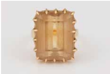
440 | CITRIN-RING Gelbgold. Ringmaß ca. 58, Ges.-Gew. ca. 11,6 g. Geprüft 18 K, italienische Marke. Ein Citrin, ca. 22,4 ct. Leichte Tragespuren. € 300,-