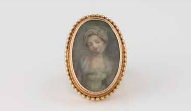
478 | RING MIT MINIATURMALEREI Gelbgold. Ringmaß ca. 53, Ges.-Gew. ca. 11,3 g. Gest. 585. Feine Miniaturmalerei mit Damenportrait. Leichte Tragespuren. € 500,-