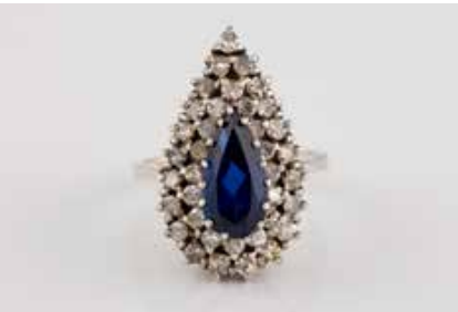
193 | EDELSTEIN-RING Weißgold. Ringmaß ca. 54,5, Ges.-Gew. ca. 6,3 g. Gest. 750. Ein Saphir, wohl synth., im Tropfenschliff, ca. 2,3 ct., 37 Diamanten, zusammen ca. 0,92 ct. Min. besch. € 600,-