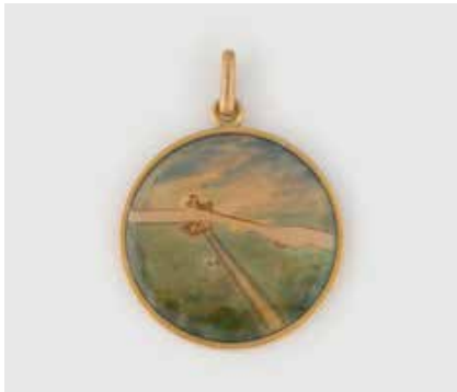
493 | ANHÄNGER Gelbgold. D. 2,6 cm, Ges.-Gew. ca. 7,9 g. Geprüft 18 K. Beidseitige Emaillierung, Flaggendekor und Landschaft mit historischem Flugzeug. Min. besch. € 250,-