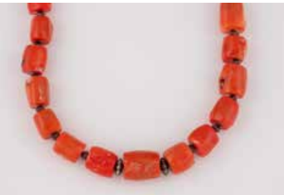
427 | KORALL-COLLIER * Metall. L. 61 cm, Ges.-Gew. ca. 118,3 g. Koralle im Verlauf, ca. D. ca. 8,7 - 12,9 mm. € 120,-