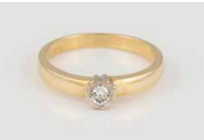
99 | BRILLANT-RING Gelbgold, Weißgold. Ringmaß ca. 58, Ges.- Gew. ca. 4,4 g. Gest. 18 K, 750, Herstellersig- net. Ein Brillant, ca. 0,15 ct. € 280,-