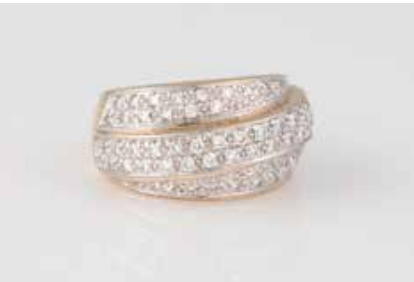
101 | DIAMANT-RING Gelbgold, Weißgold. Ringmaß ca. 54, Ges.- Gew. ca. 12,9 g. Gest. 585, Caratangabe der Diamanten gemarkt. 64 Brillanten, zusammen ca. 1,0 ct., etwa Top Wesselton-Wesselton, VS- SI. € 1.300,-