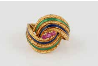
467 A | EDELSTEIN-RING MIT EMAILLE Gelbgold. Ringmaß ca. 51, Ges.-Gew. ca. 7,1 g. Gest. 750, italienische Punzierung. Drei rund facettierte Rubine, grüne und blaue Emaillierung. Min. Tragespuren. € 350,-