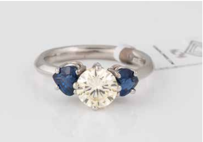
209 | EDELSTEIN-RING ‚CHRIS SOMMER‘ Niederlande, 20./21. Jh. Platin. Ringmaß ca. 57, Ges.-Gew. ca. 7,58 g. Gest. 950, Herstellerzeichen. Ein natürlicher Brillant, ca. 1,55 ct., Light Yellow, VVS, Finish: Very Good/Very Good, Zwei natürliche Saphire im Herz-Schliff, zus. ca. 1,60 ct. Deep Blue, Transparent, (commonly) enhanced, fine color quality. Alle Angaben laut beigefügtem Report. Expertise: Identification Report: Identification Report: IGI (International Gemological Institute), Antwerpen, Februar 2018. Im gefassten Zustand bewertet. € 5.500,-