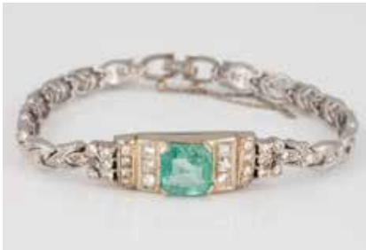
298 | EDELSTEIN-ARMBAND Gelbgold, Weißgold. L. 18 cm, Ges.-Gew. ca. 18,3 g. Gest. 14 K. Ein Smaragd, ca. 3,2 ct., 58 Diamanten im Brillant- und 8/8-Schliff, zus. ca. 1,2 ct. Besch. Ein Diamant fehlend. € 1.200,-