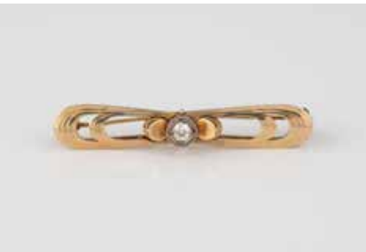
54 | DIAMANT-BROSCH Gelbgold. L. 5,0 cm, Ges.-Gew. ca. 6,0 g. Gest. 585. Ein Diamant im Altschliff, ca. 0,18 ct. Besch. € 220,-