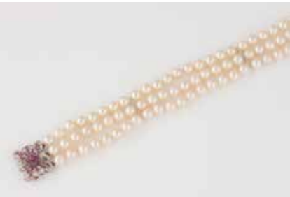
397 | PERL-ARMBAND MIT EDELSTEIN-SCHLIESSE Weißgold. L. 18 cm, Ges.-Gew. ca. 33,2 g. Gest. und geprüft 750 (18 K). Dreireihiges Armband, D. der Perlen, ca. 6,1 mm, Schließe besetzt mit 13 rund facettierte Rubinen. Leichte Tragespuren. € 450,-