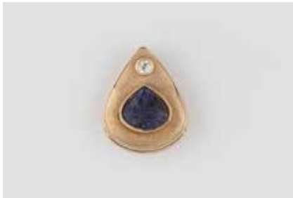
186 | ANHÄNGER Gelbgold. L. 1,8 cm, Ges.-Gew. ca. 3,3 g. Gest. 585. Ein lilafarbener Farbstein, ca. 6,8 x 7,6 x 4,7 mm, ein Brillant, ca. 0,04 ct. € 150,-