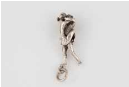
548 | ANHÄNGER Silber. L. 3,5 cm, Ges.-Gew. ca. 6,5 g. Zwei vollplastisch ausgeformte menschliche Figuren, in einer Umarmung miteinander verbunden. € 50,-