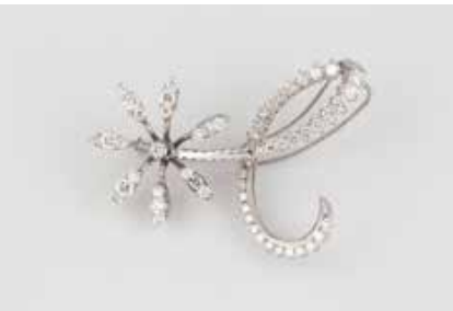
132 | DIAMANT-BROSCHÉ Weißgold. 4,5 x 3,0 cm, Ges.-Gew. ca. 8,7 g. Gest. 750, italienische Punzierung. 56 Brillanten, zusammen ca. 2,3 ct. € 600,-