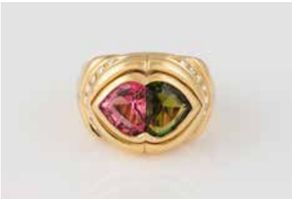
467 | RING Gelbgold. Ringmaß ca. 55, Ges.-Gew. ca. 14,7 g. Gest. 750, italienische Punzierung. 18 Brillanten, zusammen ca. 0,18 ct., ein rosafarbener Turmalin und ein Peridot oder Turmalin, jeweils ca. 8,1 x 7,3 x 4,0 mm. Schienengröße geändert. € 950,-