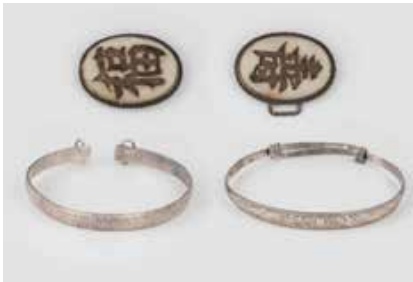
546 | KONVOLUT SCHMUCK 3-tlg. Silber, geprüft. Ges.-Gew. ca. 61,4 g. Zwei Armreifen, Gürtelschnalle mit asiatischen Schriftzeichen auf Perlmutt. Unterschiedliche Herstellungszeiten und Erhaltungszustände. € 50,-