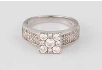
73 | DIAMANT-RING Weißgold. Ringmaß ca. 51, Ges.-Gew. ca. 4,2 g. Gest. 18 K, Herstellerzeichen, Caratangabe der Diamanten gemarkt. 97 Diamanten im 8/8- und Brillantschliff, zusammen ca. 0,82 ct. Minimalste Tragespuren. € 200,-