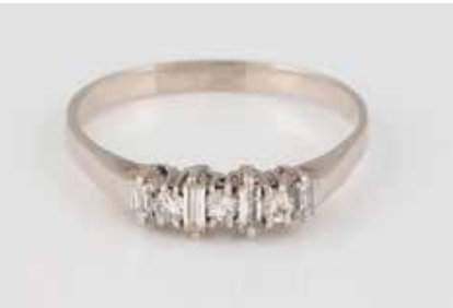
133 | DIAMANT-RING Weißgold. Ringmaß ca. 60, Ges.-Gew. ca. 2,2 g. Geprüft 8 K. Sieben Diamanten im Baguette- und Brillantschliff, zusammen ca. 0,28 ct. Schienengröße geändert. Leichte Tragespuren. € 180,-