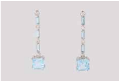
229 | PAAR TOPAS-OHRHÄNGER MIT DIAMANTBESATZ Weißgold. L. 4,0 cm, Ges.-Gew. ca. 5,7 g. Gest. 585. Jeweils acht Topase, zusammen ca. 6,6 ct., zus. acht Diamanten, zus. ca. 0,46 ct., min. besch. € 850,-