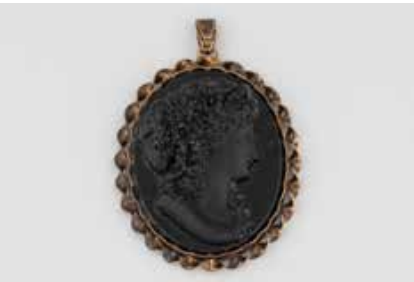
506 | KAMEE-ANHÄNGER Silber (vergoldet). 6,5 x 5,3 cm (ohne Öse), Ges.-Gew. ca. 61,2 g. Gest. 835. Fein geschnittenes Damenportrait, wohl aus Jet (?). Min. besch. € 150,-