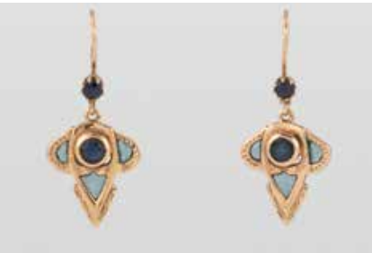
460 | PAAR OHRHÄNGER Gelbgold. L. 3,0 cm, Ges.-Gew. ca. 3,3 g. Gest. 9 C. Jeweils zwei rund facettierte Saphire, Fenster-Emaillie. Part. min. besch. € 60,-