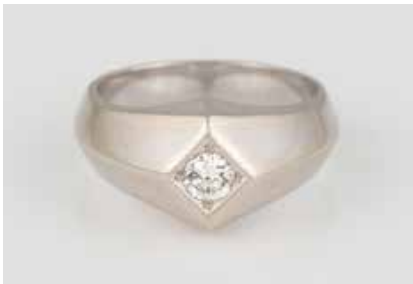
30 | BRILLANT-RING Weißgold. Ringmaß ca. 60, Ges.-Gew. ca. 12,3 g. Gest. 585. Ein Brillant, ca. 0,3 ct. € 500,-