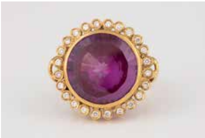
255 | RING Gelbgold. Ringmaß ca. 58, Ges.-Gew. ca. 21,1 g. Gest. 750. Ein rund facettierter, lilafarbener Edelstein, ca. 19,4 x 10,2 mm, 24 Brillanten, zusammen ca. 0,72 ct. € 600,-