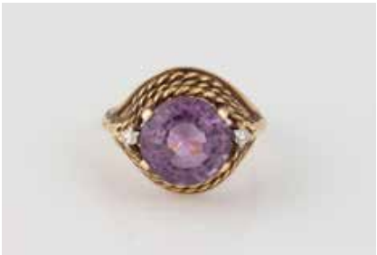
250 | RING Gelbgold, Rotgold. Ringmaß ca. 50, Ges.-Gew. ca. 4,1 g. Gest. 585, persönliche Gravur. Ein rund facettierter Amethyst, ca. 3,4 ct., zwei Diamanten im 8/8-Schliff, zus. ca. 0,05 ct. Minimale Tragespuren. Schiene und Kopf wohl aus zwei Teilen zusammengesetzt. € 240,-