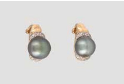
343 | PAAR PERLOHRSTECKER Gelbgold. 1,5 x 0,9 cm, Ges.-Gew. ca. 6,5 g. Gest. 585, Herstellerzeichen. Jeweils eine Perle, D. ca. 9,2 mm, jeweils sechs kleine Diamanten im 8/8-Schliff. € 180,-