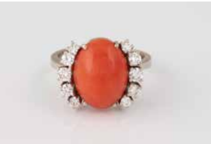
432 | KORALL-RING MIT BRILLANTEN * Weißgold. Ringmaß ca. 56, Ges.-Gew. ca. 6,9 g. Gest. 585. Ein ovaler Korall-Cabochon, ca. 14,6 x 11,3 x 5,8 mm, 10 Brillanten, zusammen ca. 0,84 ct. € 900,-