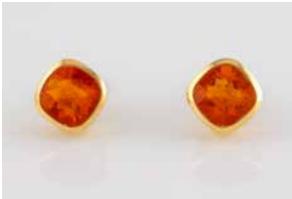
442 | PAAR OHRSTECKER Gelbgold. 0,8 x 0,8 cm, Ges.-Gew. zusammen ca. 3,2 g. Gest. 750. Jeweils ein abgerundet rechteckig facettierter, orangefarbener Schmuckstein. € 80,-