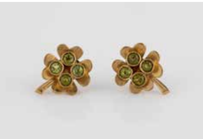
314 | PAAR OHRSTECKER ‚KLEEBLATT‘ Gelbgold. Gest. 333. D. ca. 1,9 cm, Ges.-Gew. ca. 3,0 g. Paar Ohrstecker in Form eines vierblättrigen Kleeblattes, insgesamt acht rund facettierte, grüne Farbsteine, wohl Peridot, zusammen ca. 1,0 ct. € 80,-