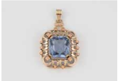
221 | ANHÄNGER Gelbgold, Rotgold. 5,4 x 3,4 cm, Ges.-Gew. ca. 17,3 g. Gest. 585. Ein rechteckig facettierter Spinell (synth.) ?, ca. 24,0 ct. € 380,-