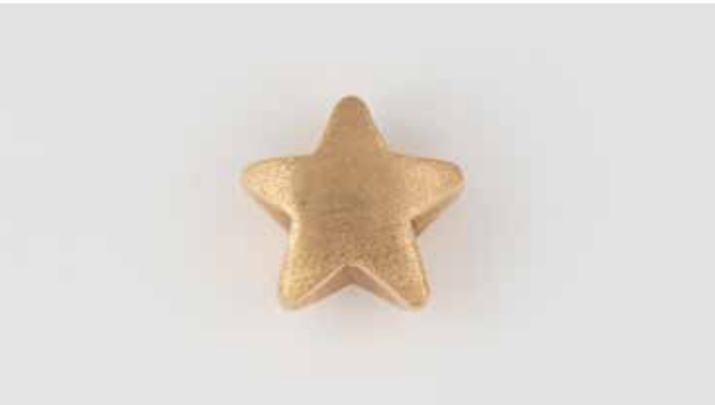
485 | ANHÄNGER Gelbgold. L. 1,6 cm, Ges.-Gew. ca. 1,1 g. Gest. 750, italienische Punzierung, Herstellerzeichen. € 200,-