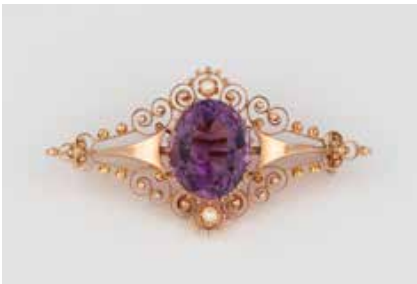
253 | AMETHYST-BROSCHÉ Rotgold. 4,6 x 2,5 cm, Ges.-Gew. ca. 7,4 g. Gest. 585. Ein oval facettierter Amethyst, ca. 7,7 ct., zwei halbierte Saatperlen. € 220,-