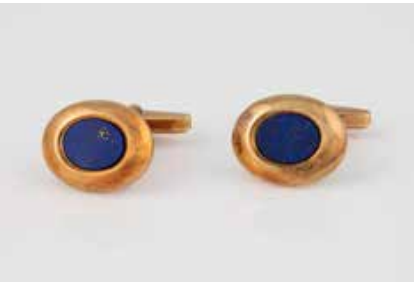
419 | PAAR MANSCHETTENKNÖPFE Gelbgold. Kopf 1,7 x 1,3 cm, Ges.-Gew. ca. 7,7 g. Gest. 585. Jeweils ein Lapislazuliplättchen, ca. 9,4 x 7,1 mm, verso geschlossen gearbeitet. Min. besch. Unklar, ob gefüllt. € 200,-