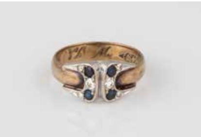
216 | RING Gelbgold, Weißgold. Ringmaß ca. 49,5, Ges.-Gew. ca. 2,5 g. Gest. 333, Herstellerzeichen, persönliche Gravur. Vier rund facettierte Saphire, vier kleine Brillanten, zus. ca. 0,02 ct., zwei Brillanten, zus. ca. 0,07 ct. Besch. € 50,-