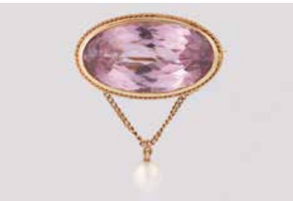
372 | BROSCHE Gelbgold. 2,6 x 3,1 cm, Ges.-Gew. ca. 9,7 g. Geprüft 14 K. Ein oval facettierter Kunzit (?), ca. 22,8 x 12,3 x 9,2 mm, eine hängende Perle, verso Montierungsreste. € 350,-