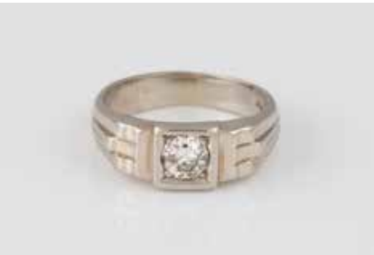
168 | BRILLANT-RING Weißgold. Ringmaß ca. 59, Ges.-Gew. ca. 8,0 g. Gest. 585. Ein Brillant, facettierte Kalette, ca. 0,5 ct. Piqué. Min. besch. Schienengröße geändert. € 300,-