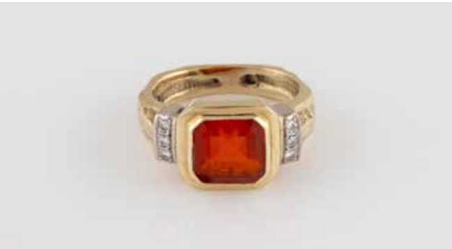
449 | RING Gelbgold. Ringmaß ca. 50, Ges.-Gew. ca. 7,9 g. Geprüft 14 K. Ein rechteckig facettierter, orange-roter Schmuckstein, sechs Diamanten, zusammen ca. 0,06 ct. Besch. Schienengröße geändert. € 240,-