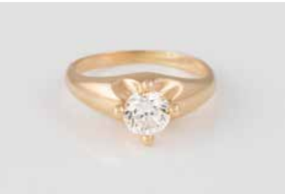
27 | BRILLANT-RING Gelbgold. Ringmaß ca. 49, Ges.-Gew. ca. 4,5 g. Gest. 750, gemarkt ‚Bulgari‘. Ein Brillant, ca. 0,63 ct., etwa Top Wesselton-Wesselton, VS. € 1.800,-