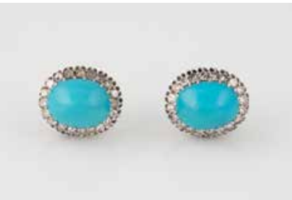
518 | PAAR OHRSTECKER Weißgold. 1,9 x 1,1 cm, Ges.-Gew. ca. 5,1 g. Geprüft 14 K, Sicherheitsstecker Silber 925. Jeweils ein Türkis-Cabochon, ca. 10,5 x 7,9 x 4,8 mm, zusammen 40 rund facettierte, weiße Edelsteine. € 750,-