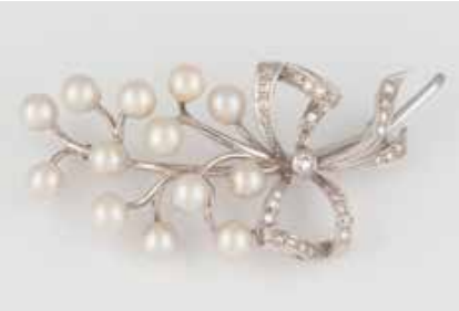
324 | PERL-BROSCHÉ Weißgold. 6,4 x 3,0 cm, Ges.-Gew. ca. 17,4 g. Geprüft mindestens 14 K. 13 Perlen, D. jeweils ca. 5,8 mm, 29 weiße, rund facettierte Steine, einige davon Diamanten. € 750,-