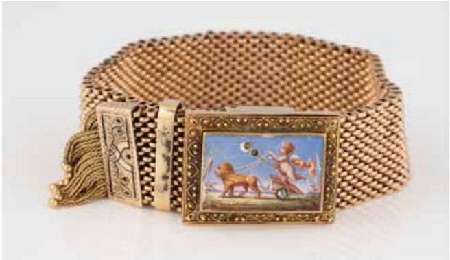
477 | HISTORISCHES ARMBAND Gelbgold, Rotgold. L. max. 20 cm, Ges.-Gew. ca. 46,6 g. Geprüft 14 K. Schaustück mit feiner Porzellanmalerei, zwei Diamantrosen, eine fehlend, besch. Zusammenhängendes Band, ohne Öffnungsmechanismus. € 1.800,-