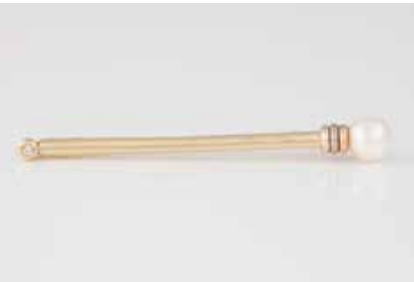
377 | PERL-NADEL Gelbgold, Rotgold, Weißgold. L. 7,5 cm, Ges.-Gew. ca. 10,4 g. Gest. 585, Herstellerzeichen. Eine Perle, D. ca. 9,0 mm, ein Brillant, ca. 0,025 ct. Einlieferung aus Juwelierschließung. € 390,-