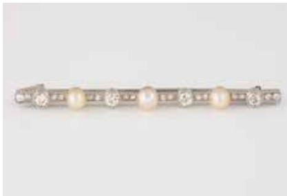
382 | PERL-DIAMANT-BROSCHE Weißgold. 6,7 cm, Ges.-Gew. ca. 7,5 g. Geprüft mindestens 14 K. Drei Perlen, D. ca. 5,1 - 5,5 mm, vier Diamanten im Altschliff, zusammen ca. 0,8 ct., 16 Diamanten, zusammen ca. 0,4 ct. Seitlich ein Montierungsloch, ungedeutet. € 900,-