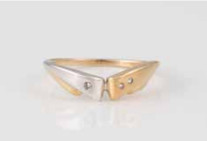
173 | DIAMANT-RING Gelbgold, Weißgold. Ringmaß ca. 54, Ges.-Gew. ca. 2,2 g. Gest. 585, Herstellerzeichen, Caratan-gabe der Diamanten gemarkt. Drei Diamanten im 8/8-Schliff, zus. ca. 0,03 ct. Einlieferung aus Juwelierschließung. € 95,-