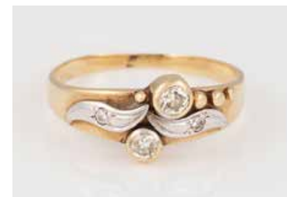
7 | DIAMANT-RING Gelbgold, Weißgold. Ringmaß ca. 59, Ges.- Gew. ca. 3,4 g. Gest. 585. Zwei kleine Brillan- ten, zus. ca. 0,02 ct., zwei Diamanten, davon einer im Altschliff, zusammen ca. 0,17 ct. Schienengröße geändert, unterer Teil dünn und gedrückt. Tragespuren. € 150,-