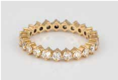
42 | ETERNITY-RING Gelbgold. Ringmaß ca. 61, Ges.-Gew. ca. 4,4 g. Gest. 750. 23 Brillanten, zus. ca. 1,6 ct. Minimale Tragespuren. € 450,-