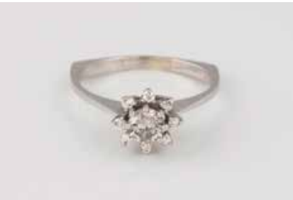
134 | BRILLANT-RING Weißgold. Ringmaß ca. 56,5, Ges.-Gew. ca. 3,3 g. Gest. 750. Ein Brillant, ca. 0,4 ct., wohl nachgeschliffen, leicht unrund, acht Brillanten, zusammen ca. 0,08 ct. Schienengröße geändert. € 180,-