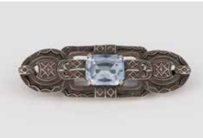
523 | BROSCHE Silber. L. 4,5 cm, Ges.-Gew. ca. 7,0 g. Gest. 835. Ein Spinell (synth.), ca. 3,8 ct. € 100,-