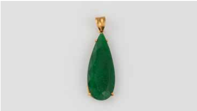
492 | ANHÄNGER Gelbgold. 3,7 x 1,1 cm, Ges.-Gew. ca. 2,9 g. Gest. 750. Ein tropfenförmig facettierter Aventurin. Ca. 2,9 x 1,2 x 0,4 cm. Tragespuren. € 250,-