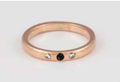
224 | EDELSTEIN-RING Rotgold. Ringmaß ca. 58, Ges.-Gew. ca. 4,1 g. Geprüft 14 K. Ein rund facettierter Saphir, leicht besch., zwei Brillanten, zus. ca. 0,06 ct. € 140,-