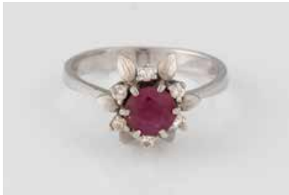
260 | RING Weißgold. Ringmaß ca. 56, Ges.-Gew. ca. 3,7 g. Gest. 585. Ein rund facettierter Rubin, ca. 0,5 ct., sechs Brillanten, zus. ca. 0,12 ct. Tragespuren. € 120,-