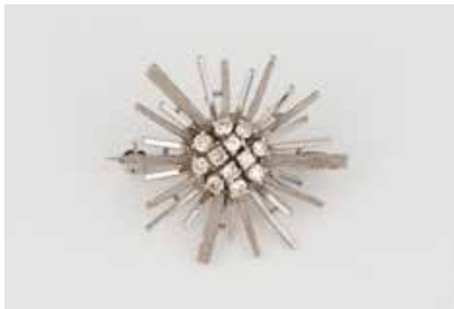
31 | KETTENSCHIEBER/BROSCHÉ Weißgold. D. ca. 3,0 cm, Ges.-Gew. ca. 6,5 g. Nadel gest. 585. 12 Brillanten, zusammen ca. 0,44 ct. € 300,-