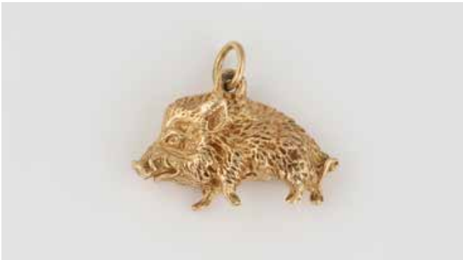
486 | ANHÄNGER ‚WILDSCHWEIN‘ Gelbgold. 2,0 x 2,4 cm, Ges.-Gew. ca. 9,1 g. Gest. 585. Vollplastische Ausführung. € 350,-