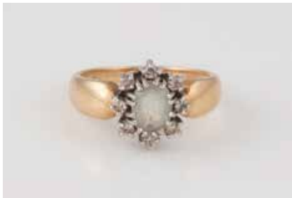
511 | RING Gelbgold, Weißgold. Ringmaß ca. 51, Ges.-Gew. ca. 3,9 g. Gest. 585. Ein oval facettierter Aquamarin, ca. 0,4 ct., acht Brillanten, zusammen ca. 0,12 ct. € 130,-