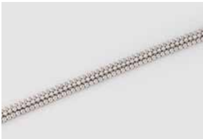
139 | BRILLANT-ARMBAND Weißgold. L. 19 cm, Ges.-Gew. ca. 36,3 g. Gest. 750. 59 Brillanten, zusammen ca. 2,0 ct., etwa Top Wesselton-Wesselton, VS-SI. € 3.400,-