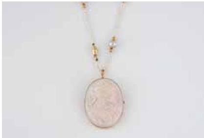
517 | KAMEE-ANHÄNGER UND PERL-COLLIER 2-tlg. Gelbgold. 1) Anhänger 5,6 x 3,5 cm, Ges.-Gew. ca. 15,7 g. Gest. 18 (K). Nachträglich Broschierung (Nadel ungeprüft). Wohl Muschelkamee (?), part. gefärbt. 2) Perl-Collier L. 42 cm, Ges. Gew. ca. 8,6 g. Gest. 585. D. der Perlen ca. 2,2 mm und sieben Perlen D. ca. 8,2 mm. € 400,-