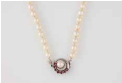
356 | PERL-COLLIER Weißgold. L. 69,5 cm, Ges.-Gew. ca. 42,6 g. Gest. 585. D. der Perlen jeweils ca. 6,5 mm, sieben rund facettierte Rubine. Tragespuren. € 120,-