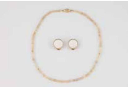
541 | KONVOLUT OPALSCHMUCK 2-tlg. Stücke gest. 585. 1) Kette L. 45,5 cm, Ges.-Gew. ca. 9,8 g. Wohl Mondstein oder Opal-Perlen, D. ca. 4,3 mm. 2) Paar Ohrclips mit jeweils einem Opal, ca. 17,1 x 3,5 mm. Ges.-Gew. ca. 12,3 g. Min. besch. € 400,-