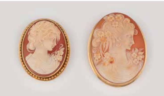
528 | KONVOLUT KAMEE-SCHMUCK 2-tlg. Gelbgold. Ges.-Gew. zus. ca. 27,1 g. An beiden Stücken Rahmung gest. 750. 4,5 x 3,5 cm, mit Broschierung. 5,2 x 4 cm, Montierung einer Broschierung, Nadel fehlend. Beide mit Hängeösen (nachträglich, unge-prüft). € 380,-