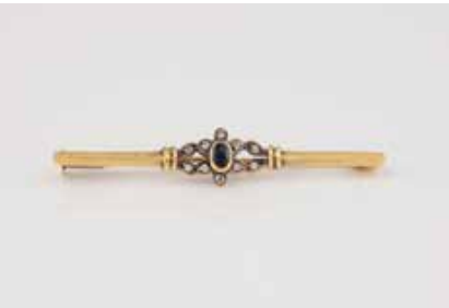
227 | EDELSTEIN-BROSCH Gelbgold. L. 4,9 cm, Ges.-Gew. ca. 3,1 g. Geprüft 18 K. Ein oval facettierter Saphir, 10 Diamanten im 8/8-Schliff. Minimalst besch. € 140,-