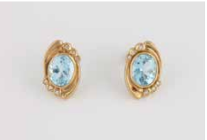
238 | PAAR EDELSTEIN-OHRSTECKER Gelbgold. 1,9 x 1,3 cm, Ges.-Gew. ca. 7,7 g. Geprüft 14 K. Jeweils ein oval facettierter Topas, zusammen ca. 5,9 ct., zusammen 12 Brillanten, zus. ca. 0,09 ct. € 250,-