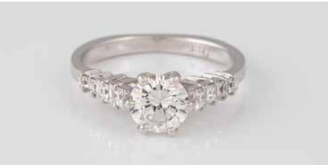
158 | DIAMANT-RING Weißgold. Ringmaß ca. 52, Ges.-Gew. ca. 3,20 g. Gest. 585. Ein natürlicher Brillant, ca. 0,90 ct., Colorless to Near Colorless (F-G), VVS2, Finish: Very Good/Very Good. Acht natürliche Diamanten im Square Step Cut, zus. ca. 0,40 ct., Colorless (D-E-F), VVS, Finish: Good - Very Good. Alle Angaben laut beigefügtem Report. Expertise: Identification Report: IGI (International Gemological Institute), Antwerpen, Februar 2018. Im gefassten Zustand bewertet. € 4.600,-