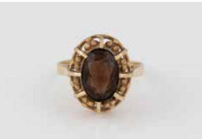
502 | RAUCHQUARZ-RING Gelbgold. Ringmaß ca. 55, Ges.-Gew. ca. 4,7 g. Gest. 585. Ein oval facettierter Rauchquarz, ca. 2,2 ct. € 80,-