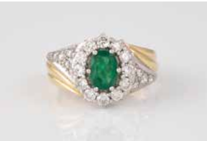
287 | EDELSTEIN-RING Gelbgold, Weißgold. Ringmaß ca. 55, Ges.-Gew. ca. 6,7 g. Gest. 585. Ein oval facettierter Smaragd, ca. 0,85 ct., 22 Brillanten, zus. ca. 0,92 ct., etwa Top Wesselton, VS-SI. Leichte Tragespuren. € 950,-