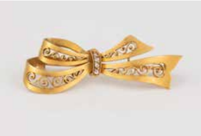
473 | SCHLEIFEN-BROSCH MIT DIAMANTEN Gelbgold. 4 x 1,5 cm, Ges.-Gew. ca. 3,9 g. Gest. 585. Vier Diamantrosen. Verso eine Lötstelle. € 130,-