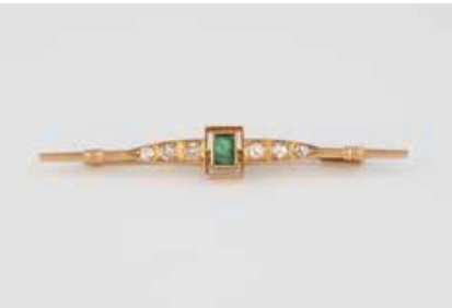
304 | EDELSTEIN-BROSCHKE Gelbgold. 5,3 cm, Ges.-Gew. ca. 3,1 g. Geprüft 18 K. Ein Smaragd, ca. 0,2 ct., sechs Diamanten im Alt- und 8/8-Schliff, zusammen ca. 0,24 ct. Tragespuren. € 120,-