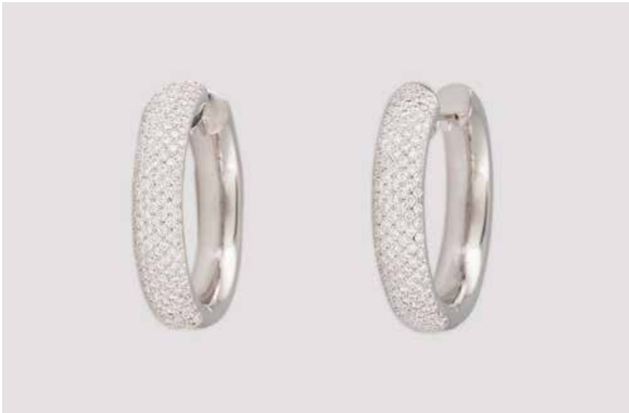
82 | PAAR DIAMANT-OHRCREOLEN Weißgold. D. 3,3 cm, Ges.-Gew. ca. 22,7 g. Gest. 750. Zusammen ca. 286 Brillanten, zus. ca. 2,80 ct., etwa Top Wesselton, VS-SI. € 3.000,-