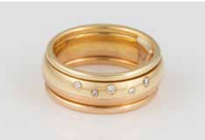
24 | BRILLANT-RING ‚ELDINO‘ Gelbgold, Rotgold. Ringmaß ca. 55, Ges.-Gew. ca. 12,2 g. Gest. 750, Modellname ‚Eldino‘ (Hersteller Rauschmayer - Pforzheim). Außenring mit beweglich eingesetztem Innenring. Innenring mit fünf Brillanten, zusammen ca. 0,04 ct. € 550,-