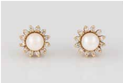
363 | PAAR OHRSTECKER Gelbgold. D. ca. 1,2 cm, Ges.-Gew. ca. 4,6 g. Gest. 585. Jeweils eine Perle, D. ca. 6,3 mm, jeweils 12 Brillanten, zusammen ca. 0,24 ct. € 150,-