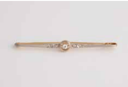
59 | DIAMANT-BROSCH Gelbgold, Weißgold. L. 5,5 cm, Ges.-Gew. ca. 3,9 g. Gest. 18 K. Ein Diamant im Altschliff, ca. 0,1 ct., vier Diamantrosen. € 180,-