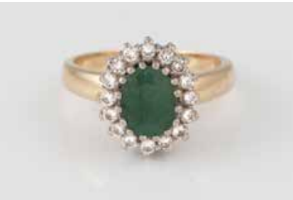
286 | SMARAGD-RING MIT DIAMANTEN Gelbgold, Weißgold. Ringmaß ca. 58, Ges.-Gew. ca. 6,6 g. Gest. 585. 16 Brillanten, zusammen ca. 0,5 ct., ein oval facettierter Smaragd, ca. 1,4 ct. Tragespuren. € 160,-