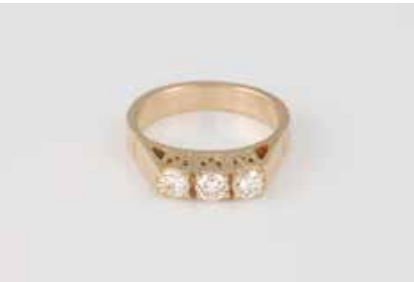
153 | BRILLANT-RING Gelbgold. Ringmaß ca. 50, Ges.-Gew. ca. 4,2 g. Geprüft 14 K. Drei Brillanten, zusammen ca. 0,4 ct. Min. besch. € 200,-