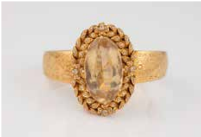
438 | ARMREIF Gelbgold. Innenmaß ca. 5,3 x 4,8 cm, Ges.-Gew. ca. 47,9 g. Gest. 750, weitere Punzierungen. Ein oval facettierter Citrin, ca. 30,0 ct., 60 Diamanten im 8/8- und Rosenschliff. Minimal besch. € 1.800,-