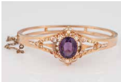
252 | ARMREIF Rotgold. Innenmaß ca. 6,1 x 5,1 cm, Ges.-Gew. ca. 12,5 g. Gest. 585. Zwei Saatperlen, ein oval facettierter Amethyst, ca. 5,9 ct., minimalste Tragespuren. € 380,-