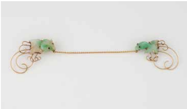
489 | KRAGENSCHMUCK Gelbgold. L. jeweils ca. 3,8 cm, Ges.-Gew. ca. 8,5 g. Gest. 14 K, Herstellerzeichen (?). Jeweils eine Fischfigur, geschnitten aus Jadeit. € 450,-