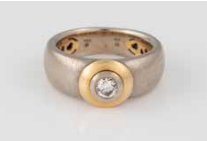
102 | BRILLANT-RING Gelbgold, Weißgold. Ringmaß ca. 54, Ges.- Gew. ca. 12,3 g. Gest. 750, Herstellersignet, Carat- und Reinheitsangabe des Diamanten. Ein Brillant, ca. 0,25 ct., SI Tragespuren. € 400,-