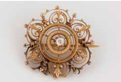
177 | DIAMANT-BROSCHÉ Gelbgold. D. ca. 2,4 cm, Ges.-Gew. ca. 3,6 g. Schaustück gest. 585, Nadel ungeprüft. Ein Diamant im Altschliff, ca. 0,07 ct. Part. min. besch., wohl rest. € 120,-