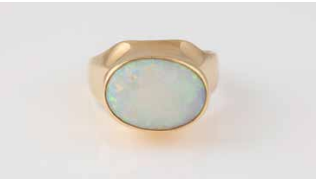
404 | OPAL-RING Gelbgold. Ringmaß ca. 61,5, Ges.-Gew. ca. 9,9 g. Gest. 585, Herstellerzeichen Goldschmiede Bremer ‚HB‘ (Hans Bremer). Ein ovaler Opal, wohl Doublette oder Triplette, ca. 15,7 x 11,1 x 3,9 mm. Tragespuren. € 390,-