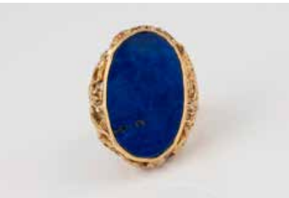
416 | LAPISLAZULI-RING Gelbgold. Ringmaß ca. 61, Ges.-Gew. ca. 19,2 g. Schiene geprüft 18 K. Schultern mit strukturierter Durchbrucharbeit, eine ovale Lapislazuli-Platte, ca. 28 x 16 mm. € 750,-