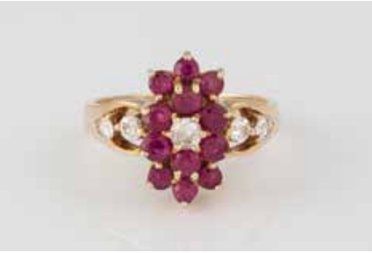
269 | RING Gelbgold. Ringmaß ca. 53, Ges.-Gew. ca. 4,1 g. Gest. 585. Fünf weiße, rund facettierte Simili- steine, 12 rund facettierte Rubine. Besch. € 100,-