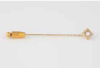
156 | DIAMANT-NADEL Gelbgold. L. 6,8 cm, Ges.-Gew. ca. 2,1 g. Gest. 585. Ein Brillant, ca. 0,16 ct., etwa Wesselton, VS-SI. Einlieferung aus Juwelierschließung. € 180,-