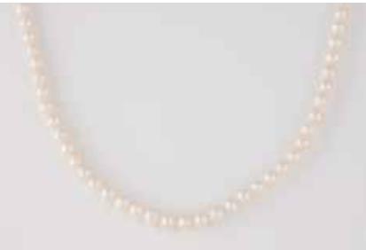
537 | PERLENKETTE L. ca. 180 cm. Ges.-Gew. ca. 146 g. D. der Perlen ca. 7,5 mm, rund und leicht oval. € 300,-