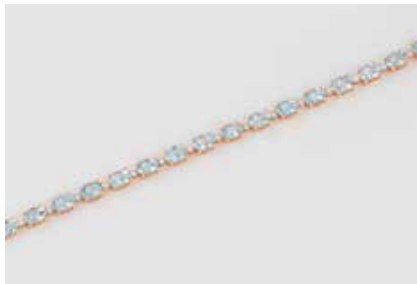
241 | TOPAS-ARMBAND Rotgold. L. 18 cm, Ges.-Gew. ca. 9,4 g. Gest. 750. 22 Brillanten, zus.ca. 0,52 ct., 22 oval facettierte Topase, zus. ca. 11,0 ct. € 1.500,-