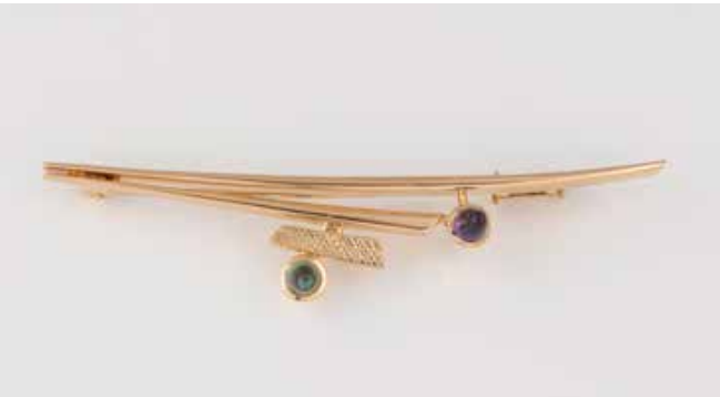
532 | BROSCHE Gelbgold. L. 5,9 cm, Ges.-Gew. ca. 5,2 g. Gest. 750. Ein Amethyst und ein Turmalin im hochspitzen Cabochonschliff. Einlieferung aus Juwelierschließung. € 280,-