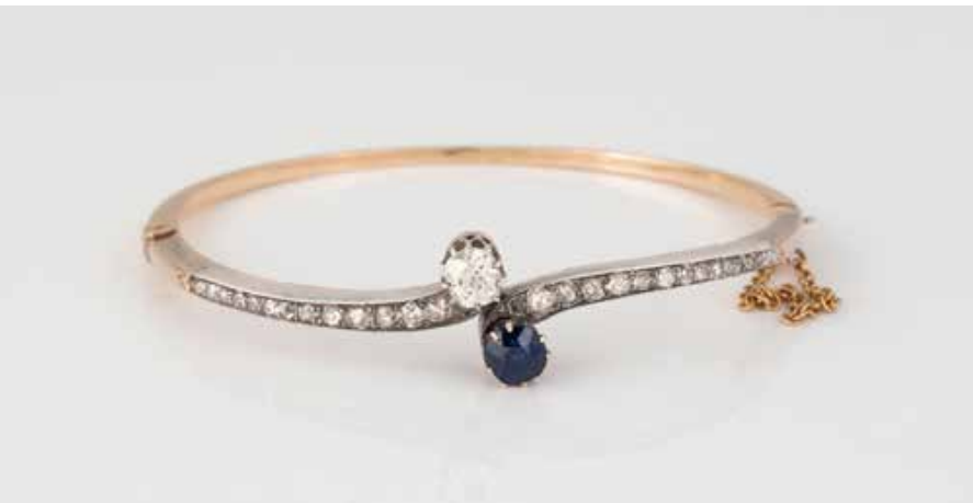
206 | EDELSTEIN-ARMREIF Gelbgold, Platin. Innenmaß ca. 5,5 x 4,8 cm, Ges.-Gew. ca. 13,8 g. Gest 585, weitere Punzierungen. Ein rund facettierter Saphir, ca. 0,92 ct. ein Diamant im Altschliff, ca. 0,5 ct., 28 Diamanten im Alt- und Rosenschliff. Leichte Tragespuren. € 900,-