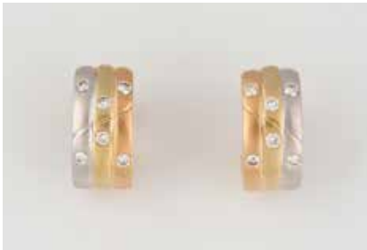
69 | PAAR OHRSTECKER Gelbgold, Weißgold, Rotgold. 1,7 x 0,9 cm, Ges.-Gew. zus. ca. 7,2 g. Geprüft 750 (Sicher- heitsstecker 585, Gew. ca. 0,8 g). Zusammen besetzt mit 12 Brillanten, zusammen ca. 0,33 ct. € 350,-