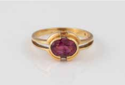
265 | RING Gelbgold. Ringmaß ca. 52, Ges.-Gew. ca. 3,0 g. Gest. 750, Herstellersignet. Ein oval facettier- ter Turmalin, ca. 1,1 ct. Besch. € 150,-