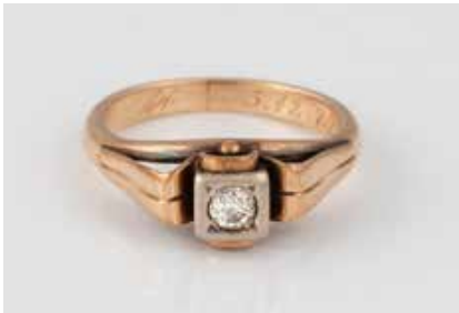
111 | BRILLANT-RING Rotgold. Ringmaß ca. 54, Ges.-Gew. ca. 4,4 g. Gest. 585, Caratangabe graviert, Reste einer persönlichen Gravur. Ein Brillant, ca. 0,15 ct. Schienengröße geändert. € 150,-