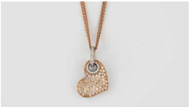
49 | DIAMANT-ANHÄNGER MIT KETTE Gelbgold, Weißgold. Anhänger 2,8 x 1,9 cm, Ges.-Gew. ca. 9,5 g. Gest. 750. Herzform, besetzt mit Brillantbesatz. Zweireihige Kette, L. 43,5 - 47,5 cm. Geprüft 18 K, Gew. ca. 7,7 g. € 1.500,-