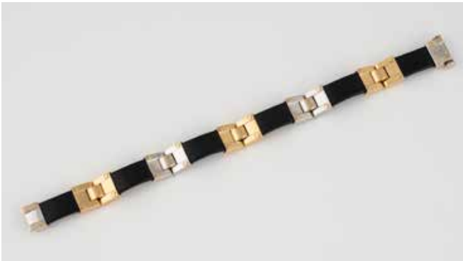
497 | ARMBAND Gelbgold, Weißgold. L. 19,5 cm, Ges.-Gew. ca. 40,4 g. Gest. 750, italienische Marke für Vicenza, Herstellerzeichen. Gold- und Kautschuk-Elemente. € 1.800,-