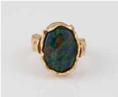
400 | RING Gelbgold. Ringmaß ca. 57, Ges.-Gew. ca. 8,3 g. Gest. 585, Herstellerzeichen. Eine Opal-Triplette, ca. 16,9 x 12,3 x 3,6 mm. € 280,-