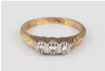
115 | DIAMANT-RING Gelbgold, Weißgold. Ringmaß ca. 49, Ges.- Gew. ca. 3,3 g. Schiene geprüft 14 K. Schultern fein dekoriert, drei Brillanten, zusammen ca. 0,12 ct. Schienengröße geändert, part. ange- laufen. € 220,-