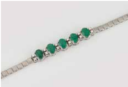
297 | SMARAGD-ARMBAND Weißgold. L. 18 cm, Ges.-Gew. ca. 17,4 g. Gest. 750. 12 weiße, rund facettierte Edelsteine. Fünf oval facettierte Smaragde, zusammen ca. 3,1 ct. Leichte Tragespuren. € 900,-