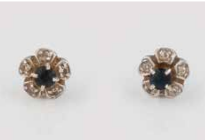
522 | PAAR OHRSTECKER Weißgold. D. 0,6 cm, Ges.-Gew. ca. 1,7 g. Ge-prüft 14 K (Sicherheitsstecker ungeprüft). Je-weils ein rund facettierter Saphir, zusammen 10 Diamanten. Besch. € 70,-