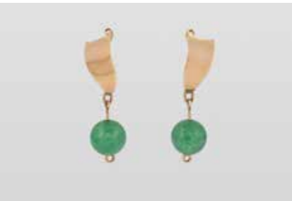
313 | PAAR OHRHÄNGER Gelbgold. L. 4,5 cm, Ges.-Gew. ca. 9,1 g. Gest. 14 K, ‚Mahoney‘. Jeweils eine Jadeit-Kugel, D. ca. 12,0 mm. € 80,-