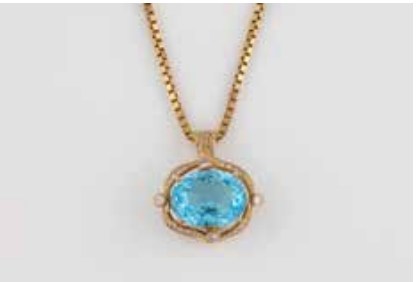
240 | TOPAS-ANHÄNGER MIT KETTE Gelbgold. Anhänger 2,5 x 2,4 cm, Ges.-Gew. ca. 7,2 g. Geprüft 14 K. Ein oval facettierter Topas, ca. 13,0 ct., vier Brillanten, zusammen ca. 0,14 ct., 16 Brillanten, zusammen ca. 0,1 ct. Minimale Tragespuren. Kette gest. 333. L. 51 cm, Ges.-Gew. ca. 10 g. € 650,-