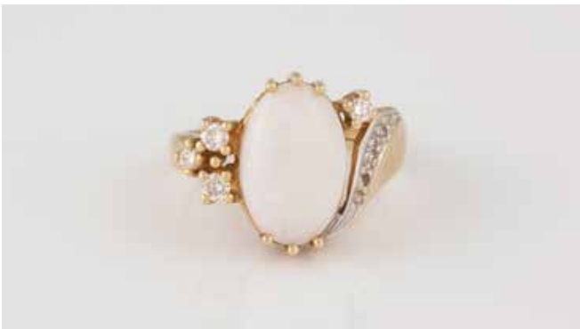
411 | RING Gelbgold, Weißgold. Ringmaß ca. 48, Ges.-Gew. ca. 2,9 g. Gest. 585. Ein ovaler Opal, ca. 11,4 x 7,9 x 2,9 mm, vier Brillanten, zus. ca. 0,1 ct., drei kleine Diamanten im 8/8-Schliff. € 100,-