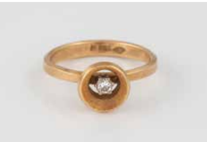
161 | DIAMANT-RING Gelbgold. Ringmaß ca. 54, Ges.-Gew. ca. 4,0 g. Gest. 750, Herstellerzeichen, Caratangabe des Diamanten gemarkt. Ein Brillant, ca. 0,09 ct. € 160,-