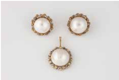
362 | SCHMUCK-SET 2-tlg. Gelbgold, Weißgold. Gest. oder geprüft 14 K, Ges.-Gew. zus. ca. 24,0 g. Anhänger 3,5 x 2,4 cm, Mabe-Perle D. ca. 18,3 mm. Paar Ohrclips D. 2,2 cm, Mabe-Perle jeweils D. ca. 16,0 mm. € 600,-