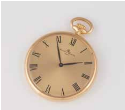
559 | FRACKUHR ,BAUME & MERCIER' Schweiz, 20. Jh. Gelbgold. D. 4,1 cm, Ges.-Gew. ca. 40,5 g. 14 K. Goldfarbenes Zifferblatt, bez. ,Baume & Mercier - Geneve - Swiss Made', römische Ziffern, Stunden- und Minutenzeiger. Bei der Prüfung funktionstüchtig. Aufgearbeitet, überholt und gereinigt 2021. € 830,-