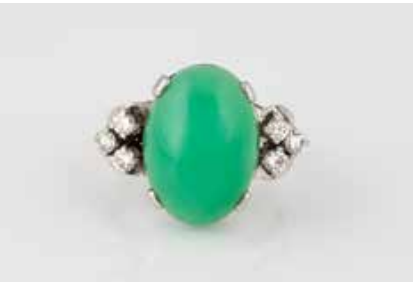
316 | CHRYSOPRAS-RING MIT BRILLANTEN Weißgold. Ringmaß ca. 55,5, Ges.-Gew. ca. 8,1 g. Gest. 585. Ein ovaler Chrysopras-Cabochon, ca. 17,9 x 12,8 x 6,3 mm, sechs Brillanten, zu- sammen ca. 0,3 ct. € 750,-