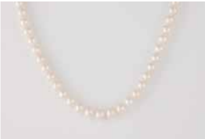
358 | PERL-COLLIER ‚SCHOEFFEL‘ Gelbgold. L. 42 cm, Ges.-Gew. ca. 36,3 g. Gest. 750, Herstellerzeichen. D. der Perlen ca. 7,8. € 400,-