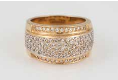
28 | DIAMANT-RING Gelbgold. Ringmaß ca. 58,5, Ges.-Gew. ca. 18,1 g. Gest. 585. Ca. 105 Brillanten, zusammen ca. 0,84 ct. Leichte Tragespuren. € 600,-