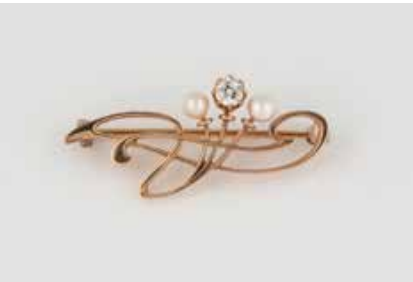
375 | PERL-BROSCHE MIT DIAMANT Gelbgold. 3,6 cm, Ges.-Gew. ca. 3,9 g. Gest. 585. Zwei Perlen, D. ca. 3,8 mm, ein Diamant im Altschliff, ca. 0,22 ct. € 200,-