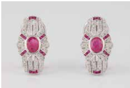
258 | PAAR EDELSTEIN-OHRSTECKER Weißgold. 2,1 x 1,3 cm, Ges.-Gew. ca. 6,5 g. Gest. 585. Zus. 26 Rubine, zus ca. 2,20 ct., zus. 80 Diamanten, zus. ca. 0,34 ct. € 1.300,-