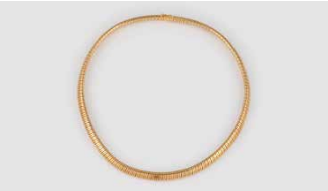
494 | COLLIER Gelbgold, Weißgold. L. 43 cm, Ges.-Gew. ca. 39,5 g. Gest. 750, bez. ‚Cartier‘, nummeriert. Flexible Glieder, Turbogas, innenliegendes Band nicht prüfbar. € 2.000,-