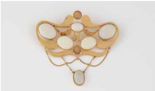
408 | OPAL-BROSCH / ANHÄNGER Gelbgold. 7,3 x 6,7 cm, Ges.-Gew. ca. 13,8 g. Gest. 750, Herstellerzeichen Goldschmiede Bremer ‚HB‘ (Hans Bremer). Sechs Opale, Größen von ca. 10,6 x 7,2 x 3,3 mm bis 15,8 x 11,8 x 4,1 mm. Part. als Doubletten gearbeitet. Leicht besch. € 650,-