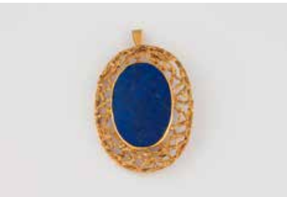
415 | ANHÄNGER/BROSCHÉ MIT LAPISLAZULI Gelbgold. 5,3 x 4,0 cm, Ges.-Gew. ca. 27,6 g. Geprüft 18 K. Ovale Lapislazuli-Platte, ca. 3,4 x 2,3 x 0,4 cm. Hängeöse einklappbar, Broschierung. € 1.100,-