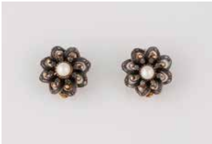
384 | PAAR OHRCLIPS Gelbgold, Silber. D. 1,6 cm, Ges.-Gew. ca. 8,3 g. Clipbügel gest. 750, weitere Punzierungen leicht verschlagen. Jeweils eine Perle, ca. 4,7 mm, 16 kleine Diamantrosen. € 500,-