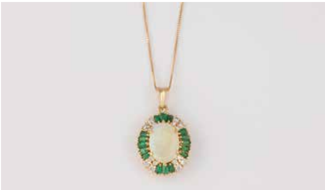
403 | OPAL-ANHÄNGER MIT KETTE Gelbgold. Anhänger 3,0 x 1,9 cm, Ges.-Gew. ca. 6,5 g. Gest. 750. Ein ovaler Opal, ca. 13,9 x 9,8 x 3,2 mm, 16 Smaragde im Trapezschliff, 16 Brillanten, zusammen ca. 0,50 ct., etwa Top Wesselton, VS-Sl. Min. besch. Kette L. 44,5 cm, gest. 750, Gew. ca. 1,6 g. € 1.200,-