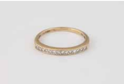
180 | DIAMANT-RING Gelbgold. Ringmaß ca. 55, Ges.-Gew. ca. 2,1 g. Gest. 585, Herstellerzeichen, Carat- und Reinheitsangabe der Diamanten gemarkt. 14 Brillanten, zusammen ca. 0,14 ct., SI. € 70,-