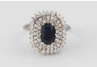
191 | EDELSTEIN-RING Weißgold. Ringmaß ca. 55, Ges.-Gew. ca. 6,9 g. Gest. 750. 72 Diamanten im 8/8-Schliff, zus. ca. 0,64 ct., ein oval facettierter Saphir, ca. 1,7 ct. Min. Tragespuren. € 280,-