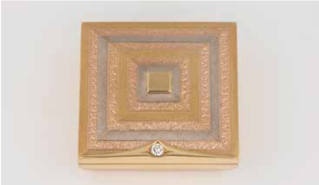
495 | SCHMUCK-DOSE Gelbgold, Weißgold, Rotgold. 4,4 x 4,4 x 1,5 cm, Ges.-Gew. ca. 53,3 g. Gest. 750, Stadtmarke London, Jahresbuchstabe ‚K‘ (1984), Makers Mark ‚R&R‘ (Ramsden & Roed). Ein Brillant, D. ca. 3,6 mm (Höhe nicht messbar). € 2.950,-