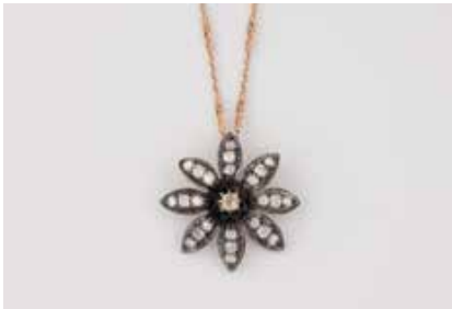
146 | DIAMANT-ANHÄNGER MIT KETTE Rotgold, Silber. Anhänger D. 3,8 cm, Ges.-Gew. ca. 9,4 g. Ges.-Gew. ca. 9,4 g. Anhänger (umgearbeitet) mit 25 Diamanten im Altschliff, zus. ca. 2,50 ct. Kette L. 80,5 cm, 14 K, Gew. ca. 7,8 g. (Karabiner später ergänzt, Gelbgold). € 2.500,-