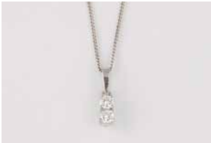
142 | BRILLANT-ANHÄNGER MIT KETTE Weißgold. Anhänger 1,4 cm, Kette 42 cm. Ges.-Gew. ca. 1,9 g. Gest. 585, Caratangabe der Diamanten gemarkt. Zwei Brillanten, zusammen ca. 0,30 ct., etwa Wesselton, SI-P. Einlieferung aus Juwelierschließung. € 190,-