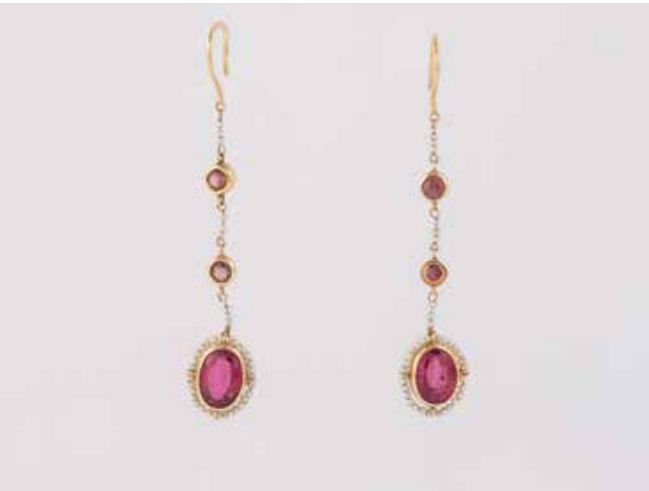
322 | PAAR OHRHÄNGER Gelbgold. L. 6,4 cm, Ges.-Gew. ca. 4,9 g. Geprüft 14 K. Jeweils ein oval facetierter Turmalin, zusammen ca. 3,5 ct. jeweils zwei rund facettierte Turmaline. Kleine Saatperlen. € 600,-