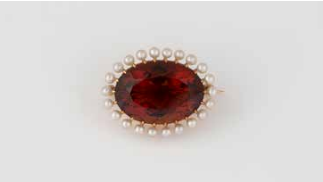
447 | BROSCHE Gelbgold. 2,9 x 2,1 cm, Ges.-Gew. ca. 7,8 g. Geprüft 14 K. Umlaufender Perlbesatz, ein oval facettierter Citrin, ca. 21,6 ct. € 400,-