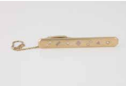
58 | KRAWATTEN-KLAMMER MIT DIAMANT- BESATZ Gelbgold, Weißgold. L. 4,8 cm, Ges.-Gew. ca. 7,6 g. Gest. 585, Caratangabe der Diamanten ge- markt. Sechs Brillanten, zusammen ca. 0,11 ct., etwa Top Wesselton - Wesselton, VS-SI. Einlieferung aus Juwelierschließung. € 330,-