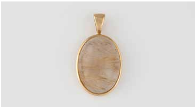
412 | ANHÄNGER Gelbgold. 3,7 x 2,0 cm, Ges.-Gew. ca. 7,8 g. Gest. 375. Ein ovaler Rutilquarz-Cabochon, ca. 23,8 ct. Leichte Tragespuren. € 120,-