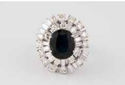
190 | EDELSTEIN-RING Weißgold. Ringmaß ca. 53, Ges.-Gew. ca. 9,4 g. Gest. 750. Ein oval facettierter Saphir, ca. 8,0 ct., 36 Diamanten im Brillant- und Baguette-schliff, zusammen ca. 3,5 ct. Minimalste Tragespuren. € 3.000,-