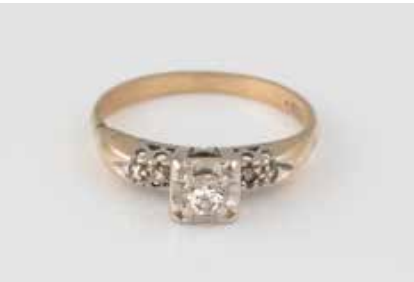
178 | DIAMANT-RING Gelbgold, Weißgold. Ringmaß ca. 53, Ges.-Gew. ca. 2,3 g. Gest. 585. Ein Brillant, ca. 0,15 ct., vier Diamanten im 8/8-Schliff, zus. ca. 0,02 ct. € 50,-