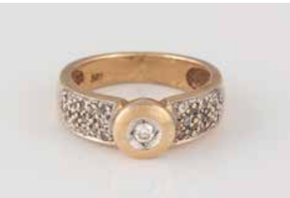
162 | BRILLANT-RING Gelbgold, Weißgold. Ringmaß ca. 48, Ges.-Gew. ca. 4,7 g. Gest. 585. Ein Brillant, ca. 0,04 ct., 19 Brillanten, zusammen ca. 0,11 ct. € 160,-