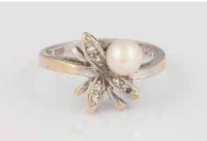
332 | PERL-RING MIT DIAMANTBESATZ Weißgold (Gelbgold an der Schiene durchscheinend). Ringmaß ca. 52, Ges.-Gew. ca. 3,2 g. Gest. 585, Herstellerzeichen, Caratangabe der Diamanten gemarkt. Sechs Diamanten im 8/8, zusammen ca. 0,06 ct., eine Perle, D. 5,4 mm. € 100,-