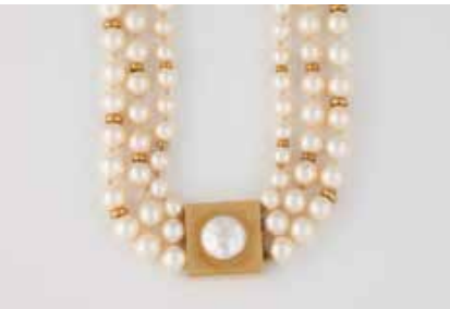
351 | PERL-COLLIER Gelbgold. L. 42 cm, Ges.-Gew. ca. 108,7 g. Schließe geprüft 18 K. Dreireihiges Collier, D. der Perlen ca. 6,1 - 7,8 mm. € 380,-