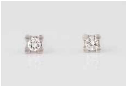
64 | PAAR DIAMANT-OHRSTECKER Weißgold. D. ca. 0,4 cm, Ges.-Gew. ca. 1,3 g. Gest. 750. Jeweils ein Brillant, zus. ca. 0,2 ct., etwa Top Wesselton, VS-SI. € 320,-