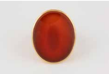
431 | KARNEOL-RING Gelbgold. Ringmaß ca. 54, Ges.-Gew. ca. 10,6 g. Gest. 750, Herstellerzeichen. Ovale Karneol-Platte, ca. 24,5 x 19,6 x 3,5 mm. € 380,-