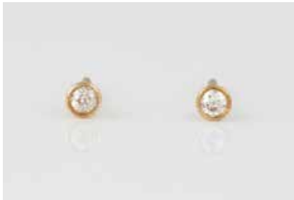
70 | PAAR BRILLANT-OHRSTECKER Gelbgold. Kopf D. ca. 0,3 cm, Ges.-Gew. ca. 0,8 g. Geprüft 14 K. Jeweils ein Diamant im Alt- schliff, zusammen ca. 0,1 ct. Besch. € 150,-