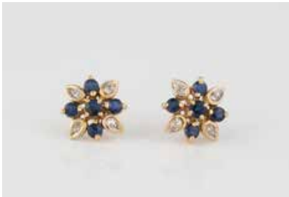
222 | PAAR OHRSTECKER Gelbgold. D. 1.0 cm, Ges.-Gew. ca. 2,0 g. 14 K. Zusammen acht Diamanten im 8/8-Schliff sowie zusammen 10 rund facettierte Saphire. € 80,-