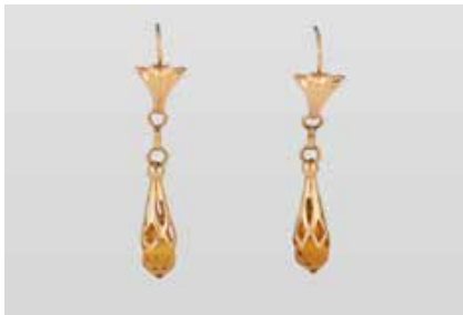
437 | PAAR OHRHÄNGER Gelbgold. L. 5,0 cm, Ges.-Gew. ca. 5,4 g. Gest. 750, Herstellerzeichen für „Uno A Erre“. Jeweils eine facettierte Schmuckstein-Pampel, citrin-farben. Min. besch. € 200,-