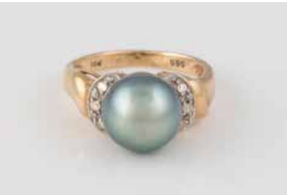
347 | RING Gelbgold. Ringmaß ca. 48, Ges.-Gew. ca. 4,2 g. Gest. 585, Herstellerzeichen. Eine Perle, D. ca. 9,3 mm, sechs Diamanten im 8/8-Schliff. € 120,-