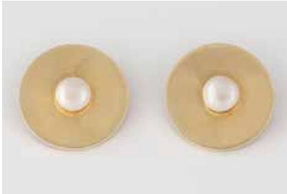
333 | PAAR-PERL-OHRCLIPS Gelbgold, Vergoldung. D. 2,8 cm, Ges.-Gew. ca. 12,4 g. Gest. 585, nachträglich ergänzte Clipbügel vergoldet. Runde Scheibenform, jeweils eine Bouton-Perle, D. ca. 9,1 mm. Verso Montierungsreste. € 450,-