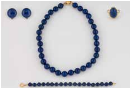
545 | KONVOLUT SCHMUCK 4-tlg. Gelbgold, Silber, Vergoldung. Kette L. 44,5. Schließe gest. 585. Armband L. 19,5 cm. Schließe vergoldet. Paar Ohrclips, D. 1,9 cm. Gest. 925. Ringmaß 55. Gest. 585. Ges.-Gew. zusammen ca. 117,8 g. Unterschiedliche Hersteller und Erhaltungszustände. € 180,-