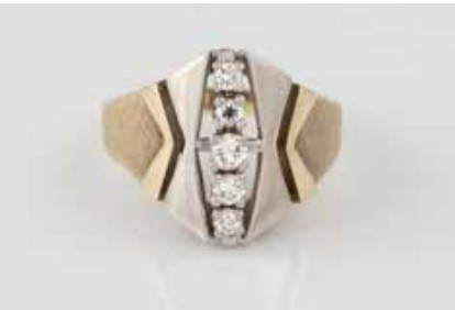
165 | BRILLANT-RING Gelbgold, Weißgold. Ringmaß ca. 54, Ges.-Gew. ca. 5,3 g. Gest. 585. Fünf Brillanten, zusammen ca. 0,27 ct. € 120,-