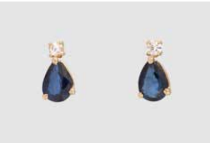
215 | PAAR EDELSTEIN-OHRSTECKER Gelbgold. 1,0 x 0,5 cm, Ges.-Gew. ca. 1,6 g. Gest. 750. Jeweils ein tropfenförmig facettierter Saphir, zus. ca. 1,30 ct., jeweils ein Brillant, zus. ca. 0,10 ct. Minimalst besch. € 360,-