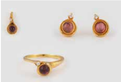
274 | SCHMUCK-SET MIT TURMALIN- BESATZ 3-tlg. Alle Stücke gest. 585. Ges.-Gew. zusam- men ca. 8,8 g. Ringmaß ca. 54. Anhänger L. 1,6 cm. Paar Ohrstecker L. 0,9 cm. Jeweils ein Bril- lant, zusammen ca. 0,09 ct. Jeweils ein Turma- lin-Cabochon, zus. ca. 2,3 ct. € 280,-