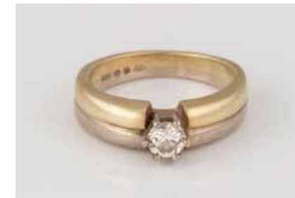
5 | BRILLANT-RING Gelbgold, Weißgold. Ringmaß ca. 49, Ges.- Gew. ca. 5,0 g. Gest. 585, Herstellerzeichen, Carat- und Reinheitsangabe des Diamanten gemarkt. Ein Brillant, ca. 0,25 ct., SI. € 180,-