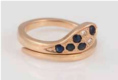
185 | SCHLANGEN-RING Gelbgold. Ringmaß ca. 58, Ges.-Gew. ca. 5,0 g. Gest. 585. Zwei Brillanten, zus. ca. 0,02 ct., fünf rund facettierte Saphire, zus. ca. 0,3 ct. Leichte Tragespuren. € 150,-