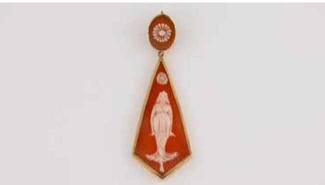
530 | ANHÄNGER ,G. DAHLGREN & CO.‘ Schweden, Malmö, 1925 Gelbgold. L. 5,9 cm, Ges.-Gew. ca. 4,4 g. Gest. 18 K, Herstellersignet ,GD & Co.‘, Stadtmarke, Jahreskombination Y7. Zweiteiliger Anhänger, Kamee mit ägyptisierender Frauendarstellung. € 200,-