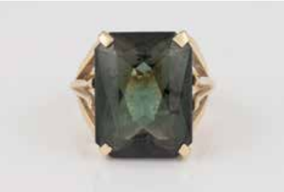
284 | TURMALIN-RING Gelbgold. Ringmaß ca. 50, Ges.-Gew. ca. 7,4 g. Geprüft 14 K. Ein Turmalin, ca. 12,5 ct. Part. leicht besch. € 220,-