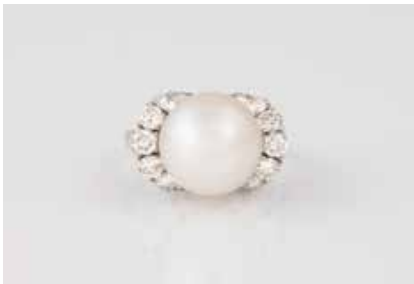
380 | PERL-RING MIT BRILLANTEN Weißgold. Ringmaß ca. 53, Ges.-Gew. ca. 6,2 g. Gest. 585, Herstellerzeichen. Eine Perle, D. ca. 12,2 mm, 16 Diamanten im Trapez- und Brillantschliff, zusammen ca. 2,0 ct., etwa Top Wesselton, VS-SI. Minimalste Tragespuren. € 1.600,-