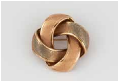
509 | KNOTEN-BROSCH Gelbgold, Rotgold. D. 3,6 cm, Ges.-Gew. ca. 9,1 g. Gest. 585. € 320,-