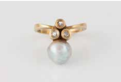
376 | PERL-RING MIT DIAMANT Gelbgold. Ringmaß ca. 52, Ges.-Gew. ca. 3,5 g. Gest. 585, Caratangabe der Diamanten geritzt. Eine Perle, D. ca. 8,0 mm, drei Diamanten im 8/8-Schliff, zusammen ca. 0,06 ct. € 180,-