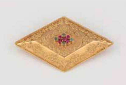
471 | BROSCH Gelbgold. 5,5 x 3,3 cm, Ges.-Gew. ca. 8,6 g. Schaustück gest. 750, nummeriert, Nadel (nachträglich) geprüft 14 K. Fein dekorierte Brosche mit Rubin- und Smaragdbesatz. € 350,-