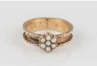
394 | HISTORISCHER PERL-RING Gelbgold. Ringmaß ca. 47, Ges.-Gew. ca. 1,7 g. Geprüft 8 K. Sieben Saatperlen. € 150,-