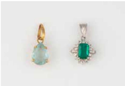
543 | KONVOLUT ANHÄNGER 2-tlg. Gelbgold, Platin. 1) Ein tropfenförmig facettierter Aquamarin, ca. 1,4 ct., L. 1,9 cm. Gest. 18 K. Ges.-Gew. ca. 0,9 g. 2) Ein Smaragd, ca. 0,68 ct., 16 Diamanten im Brillant- und Trapezschliff, zusammen ca. 0,25 ct. Gest. Pt. 950, Caratangabe der Steine gemarkt. L. 1,8 cm. Ges.-Gew. ca. 2,1 g. Tragespuren. € 850,-