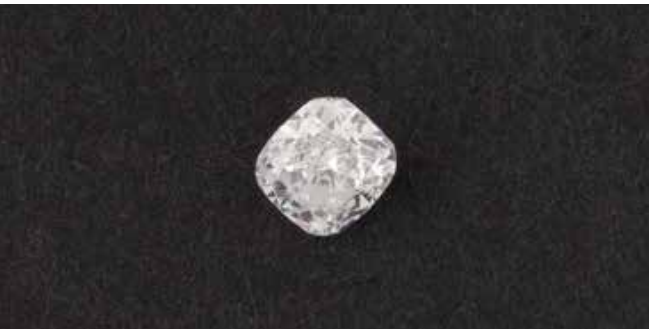
157 | DIAMANT Cushion Modified Brilliant. 0,91 ct.. (5.60 x 5.18 x 3.66 mm). Color Grade: D. Clarity Grade: Internally Flawless. Polish: Excellent. Symmetry: Very Good. Fluorescence: Very Strong Blue. Clarity Characteristics: Minor Details of Polish. Laser inscription. GIA Report, 6. April 2022. € 3.000,-