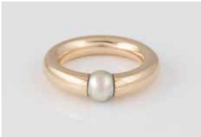
340 | PERL-RING Gelbgold. Ringmaß ca. 52, Ges.-Gew. ca. 10,9 g. Gest. 585. Eine Perle, D. ca. 6,4 mm. Tragespuren. € 350,-