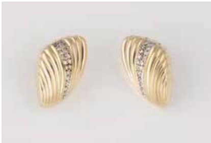
65 | PAAR DIAMANT-OHRCLIPS Gelbgold. 2,5 x 1,5 cm, Ges.-Gew. ca. 16,1 g. Gest. 585, Herstellerzeichen. 34 Diamanten im 8/8-Schliff, zus. ca. 0,27 ct., etwa Top Wessel- ton - Wesselton, VS-SI. € 680,-