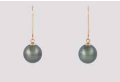
346 | PAAR PERL-OHRHÄNGER Gelbgold. L. 2,7 cm, Ges.-Gew. ca. 3,2 g. Gest. 585. Jeweils eine Perle, D. ca. 9,5 mm. Wachstumsmerkmale. € 90,-