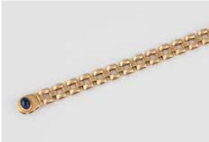
219 | SAPHIR-ARM BAND Gelbgold. L. 19 cm, Ges.-Gew. ca. 20,8 g. Gest. 585. Gliederarmband, Schließe besetzt mit einem ovalen Saphir-Cabochon, ca. 2,04 ct. € 680,-