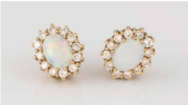
405 | PAAR OHRSTECKER Gelbgold. 1,2 x 1,0 cm, Ges.-Gew. ca. 4,4 g. Gest. 585. Jeweils ein Opal, ca. 7,3 x 5,8 x 2,2 mm, zusammen 24 Brillanten, zus. ca. 0,6 ct. Ohne Sicherheitsstecker. € 150,-