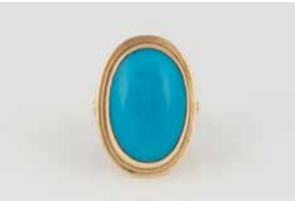
421 | TÜRKIS-RING Gelbgold. Ringmaß ca. 56, Ges.-Gew. ca. 8,8 g. Gest. 585. Ovaler Türkis-Cabochon, ca. 20,69 x 14,15 mm. Unterseite ungeschliffen. Schiengröße geändert. € 300,-