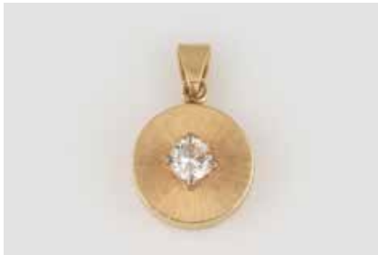
46 | BRILLANT-ANHÄNGER Gelbgold. L. 2 cm, Ges.-Gew. ca. 2,6 g. Geprüft 14 K. Ein Brillant, ca. 0,29 ct. € 380,-