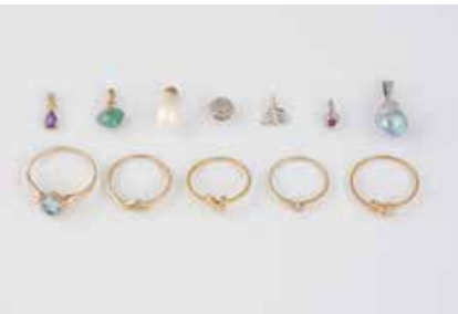
551 | KONVOLUT SCHMUCK 12-tlg. Gelbgold, Weißgold. Alle Stücke gest. oder geprüft 585 bzw. 14 K. Ges.-Gew. zus. ca. 12,2 g. Fünf Ringe, sieben Anhänger. Z.T. mit Besatz, u.a. Diamant, Perle. Einlieferung aus Juwelierschließung. € 460,-