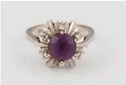
257 | AMETHYST-RING MIT DIAMANTBESATZ Weißgold. Ringmaß ca. 56, Ges. Ges.-Gew. ca. 4,7 g. Gest. 585. Ein rund facettierter Amethyst, D. ca. 7,9 mm, sechs Diamanten im 8/8-Schliff, zusammen ca. 0,09 ct. € 150,-