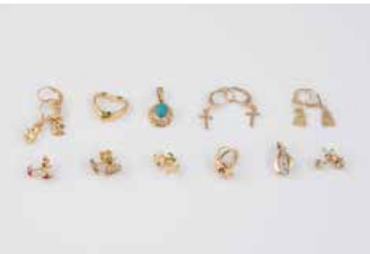
552 | KONVOLUT SCHMUCK 11-tlg. Gelbgold. Ges.-Gew. ca. 10,3 g. Alle Stücke gest. oder geprüft 333 bzw. 8 K. Acht Paar Ohrstecker, drei Anhänger. Z.T. mit Schmucksteinbesatz, (ein Stein fehlend). Einlieferung aus Juwelierschließung. € 250,-