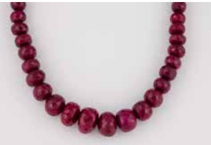
535 | RUBIN-COLLIER Metall, vergoldet. L. 49,5 cm, Ges.-Gew. ca. 160 g. Facettierte Rubine im Verlauf, D. ca. 7,2 bis 18,6 mm. Schließe mit rund facettierten Similisteinen. Tragespuren. € 150,-