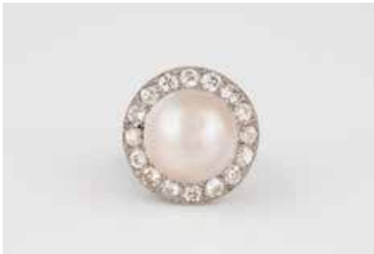
383 | PERL-RING MIT DIAMANTBESATZ Wohl Platin und Weißgold. Ringmaß ca. 58, Ges.-Gew. ca. 10,6 g. Schiene wohl Platin, Ringkopf 18 K. Eine Mabe-Perle, D. ca. 15,8 mm, 16 Diamanten im Altschliff, zusammen ca. 2,56 ct., 16 Diamantrosen Schienengröße geändert, besch. € 1.800,-