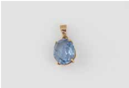
226 | ANHÄNGER Gelbgold. 2,0 x 1,0 cm, Ges.-Gew. ca. 2,1 g. Gest. 14 (K). Ein oval facettierter, blauer Farbspinell, ca. 11,8 x 9,8 x 6,9 mm. € 80,-