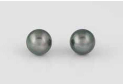
348 | PAAR PERL-OHRSTECKER Gelbgold. D. Perlen ca. 9,7 mm, Ges.-Gew. ca. 3,3 g. Gest. 585. € 100,-