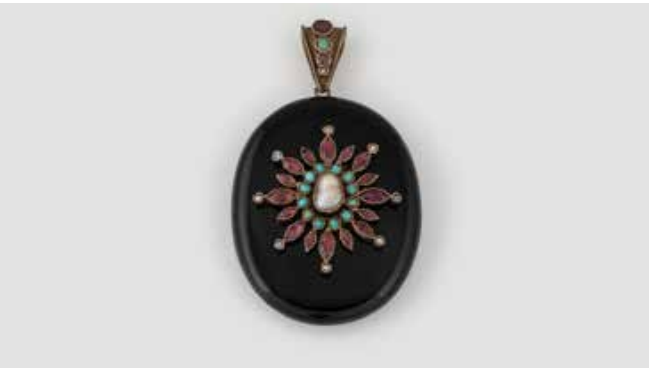
480 | MEDAILLON-ANHÄNGER Metall. 6,2 x 3,7 cm. Perlen, Türkise und rote facettierte Schmucksteine. Tragespuren. € 450,-