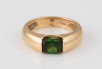
283 | PERIDOT-RING Gelbgold. Ringmaß ca. 54,5, Ges.-Gew. ca. 7,2 g. Gest. 750, Herstellerzeichen. Ein Peridot, ca. 6,4 x 5,9 mm, Höhe nicht messbar. Besch. € 300,-