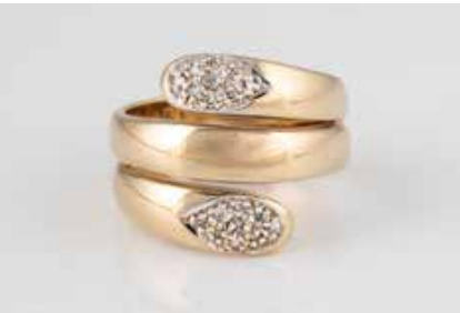
23 | DIAMANT-RING Gelbgold. Ringmaß ca. 54,5, Ges.-Gew. ca. 6,9 g. Gest. 585. 18 Diamanten im 8/8-Schliff, zusammen ca. 0,1 ct. € 300,-