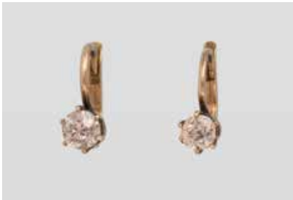
68 | PAAR DIAMANT-OHRHÄNGER Gelbgold. L. 1,0 cm, Ges.-Gew. ca. 1,5 g. Brisur geprüft 14 K. Jeweils ein Diamant im Altschliff, zusammen ca. 0,60 ct. Minimale Tragespuren. € 360,-