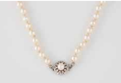
357 | PERL-COLLIER Weißgold. L. 67,5 cm, Ges.-Gew. ca. 39,2 g. Gest. 333, Herstellerzeichen. D. der Perlen jeweils ca. 6,7 mm. € 50,-