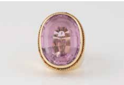
371 | RING Gelbgold. Ringmaß ca. 55, Ges.-Gew. ca. 31,1 g. Geprüft 14 K. Ein oval facettierter Kunzit (?), ca. 25,3 x 18,8 x 14,5 mm. Min. besch. € 650,-