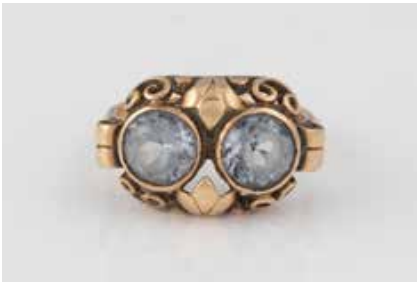
246 | RING Gelbgold. Ringmaß ca. 53, Ges.-Gew. ca. 4,4 g. Gest. 585. Zwei rund facettierte, blau-grüne Farbsteine, ca. 6,6 x 4,3 mm. Besch. € 80,-