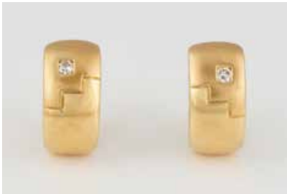
44 | PAAR OHRCREOLEN MIT BRILLANT-BESATZ Gelbgold. L. 1,5 cm, Ges.-Gew. ca. 7,8 g. Gest. 585. Jeweils ein Brillant, zus. ca. 0,08 ct. € 300,-