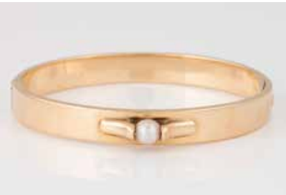
378 | PERL-ARMREIF Gelbgold. Innenmaß ca. 6,2 x 5,5 cm, Ges.-Gew. ca. 54,5 g. Gest. 585. Eine Perle, besch., D. ca. 6,1 mm. € 1.900,-