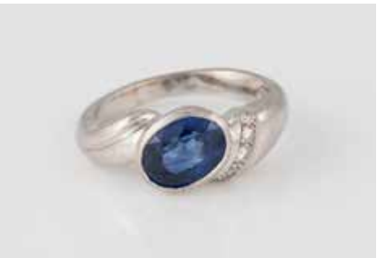
200 | EDELSTEIN-RING Weißgold. Ringmaß ca. 55, Ges.-Gew. ca. 10,5 g. Geprüft 18 K, Punzierung ungedeutet. Ein oval facettierter Saphir, ca. 3,0 ct., fünf Brillanten, zus. ca. 0,12 ct. Minimale Tragespuren. € 900,-