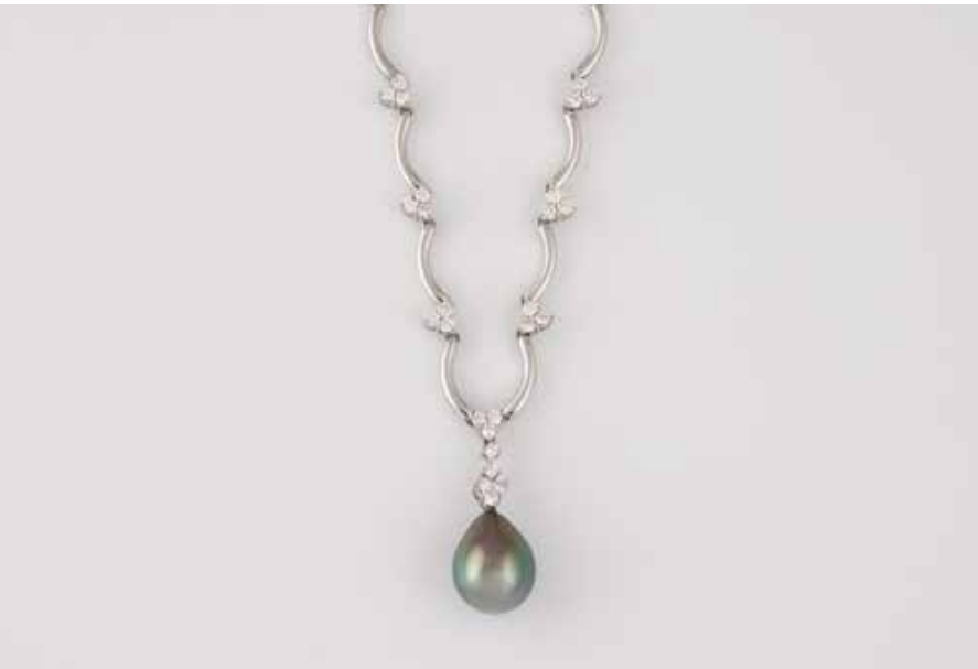
342 | PERL-COLLIER MIT DIAMANTBESATZ Weißgold. L. 41 cm, Ges.-Gew. ca. 16,2 g. Geprüft 18 K. Eine Tahiti-Perle, ca. 14,4 x 11,4 mm, 26 Brillanten, zusammen ca. 0,89 ct., etwa Top Wesselton VS-SI. € 1.600,-