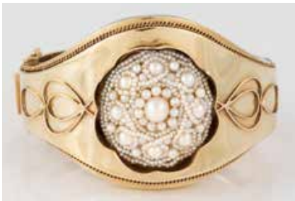
359 | PERL-ARMREIF Gelbgold. Innenmaß ca. 5,5 x 46 cm, Ges.-Gew. ca. 66,8 g. Gest. 585, Herstellerzeichen ,HB' (Hans Bremer). Übereinandergelegte Saatperlketten, unterschiedlich große Perlen. € 2.500,-