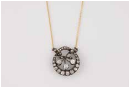
147 | DIAMANT-COLLIER Gelbgold, Silber. L. 43,5 cm, Ges.-Gew. ca. 8,7 g. Schaustück gest. 18 K, Kette (nachträglich) gest. 14 K. 30 Diamanten im Old Mine Cut, zus. ca. 3,50 ct. € 2.800,-