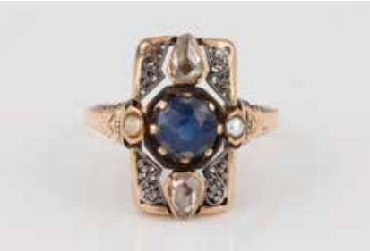
211 | RING Gelbgold, wohl Silber. Ringmaß ca. 52, Ges.-Gew. ca. 3,8 g. Geprüft 14 K. Ein rund facettierter, synth. Saphir, zwei kleine Saatperlen, zwei Diamantrosen in Tropfenform. Saphir besch., Bruchstelle gefüllt, Tragespuren. € 200,-