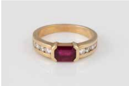
275 | EDELSTEIN-RING Gelbgold. Ringmaß ca. 56, Ges.-Gew. ca. 5,7 g. Gest. 585. Ein Rubin, stark behandelt, ca. 0,8 ct., acht Brillanten, zusammen ca. 0,30 ct. Tra- gespuren. € 120,-