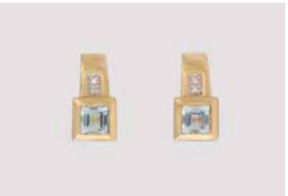
236 | PAAR OHRSTECKER Gelbgold. 1,5 x 0,8 cm, Ges.-Gew. ca. 4,8 g. Gest. 585, Herstellerzeichen. Jeweils ein Topas, ca. 4,4 x 4,2 mm, Höhe nicht messbar, jeweils zwei kleine Diamanten. € 170,-