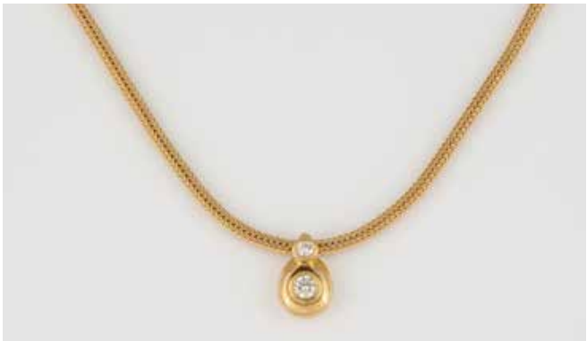
47 | BRILLANT-ANHÄNGER MIT KETTE Gelbgold. Anhänger L. 1,8 cm, Kette L. 43 cm. Ges.-Gew. zusammen ca. 24,3 g. Gest. 750, Herstellerzeichen, Caratangabe der Diamanten geritzt. Ein Brillant, ca. 0,135 ct., ein Brillant, ca. 0,344 ct. Besch. € 1.200,-