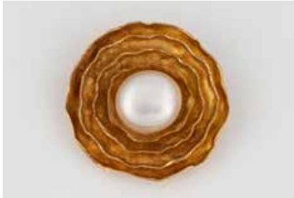
335 | PERL-BROSCHÉ Gelbgold. D. 3,0 cm, Ges.-Gew. ca. 10,6 g. Gest. 750. Eine Bouton-Perle, D. ca. 11,7 mm. € 400,-