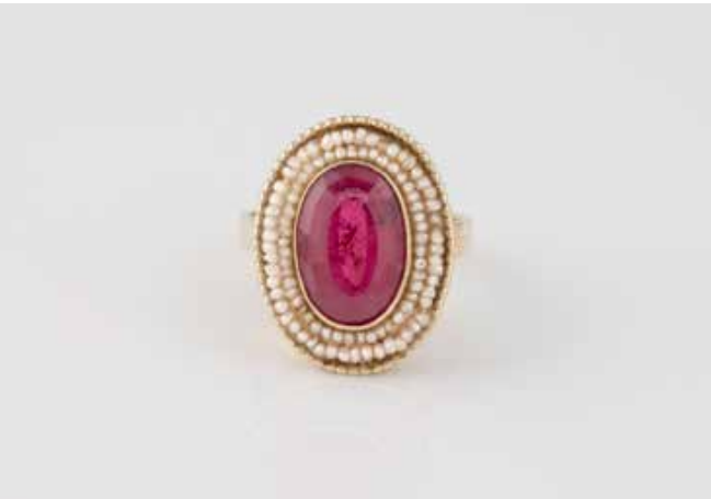
323 | RING Gelbgold. Ringmaß ca. 59, Ges.-Gew. ca. 8,1 g. Gest. 585. Ein oval facet- tierter Turmalin, ca. 5,2 ct. Saatperlbesatz. Min. besch. € 400,-