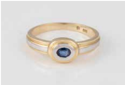
223 | RING Gelbgold, Weißgold. Ringmaß ca. 54, Ges.-Gew. ca. 2,5 g. Gest. 585, Herstellerzeichen. Ein oval facettierter Saphir, ca. 0,10 ct. € 80,-