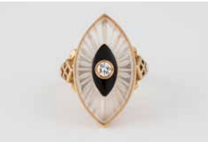
461 | RING Gelbgold. Ringmaß ca. 57, Ges.-Gew. ca. 6,3 g. Gest. 750. Ein Brillant, ca. 0,1 ct., rückseitig facettiert gearbeiteter Bergkristall (?) sowie Emaillie- oder Onyxplättchen. € 280,-