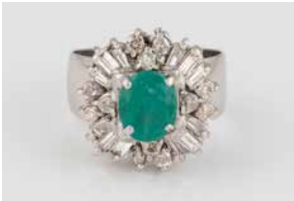
295 | EDELSTEIN-RING Weißgold. Ringmaß ca. 58, Ges.-Gew. ca. 7,6 g. Gest. 585. Ein oval facettierter Smaragd, ca. 1,7 ct., 1,2 ct. Leichte Tragespuren, min. besch. € 950,-