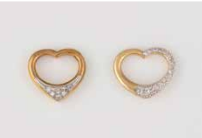
152 | ZWEI HERZ-ANHÄNGER Gelbgold, Weißgold. 1,9 x 2,0 und 1,9 x 2,2 cm. Ges.-Gew. zus. ca. 8,0 g. Gest. oder geprüft 585 bzw. 14 K. Ein Herz mit acht Brillanten, Caratangabe geritzt, ca. 0,12 ct. Ein Herz mit 31 Diamanten im 8/8-Schliff, zusammen ca. 0,15 ct. € 280,-