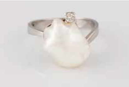
326 | PERL-RING MIT BRILLANT Weißgold. Ringmaß ca. 57, Ges.-Gew. ca. 5,6 g. Gest. 585. Ein Brillant, ca. 0,07 ct., eine Perle, ca. 15,3 x 11,5 x 5,5 mm. € 200,-