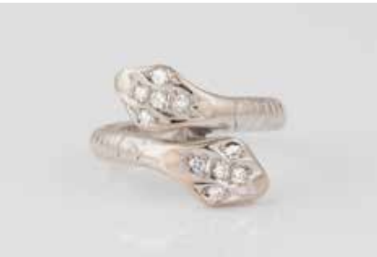
78 | SCHLANGEN-RING Weißgold. Ringmaß ca. 51, Ges.-Gew. ca. 5,4 g. Gest. 585. 10 Diamanten im 8/8-Schliff, zusammen ca. 0,10 ct., etwa Wesselton, VS-SI. Durch Goldschmied 2022 aufgearbeitet. € 250,-