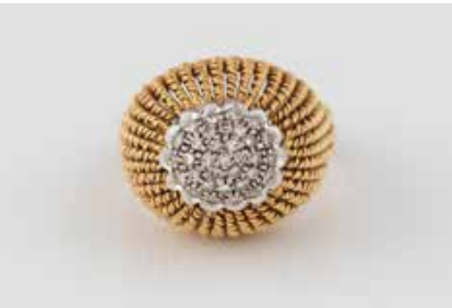
25 | DIAMANT-RING Gelbgold, Weißgold. Ringmaß ca. 53, Ges.-Gew. ca. 10,6 g. Gest. 750. 33 Diamanten im 8/8-Schliff, zus. ca. 0,2 ct. Min. Tragespuren. € 550,-