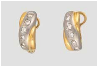
66 | PAAR DIAMANT-OHRSTECKER Gelbgold, Platin. 1,5 x 0,5 cm, Ges.-Gew. ca. 7,8 g. Gest. 950, 750, italienische Punzierung. Jeweils fünf Brillanten, zusammen ca. 0,44 ct. Ein Clipbügel locker. € 400,-