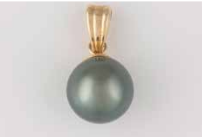
345 | PERL-ANHÄNGER Gelbgold. L. 1,9 cm, Ges.-Gew. ca. 1,5 g. Gest. 585. Eine Perle, D. ca. 9,6 mm. € 50,-