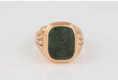
507 | JUGENDSTIL-RING Um 1900 Roségold. Ringmaß ca. 64,5, Ges.-Gew. ca. 9,7 g. Gest. 585, weitere Punzierung undeutlich. Dekorierter Schultern, ein Nephrit-Plättchen, ca. 15,6 x 12,1 mm, verso geschlossen gearbeitet. € 200,-