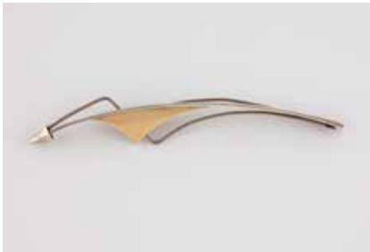
512 | MODERNE BROSCH Gelbgold, Silber. L. 8,8 cm, Ges.-Gew. ca. 7,3 g. Goldelement geprüft 18 K. € 50,-