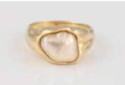
389 | RING Gelbgold. Ringmaß ca. 56, Ges.-Gew. ca. 11,6 g. Gest. 585. Eine Perle (?), L. ca. 11,7 mm, verso geschlossen gearbeitet. € 370,-