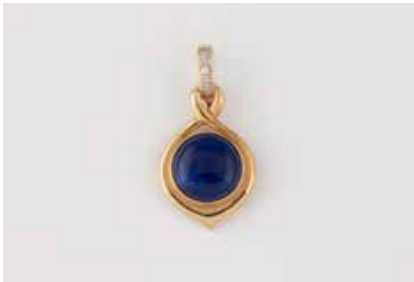
225 | ANHÄNGER Gelbgold, Weißgold. 3,4 x 1,8 cm, Ges.-Gew. ca. 3,5 g. Geprüft 14 K. Ein Lapislazuli, ca 11,7 x 3,8 mm, ein kleiner Brillant. € 100,-