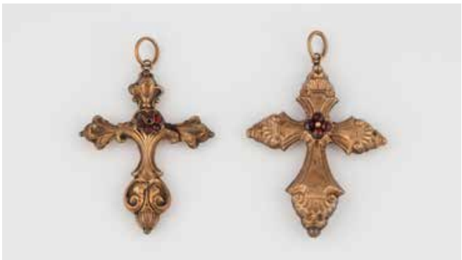
529 | ZWEI KREUZANHÄNGER Schaumgold 14 K. L. 5,0 x 3,9 cm und 4,8 x 3,8 cm. Ösen später ergänzt, bei der Länge nicht berücksichtigt. Ges.-Gew. ca. 10,6 g. Gefüllt. Granat-farbene Schmucksteine. Part. besch. € 100,-