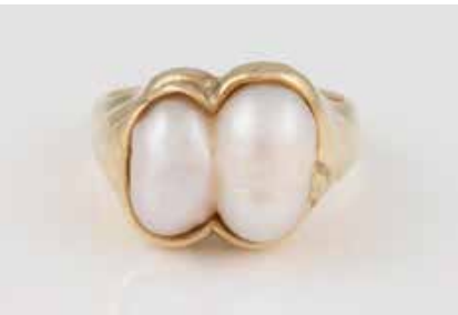
390 | RING Gelbgold. Ringmaß ca. 56, Ges.-Gew. ca. 13,2 g. Gest. 585. Zwei Perlen (?), L. ca. 11,9 und 10,2 mm, geklebt, verso geschlossen gearbeitet. € 420,-