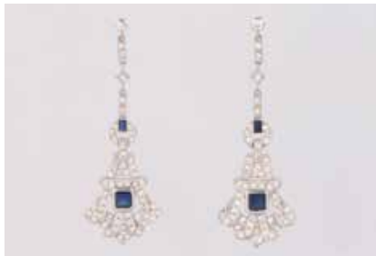
228 | PAAR EDELSTEIN-OHRSTECKER Weißgold. L. 5,8 cm, Ges.-Gew. ca. 8,8 g. Gest. 585. Jeweils zwei Saphire, zusammen ca. 1,32 ct., zus. ca. 116 Diamanten, zus. ca. 1,56 ct., etwa Top Wesselton, VS-SI. € 1.500,-