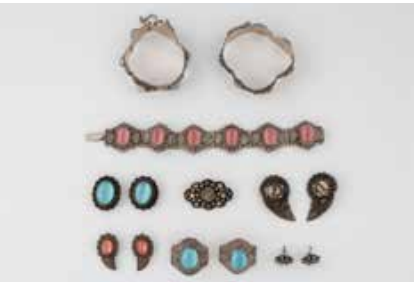
554 | KONVOLUT SCHMUCK 10-tlg. Silber. Ges.-Gew. zus. ca. 126,3 g. 3 x Armbänder, 1 x Brosche, 4 Paar Ohrclips bzw. -Stecker, 2 x Kragenschmuck. Z.T. mit Schmucksteinbesatz. Unterschiedliche Erhaltungszustände. € 220,-