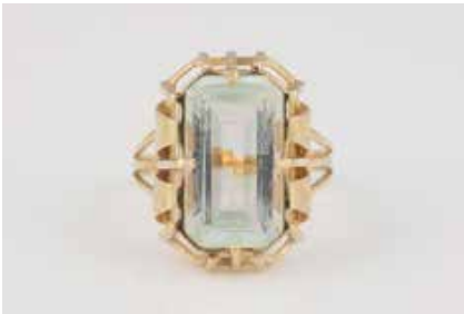
244 | RING Gelbgold. Ringmaß ca. 64, Ges.-Gew. ca. 5,7 g. Geprüft 14 K. Ein Aquamarin, ca. 8,5 ct. Minimale Tragespuren. € 140,-