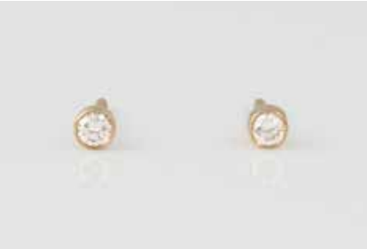
172 | PAAR BRILLANT-OHRSTECKER Gelbgold. Kopf D. ca. 0,3 cm, Ges.-Gew. ca. 0,7 g. Geprüft 14 K. Jeweils ein Brillant, zusammen ca. 0,1 ct. € 150,-