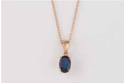
183 | SAPHIR-ANHÄNGER MIT KETTE Rotgold. Anhänger 1,3 x 0,4 cm, Ges.-Gew. ca. 0,7 g. Gest. 585. Ein oval facettierter Saphir, ca. 0,65 ct. L. Kette 45 cm, gest. 14 K, Gew. ca. 1,1 g. € 220,-