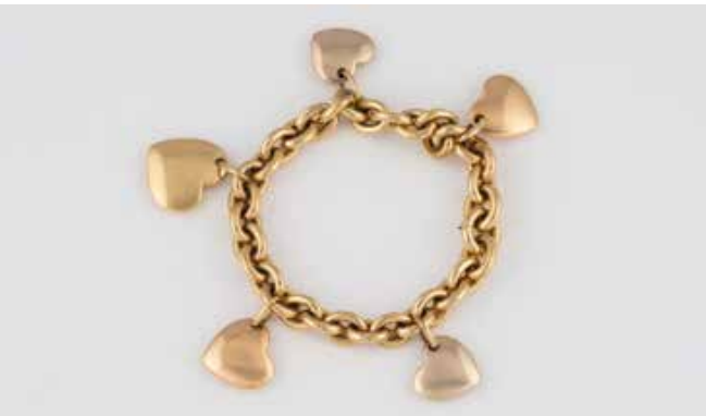
483 | ARMBAND ‚POMELLATO‘ Gelbgold. L. 19 cm, Ges.-Gew. ca. 110,2 g. Gest. 750, italienische Punzierung, Herstellerzeichen. Fünf Herzenhänger. Leichte Tragespuren. € 4.500,-