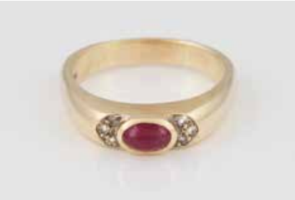
266 | EDELSTEIN-RING Gelbgold. Ringmaß ca. 60, Ges.-Gew. ca. 8,3 g. Gest. 585. Sechs Diamanten im 8/8-Schliff, ein Rubin im ovalen Cabochon-Schliff, ca. 5,4 x 3,5 mm (verso geschlossen gearbeitet). Schiene leicht unrund, min. besch. € 250,-