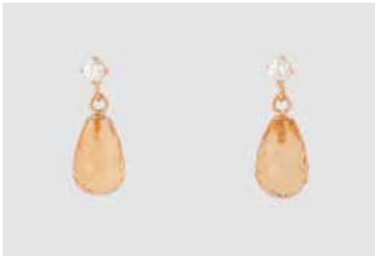
439 | PAAR CITRIN-OHRHÄNGER MIT DIAMANTBESATZ Roségold, Gelbgold. L. 2,0 cm, Ges.-Gew. ca. 3,6 g. Gest. 750. Jeweils ein Citrin im Briolette-schliff, ca. 12,1 x 7,8 mm, zus. zwei Brillanten, zus. ca. 0,28 ct., etwa Top Wesselton, VS-Sl. € 390,-