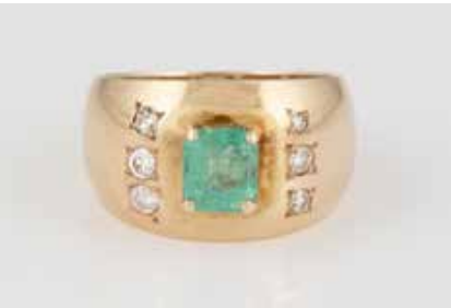
289 | SMARAGD-RING Gelbgold. Ringmaß ca. 58, Ges.-Gew. ca. 6,1 g. Geprüft 14 K. Ein Smaragd, ca. 1,24 ct., vier Brillanten, zus. ca. 0,14 ct., zwei rund facettierte Simillisteine. Besch. € 500,-