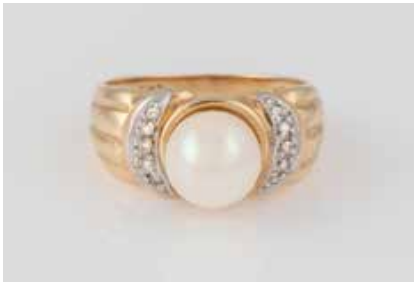
339 | PERL-RING MIT DIAMANTBESATZ Gelbgold, Weißgold. Ringmaß ca. 57, Ges.-Gew. ca. 6,6 g. Gest. 585. Eine Perle, D. ca. 8,4 mm, 10 Diamanten im 8/8-Schliff, zus. ca. 0,09 ct. € 190,-