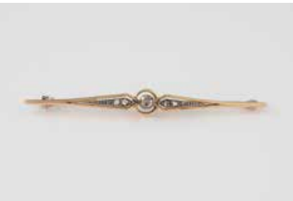
150 | DIAMANT-BROSCHÉ Gelbgold. L. 5,9 cm, Ges.-Gew. ca. 3,5 g. Geprüft 14 K. Sieben Diamantrosen. € 120,-