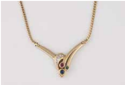
516 | EDELSTEIN-COLLIER Gelbgold. L. 42,5 cm, Ges.-Gew. ca. 8,9 g. Geprüft 14 K. Ein rund facettierter Saphir, ca. 0,15 ct., ein rund facettierter Rubin, ca. 0,06 ct., ein rund facettierter Smaragd, vier Diamanten im 8/8-Schliff, zus. ca. 0,04 ct. Einlieferung aus Juwelierschließung. € 390,-