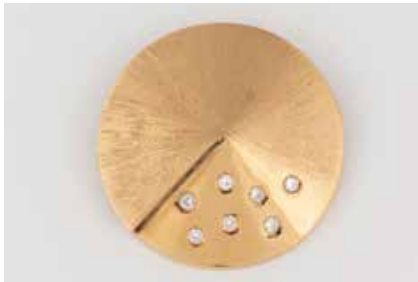
43 | ANHÄNGER/BROSCHÉ MIT BRILLANT-BESATZ Gelbgold. D. ca. 4,3 cm, Ges.-Gew. ca. 17,4 g. Schaustück gest. 750. Sieben Brillanten, zus. ca. 0,43 ct. € 800,-