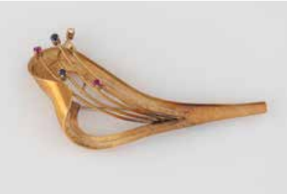
472 | BROSCH Gelbgold. L. 6,7 x 3,5 cm, Ges.-Gew. ca. 7,5 g. Gest. 18 K. Sechs rund facettierte Diamanten, Saphire und Rubine. Part. angelaufen. Besch. € 280,-