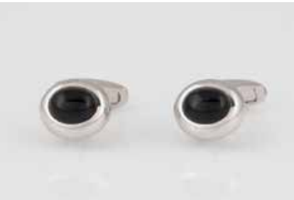
524 | PAAR MANSCHETTENKNÖPFE Weißgold. Kopf ca. 1,5 x 1,2 cm, Ges.-Gew. ca. 17,4 g. Geprüft 18 K. Kopf mit jeweils enem Onyx(?)-Cabochon, ca. 9,4 x 7,4 x 4,0 mm. € 700,-