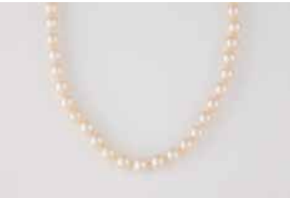
540 | PERL-COLLIER Gelbgold. L. 39,5 cm, Ges.-Gew. ca. 44,1 g. Bajonetschließe gest. 750. D. der Perlen ca. 8,6 mm. € 300,-