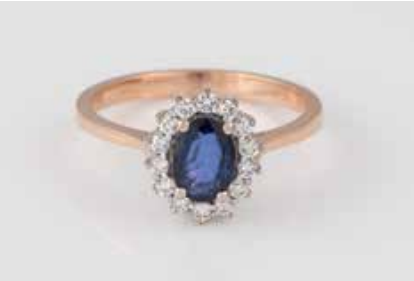
210 | EDELSTEIN-RING Rotgold, Weißgold. Ringmaß ca. 55, Ges.-Gew. ca. 3,2 g. Gest. 750. Ein oval facettierter Saphir, ca. 0,74 ct., 14 Brillanten, zus. ca. 0,26 ct., etwa Top Wesselton, VS-SI. Minimalste Tragespuren. € 560,-