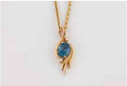
239 | EDELSTEIN-ANHÄNGER MIT KETTE Gelbgold. Anhänger L. 3 cm, Kette L. 49 cm. Ges.-Gew. zus. ca. 8,9 g. Gest. oder geprüft 14 K (585). Anhänger mit einem oval facettierten Topas (beh.), ca. 2,20 ct., zwei Brillanten, zusammen ca. 0,04 ct. Minimalste Tragespuren. € 320,-