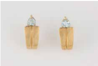
242 | PAAR OHRSTECKER Gelbgold. 1,6 cm, Ges.-Gew. zus. ca. 3,8 g. Gest. 585, Herstellerzeichen. (Sicherheitsstecker 585 und 333). Jeweils ein Topas in Herzform, zus. ca. 0,4 ct. Minimalste Tragespuren. € 130,-