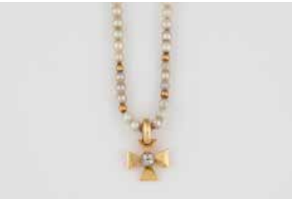
395 | PERL-COLLIER MIT KREUZANHÄNGER Gelbgold. Kette L. 38 cm. Ges.-Gew. ca. 6,3 g. Schließe gest. 585. D. der Perlen jeweils ca. 2,6 - 3,2 mm. Anhänger in Kreuzform mit vier 0,02 ct., 1,7 x 1,2 cm. Ges.-Gew. ca. 2,3 g, gest. 750. € 120,-