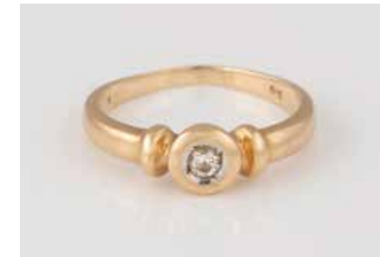
2 | BRILLANT-RING Gelbgold. Ringmaß ca. 54, Ges.-Gew. ca. 2,6 g. Gest. 585. Ein Brillant, ca. 0,06 ct. € 100,-