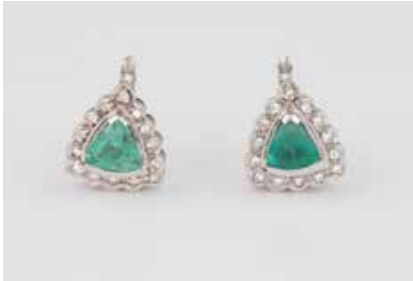
292 | PAAR EDELSTEIN-OHRSTECKER Weißgold. 1,4 x 1,2 cm, Ges.-Gew. ca. 7,0 g. Geprüft mindestens 14 K. Jeweils ein dreieckig facettierter Smaragd, jeweils ca. 6,7 x 5,7 mm, Höhe nicht messbar, zusammen 28 Brillanten, zus. ca. ,028 ct. Leichte Tragespuren. € 800,-