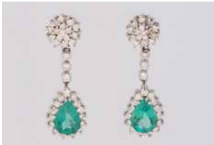
299 | PAAR EDELSTEIN-OHRHÄNGER Weißgold. L. 3,5 cm, Ges.-Gew. ca. 9,9 g. Gest. 750. Jeweils ein kolumbianischer Smaragd im Tropfenschliff, leicht geölt, zusammen ca. 3,14 ct., zusammen besetzt mit 68 Brillanten, zusammen ca. 0,67 ct. € 1.000,-