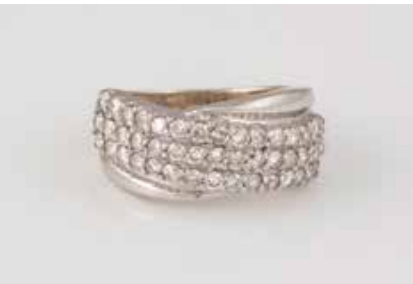
72 | BRILLANT-RING Weißgold. Ringmaß ca. 48, Ges.-Gew. ca. 5,4 g. Gest. 585, Caratangabe der Diamanten gemarkt. 45 Brillanten, zusammen ca. 1,0 ct. Schienengröße geändert, Tragespuren. € 200,-