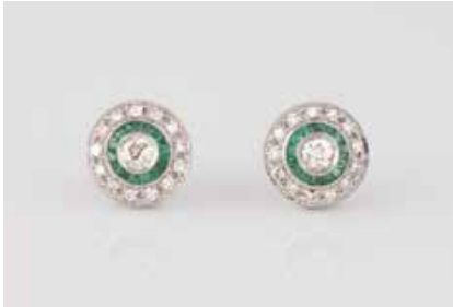
291 | PAAR EDELSTEIN-OHRSTECKER Weißgold. D. 1,1 cm, Ges.-Gew. ca. 3,5 g. Gest. 585. Zusammen 28 Smaragde, zus. ca. 0,60 ct., jeweils ein Diamant im Altschliff, zus. ca. 0,40 ct., zus. 26 Diamanten im 8/8-Schliff, zus. ca. 0,30 ct. € 900,-