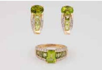
319 | RING UND OHRSTECKER Gelbgold, Weißgold. Alle Stücke gest. 585. Ges. Gew. zusammen ca. 8,5 g. 1) Ringmaß ca. 55,5 Ein Peridot ca. 1,6 ct. acht Peridots im Navet- teschliff, 20 Diamanten im 8/8-Schliff, zus. ca. 0,1 ct. 2) Paar Ohrstecker, 1,7 x 0,7 cm. Je- weils ein oval und drei rechteckig facettierte Peridots, jeweils vier Diamanten im 8/8-Schliff. € 600,-