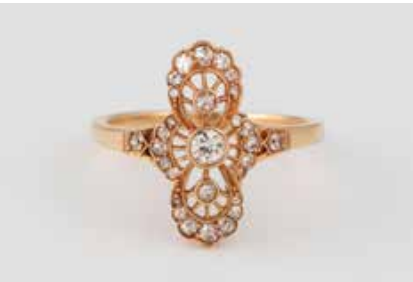
164 | DIAMANT-RING Gelbgold. Ringmaß ca. 51, Ges.-Gew. ca. 2,5 g. Geprüft 18 K, Reste einer Punzierung. Hauptstein im Altschliff, ca. 0,07 ct., 28 Diamanten im Alt- und 8/8-Schliff, zusammen ca. 0,2 ct. € 120,-