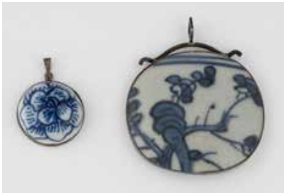
549 | ZWEI PORZELLAN-ANHÄNGER Silber. Ges.-Gew. zus. ca. 28,3 g. Gest. 925 und Silver. D. 2,6 und 5,4 cm. € 50,-