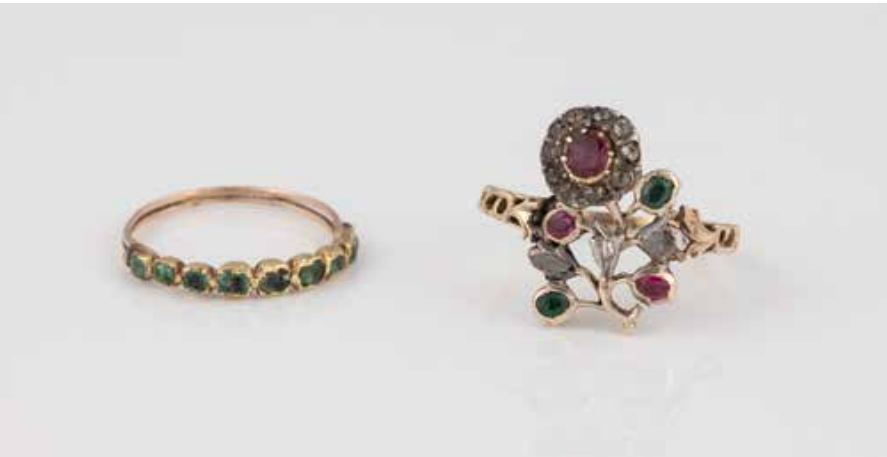
207 | ZWEI HISTORISCHE RINGE 2-tlg. Gelbgold, Rotgold, Silber. 1) Ring mit neun grünen Schmucksteinen. Ringmaß ca. 53, Ges.-Gew. ca. 1,1 g. Schiene geprüft 8 K. Tragespuren. 2) Ring mit Smaragden, Rubinen und Diamanten. Ringmaß ca. 58, Ges.-Gew. ca. 3,4 g. Geprüft 14 K. Leichte Tragespuren. € 1.500,-