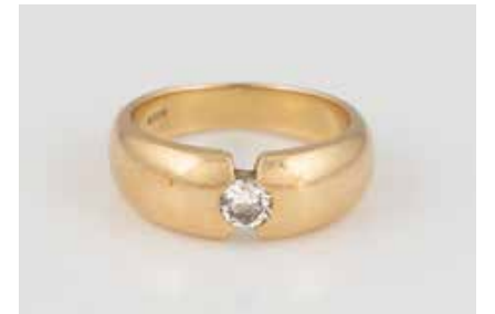
3 | BRILLANT-RING Gelbgold. Ringmaß ca. 56, Ges.-Gew. ca. 8,5 g. Gest. 585, Herstellerzeichen 'Quinn', Caratan- gabe des Diamanten gemarkt. Ein Brillant, ca. 0,34 ct. € 400,-