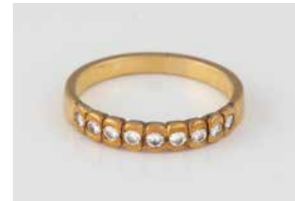
1 | BRILLANT-RING Gelbgold. Ringmaß ca. 53, Ges.-Gew. ca. 2,6 g. Gest. 750. Neun Brillanten, zusammen ca. 0,22 ct. € 120,-

Bitte beachten Sie, dass die angegebenen Zeiten der Versteigerungsfolge nicht garantiert werden können und unverbindlich bleiben.