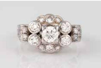
74 | BRILLANT-RING Weißgold. Ringmaß ca. 52, Ges.-Gew. ca. 6,9 g. Geprüft 18 K. 13 Diamanten im Alt- und Brillantschliff, zusammen ca. 1,50 ct., etwa Top Wesselton-Wesselton, VS-SI. € 1.800,-