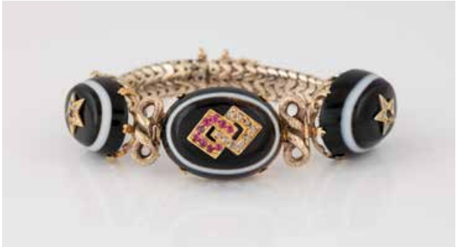
481 | ARMBAND Gelbgold, Weißgold. L. 17 cm, Ges.-Gew. ca. 34,9 g. Geprüft 14 K. Drei Achate, besetzt mit Diamantrosen und Rubin-Cabochons, Steine fehlend. € 1.800,-