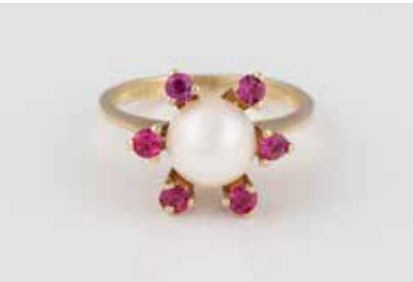
393 | PERL-RING Gelbgold. Ringmaß ca. 48, Ges.-Gew. ca. 3,2 g. Gest. 585, Herstellerzeichen. Eine Perle, D. 7,3 mm, sechs rund facettierte Rubine. Min. besch. € 100,-