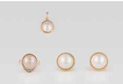
391 | KONVOLUT PERL-SCHMUCK 3-tlg. Gelbgold. Alle Stücke gest. oder geprüft 585 bzw. 14 K. Ges.-Gew. ca. 19,9 g. Alle Stücke mit Mabe-Perle. Ringmaß ca. 56, drei kleine Diamanten. Anhänger L. 2,5 cm. Paar Ohrstecker D. ca. 1,5 cm. € 440,-