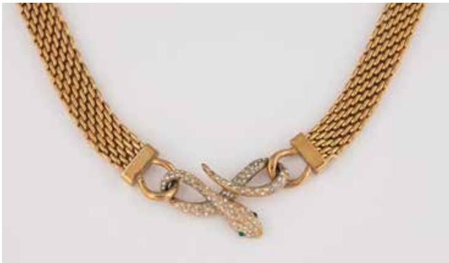
451 | ,COSTUME JEWELLERY' - SCHLANGEN-COLLIER Metall, vergoldet. L. 41 cm. Signiert. Grüne und weiße, z.T. facettierte Schmucksteine. € 300,-