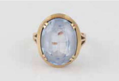
458 | RING Gelbgold. Ringmaß ca. 54, Ges.-Gew. ca. 5,4 g. Gest. 585, Herstellerzeichen. Ein oval faettierter Spinell (synth.)?, ca. 10,0 ct. € 80,-