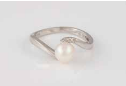
331 | RING Weißgold. Ringmaß ca. 54, Ges.-Gew. ca. 2,3 g. Gest. 585, Herstellerzeichen, Caratangabe der Diamanten gemarkt. Eine Perle, D. ca. 6,3 mm, drei Brillanten, zusammen ca. 0,02 ct. € 80,-