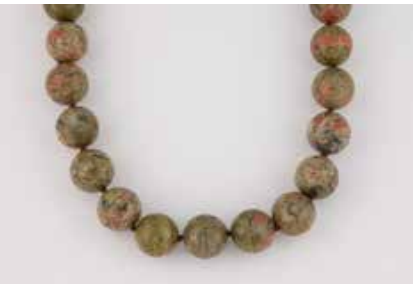
534 | COLLIER Silber, vergoldet. L. 47 cm, Ges.-Gew. ca. 225 g. Magnetschließe gest. 925, ‚Langer‘. Collier aus Unakit-Kugeln, D. ca. 18,4 mm. Einseitig von der Schließe getrennt, besch. € 80,-