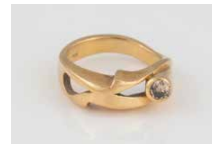
8 | DIAMANT-RING Gelbgold. Ringmaß ca. 53, Ges.-Gew. ca. 7,9 g. Gest. 750. Ein Diamant, ca. 0,15 ct. € 400,-