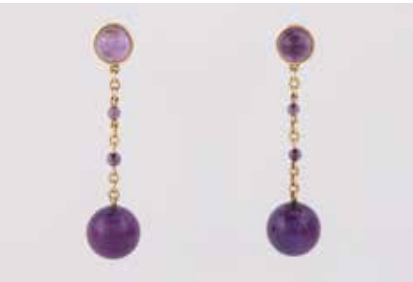
249 | PAAR AMETHYST-OHRHÄNGER Gelbgold. L. 6,4 cm, Ges.-Gew. ca. 14,4 g. Geprüft 14 K, Sicherheitsstecker vergoldet (nicht mitgemessen). Jeweils drei Amethyst-Kugeln, D. ca. 3,5 - 14,8 mm, jeweils ein Amethyst-Cabochon, ca. 9,2 x 5,7 mm. Leichte Tragespuren. € 350,-