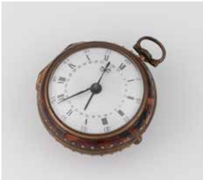
558 | HISTORISCHE SACKUHR ,A.M. CRESSENER' England, London 17./18. Jh. Metall, vergoldet. D. Gehäuse 5,1 cm. Stunden- Minutenzeiger, Datumsskala. Aufwendig verziertes Werk, gebläute Zeiger, Zifferblatt mit Tragespuren. Gehäusekorpus aus Schildpatt. Läuft bei der Prüfung an. Besch. Hilfsmittel zur Öffnung nötig. Schlüssel anbei. € 1.000,-