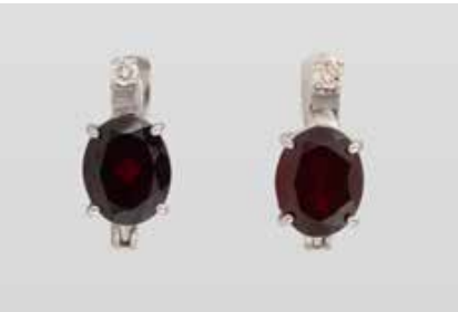
525 | PAAR OHRSTECKER Weißgold. 1,5 x 0,7 cm, Ges.-Gew. zus. ca. 4,4 g. Schaustück geprüft 14 K, Clipbügel gest. und geprüft 18 K. Jeweils ein oval facettierter Granat, zus. ca. 5,8 ct., jeweils ein Brillant, zus. ca. 0,08 ct. Min. besch. € 170,-