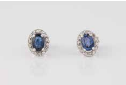
198 | PAAR EDELSTEIN-OHRSTECKER Weißgold. 0,9 x 0,6 cm, Ges.-Gew. ca. 2,1 g. Gest. 585. Jeweils ein oval facettierter Saphir, zus. ca. 1,05 ct., zus. 27 Brillanten, zus. ca. 0,11 ct. Ein kleiner Brillant fehlend (unauffällig). € 360,-