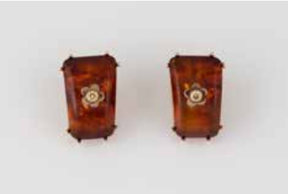
476 | PAAR OHRCLIPS ‚KATZLER‘ Gelbgold. 2,3 x 1,5 cm, Ges.-Gew. ca. 12,7 g. Gest. 585, Herstellerzeichen ‚Katzler - Düsseldorf‘. Wohl Bernstein (?) mit jeweils einem fancyfarbenen Brillanten, zu. ca. 0,1 ct. € 200,-