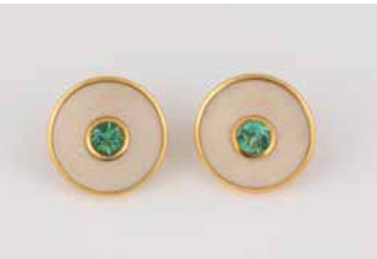
300 | PAAR OHRCLIPS Gelbgold. D. ca. 2,1 cm, Ges.-Gew. ca. 14,4 g. Gest. 750, Herstellerzeichen ‚STOFFEL‘. Jeweils ein rund facettierter Turmalin, D. ca. 5,6 mm, Höhe nicht messbar. Alabaster-Ring. € 500,-