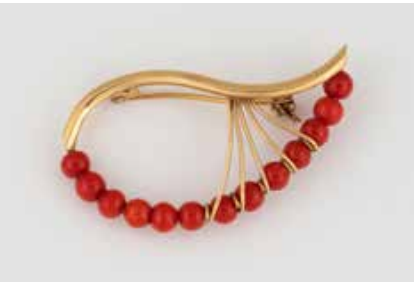
429 | KORALL-BROSCHÉ * Gelbgold. 4,4 x 2,4 cm, Ges.-Gew. ca. 4,7 g. Gest. 750. 13 Korall-Perlen, D. ca. 4,3 mm. € 280,-