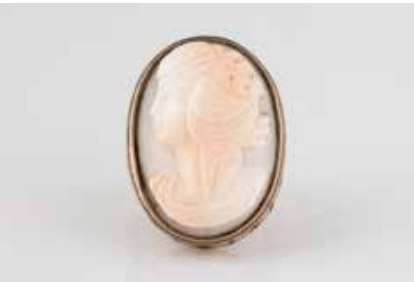
434 | KORALL-RING * Rotgold, Silber, vergoldet. Ringmaß ca. 53,5, Ges.-Gew. ca. 8,9 g. Schiene gest. 583, Ringkopf Silber, vergoldet. Kamee mit Frauenportrait. Schiene leicht besch. € 300,-