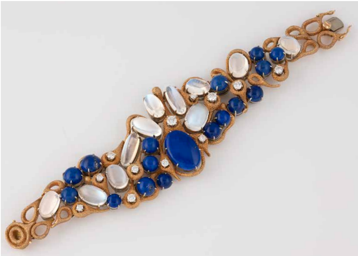
423 | DESIGN-ARMBAND Gelbgold. L. 17 cm, Ges.-Gew. ca. 97,9 g. Gest. 750, Herstellerzeichen. 11 Mondsteine im Cabochonschliff, 17 Lapislazuli-Cabochons, 12 Brillanten, zusammen ca. 1,50 ct. € 5.600,-