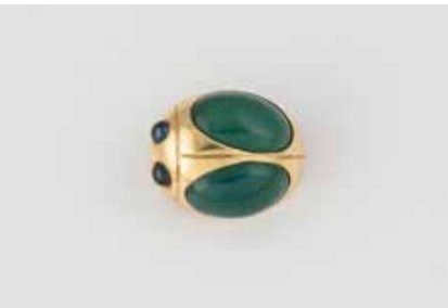
301 | BROSCHKE ‚KÄFER‘ Gelbgold. 2,3 x 1,8 cm, Ges.-Gew. ca. 8,3 g. Gest. 750, italienische Punzierung. Brosche in Form eines Käfers, zwei runde Saphir-Cabochons als Augen, wohl synth., stilisierte Flügel aus grünem Chalcedon. € 350,-