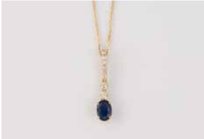
181 | EDELSTEIN-ANHÄNGER MIT KETTE Gelbgold. Anhänger L. 2,5 cm, Kette L. 45 cm. Ges.-Gew. zus. ca. 2,4 g. Gest. 585 und 14 K. Ein oval facettierter Saphir, ca. 0,94 ct., acht Brillanten, zus. ca. 0,16 ct. € 400,-