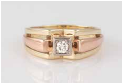
113 | BRILLANT-RING Gelbgold, Rotgold. Ringmaß ca. 52, Ges.-Gew. ca. 5,6 g. Gest. 585, Caratangabe des Diaman- ten gemarkt. Ein Brillant, ca. 0,10 ct., etwa Wesselton, VS-SI. Durch Goldschmied 2022 aufgearbeitet. € 260,-