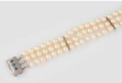
396 | PERL-ARMBAND Weißgold. L. 19 cm, Ges.-Gew. ca. 33,5 g. Gest. 585. Dreireihiges Armband, D. der Perlen jeweils ca. 6,5 mm. Schließe besetzt mit drei rund facettierte Saphiren. Leichte Tragespuren. € 150,-