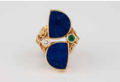
417 | RING ‚KATZLER‘ Gelbgold. Ringmaß ca. 54, Ges.-Gew. ca. 19,8 g. Gest. 750, Herstellerzeichen ‚Katzler - Düsseldorf‘. Zwei Lapislazuli-Plättchen, ein rund facettierter Smaragd, D. ca. 3,1 mm, ein Brillant, ca. 0,16 ct. Minimale Tragespuren. € 1.000,-