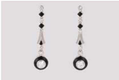
144 | PAAR DIAMANT-OHRHÄNGER Weißgold. L. 3,9 cm, Ges.-Gew. ca. 5,0 g. Gest. 585. Jeweils ein Brillant sowie fünf Diamanten im 8/8-Schliff, zus. ca. 0,7 ct., etwa Wesselton, SI. Schwarzes Emaille. € 950,-