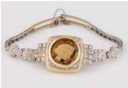
435 | ARMBAND Gelbgold, Weißgold. L. 18 cm, Ges.-Gew. ca. 23,7 g. Geprüft 14 K. Ein rund facettierter Citrin, ca. 10,6 ct., 68 Diamanten im 8/8-Schliff, zus. ca. 1,8 ct. € 650,-