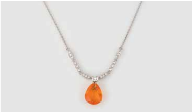
446 | COLLIER Weißgold. L. 42 cm, Ges.-Gew. ca. 8,2 g. Gest. 18 K. Ein tropfenförmig facettierter Feueropal (?), ca. 15,0 x 11,8 x 7,3 mm, ein Brillant, ca. 0,24 ct., 36 Diamanten im 8/8-Schliff, zusammen ca. 0,4 ct. € 1.600,-