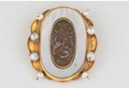
508 | RELIEF-BROSCH Gelbgold, wohl Silber. 4,4 x 4,8 cm, Ges.-Gew. ca. 33,9 g. Gold geprüft 18 K. Hochovale Form, acht Perlen, Relief, wohl Silber, Perlmutteinlage. € 400,-