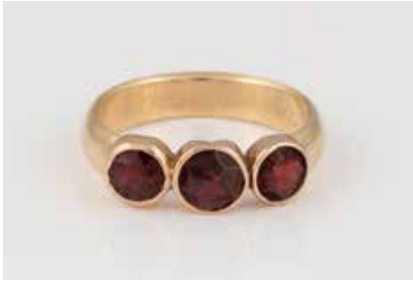
277 | RING Gelbgold, Rotgold. Ringmaß ca. 56,5, Ges.- Gew. ca. 4,8 g. Gest. 585, Reste einer persön- lichen Gravur. Drei rote, rund facettierte Schmucksteine. Schiene und Kopf Marriage. Tragespuren. € 140,-