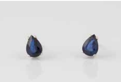
197 | PAAR SAPHIR-ORSTECKER Weißgold. 0,7 x 0,5 cm, Ges.-Gew. ca. 1,7 g. Gest. 750. Jeweils ein Saphir im Tropfenschliff, zus. ca. 1,66 ct. € 340,-