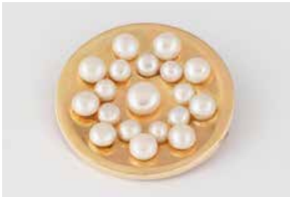
336 | PERL-BROSCHÉ Gelbgold. D. 4,3 cm, Ges.-Gew. ca. 17,6 g. Gest. 585. 19 Bouton-Perlen unterschiedlicher Größen. Rückseitig Montierungsmasse. € 600,-