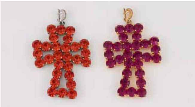
456 | ,COSTUME JEWELLERY' - ZWEI KREUZE Metall, ein Kreuz vergoldet. 7,9 x 4,8 cm. Orangefarbene, pinkfarbene und weiße facettierte Schmucksteine. € 180,-