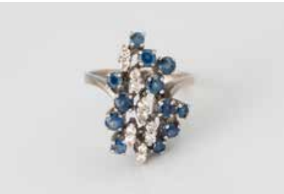
194 | EDELSTEIN-RING Weißgold. Ringmaß ca. 53, Ges.-Gew. ca. 6,1 g. Gest. 585, Caratangabe der Diamanten gemarkt. 12 Diamanten im 8/8-Schliff, zus. ca. 0,30 ct., 12 rund facettierte Sapphire. € 250,-