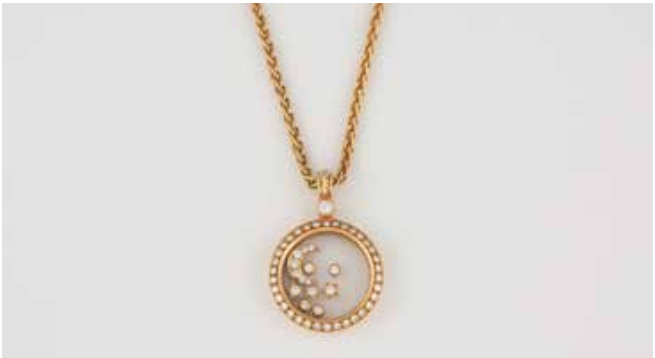
52 | DIAMANT-ANHÄNGER MIT KETTE Gelbgold. Anhänger 3,9 x 2,7 cm, Kette L. 39,5 cm. Beide Stücke gest. 750. Ges.-Gew. zus. ca. 32,8 g. Runder Anhänger mit frei beweglichen Diamanten zwischen Glas, in mond- und sternenförmigen Fassungen. Ein Brillant, ca. 0,18 ct., 48 Brillanten, zusammen ca. 0,99 ct. Kette nahe der Schließe leicht verdreht. € 1.500,-