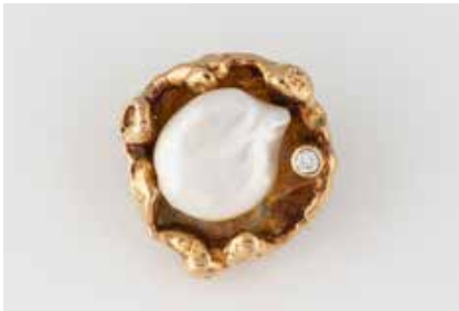
366 | PIN MIT PERLE UND DIAMANT Gelbgold, Metall. D. 2,0 cm, Ges.-Gew. ca. 7,3 g. Gold geprüft 14 K. Eine Perle, ein Brillant, ca. 0,04 ct. € 80,-