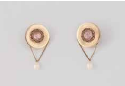
373 | PAAR OHRSTECKER Gelbgold. L. 4,1 cm, Ges.-Gew. ca. 7,2 g. Geprüft 14 K, Sicherheitsstecker Doublé. Jeweils ein rund facettierter Kunzit (?), ca. 7,8 x 5,6 mm, jeweils eine hängende Perle. Montierungsreste. € 350,-