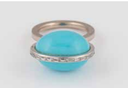
519 | TÜRKIS-RING MIT DIAMANTBESATZ Weißgold. Ringmaß ca. 50, Ges.-Gew. ca. 8,9 g. Gest. 750. Eine ovale Türkis-Kugel, ca. 17,1 x 12,7 x 13,0 mm, 19 Diamanten im Baguette-schliff, zusammen ca. 0,22 ct. € 400,-