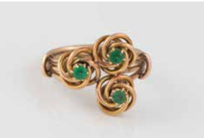
290 | RING Gelbgold. Ringmaß ca. 54, Ges.-Gew. ca. 4,7 g. Geprüft 14 K. Drei rund facettierte, grüne Schmucksteine. Besch. € 160,-