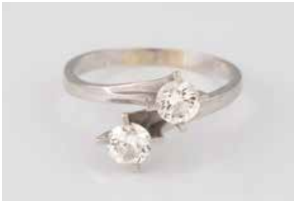
36 | BRILLANT-RING Weißgold. Ringmaß ca. 58, Ges.-Gew. ca. 2,9 g. Geprüft 14 K. Zwei Brillanten, zus. ca. 0,8 ct. Schienengröße geändert. Besch. € 250,-