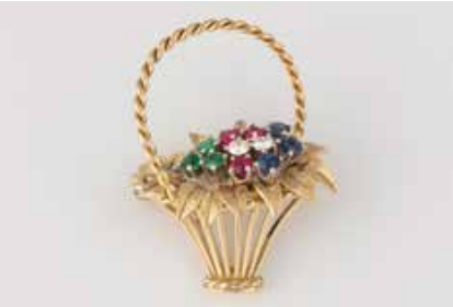
470 | EDELSTEIN-BROSCH Gelbgold, Weißgold. 2,7 x 3,5 cm, Ges.-Gew. ca. 10,3 g. Gest. 750, Herstellerzeichen. Neun rund facettierte Rubine, Saphire und Smaragde, zwei Brillanten, zus. ca. 0,20 ct., etwa Top Wesselton-Wesselton, VS-SI. Durch Goldschmied 2022 aufgearbeitet. € 590,-