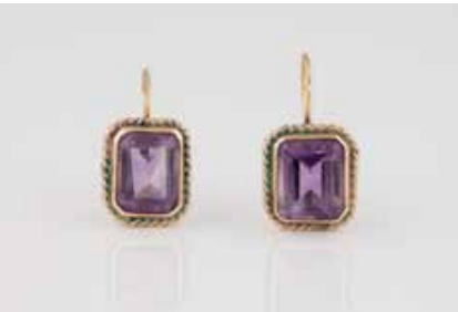
251 | PAAR OHRHÄNGER MIT AMETHYST Gelbgold. L. Schaustück 1,3 x 1,0 cm, Ges.-Gew. ca. 4,7 g. Gest. 10 K. Jeweils ein Amethyst, zusammen ca. 6,8 ct. Leichte Tragespuren. € 80,-