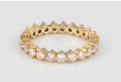
104 | ETERNITY-RING Gelbgold. Ringmaß ca. 62, Ges.-Gew. ca. 4,5 g. Gest. 750. 23 Brillanten, zusammen ca. 1,6 ct. Minimale Tragespuren. € 450,-