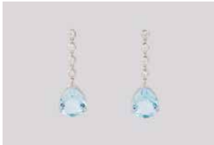
230 | PAAR TOPAS-OHRHÄNGER Weißgold. L. 3,5 cm, Ges.-Gew. ca. 6,8 g. Gest. 585. Jeweils ein tropfenförmig facettierter Topas, zusammen ca. 6,50 ct., zus. acht Brillanten, zus. ca. 0,52 ct., etwa Top Wesselton, VS-SI. € 1.000,-