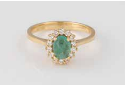
288 | SMARAD-RING MIT DIAMANTBESATZ Gelbgold. Ringmaß ca. 55, Ges.-Gew. ca. 3,5 g. Gest. 750. Ein ovaler Smaragd im Cabochonschliff, ca. 1,07 ct., 14 Brillanten, zus. ca. 0,26 ct., etwa Top Wesselton, VS-SI. € 650,-