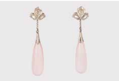
521 | PAAR OHRHÄNGER Gelbgold, wohl Silber. L. 5,9 cm, Ges.-Gew. ca. 12,0 g. Brisur geprüft 18 K. Jeweils eine Pink-Quarz-Pampel, ca. 2,8 x 0,9 cm, jeweils drei Diamantrosen. Besch. € 500,-