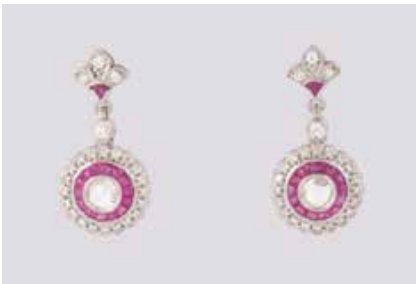
259 | PAAR EDELSTEIN-OHRHÄNGER Weißgold. L. 2,0 cm, Ges.-Gew. ca. 3,8 g. Gest. 585. Zus. 28 Rubine, zus. ca. 1,10 ct., zus. 50 Brillanten, zus. ca. 0,3 ct., jeweils eine Diamantrose, zus. ca. 0,24 ct. € 900,-