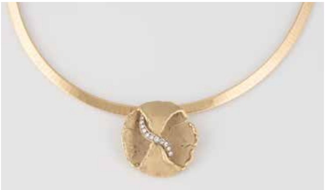
48 | DIAMANT-ANHÄNGER MIT KETTE Gelbgold. Anhänger D. 2,9 cm, Kette L. ca. 44,5 cm. Ges.-Gew. zus. ca. 36,1 g. Gest. oder geprüft 585 bzw. 14 K. 11 Brillanten, zusammen ca. 0,24 ct. € 1.200,-