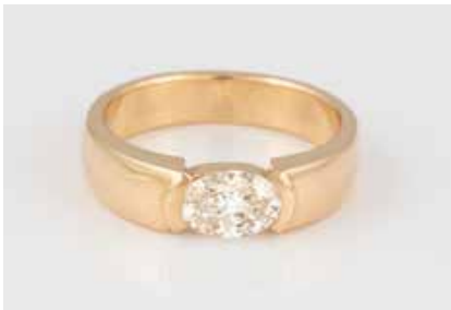
107 | DIAMANT-RING Gelbgold. Ringma0 ca, 55, Ges.-Gew. ca. 7,6 g. Gest. 750, Herstellerzeichen, Caratangabe ge- ritz. Ein oval facettierter Diamant, ca. 1,12 ct. Getönt, SI, Rundiste min. besch. € 2.500,-