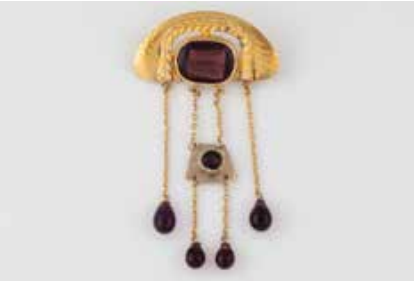
457 | BROSCHE Metall, vergoldet. 6,8 x 3,5 cm, Ges.-Gew. ca. 8,7 g. Amethystfarbene Schmucksteine. € 400,-