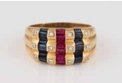
465 | EDELSTEIN-RING Gelbgold. Ringmaß ca. 62, Ges.-Gew. ca. 6,0 g. Gest. 750. 12 kleine Diamanten, zusammen ca. 0,06 ct., 27 Saphire und Rubine im Baguetteschliff. Tragespuren. € 260,-