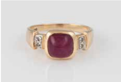
273 | EDELSTEIN-RING Gelbgold. Ringmaß ca. 59, Ges.-Gew. ca. 5,1 g. Gest. 585. Ein Rubin-Cabochon, ca. 3,0 ct., vier Diamanten im 8/8-Schliff, zus. ca. 0,04 ct. Besch. € 200,-