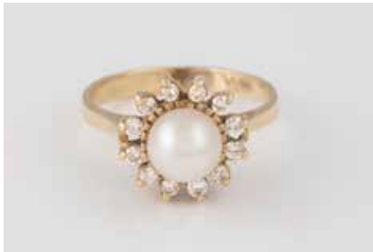
341 | PERL-RING MIT DIAMANTEN Gelbgold. Ringmaß ca. 50, Ges.-Gew. ca. 3,5 g. Gest. 585. Eine Perle, D. ca. 6,6 mm, 12 Brillanten, zus. ca. 0,12 ct. Schienengröße geändert. € 120,-