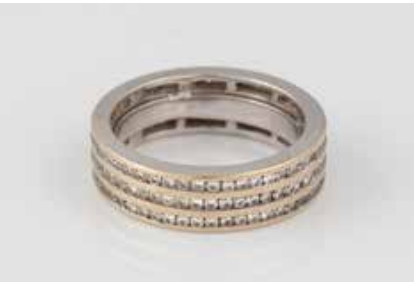
154 | DIAMANT-RING Weißgold. Ringmaß ca. 51,5, Ges.-Gew. ca. 6,9 g. Geprüft 18 K. Ca. 150 Brillanten, zusammen ca. 0,75 ct. € 220,-