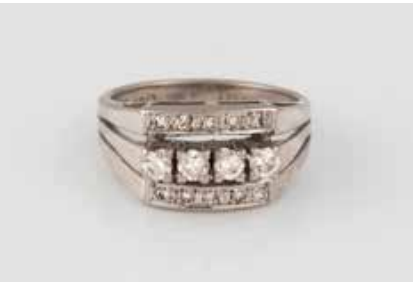
75 | DIAMANT-RING Weißgold. Ringmaß ca. 55, Ges.-Gew. ca. 5,7 g. Gest. 585, weitere Punzierungen. 10 Diamanten im 8/8-Schliff, zus. ca. 0,09 ct. vier Brillanten, zusammen ca. 0,32 ct. € 180,-