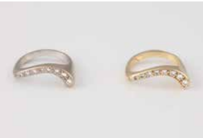
79 | ZWEI DIAMANT-RINGE Gelbgold, Weißgold (Gelbgold durchscheinend). Ringmaß ca. 52,5, Ges.-Gew. ca. 11,3 g. Beide gest. 585, Herstellerzeichen, Carat- und Reinheitsangabe der Diamanten gemarkt. Jeweils neun Brillanten, jeweils ca. 0,225 ct., SI. € 420,-