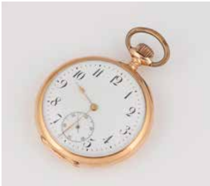
561 | TASCHENUHR ,NOMOS' Deutsch, 20. Jh. Gelbgold. D. ca. 5,0 cm, Ges.-Gew. ca. 77,4 g. Zwei-Deckel gest. 585. Werkplatine bez. ,Nomos', Staubdeckel bez. ,Neues System Glashütte - Nomos Glashütte I/S'. Leichte Tragespuren. Bei der Prüfung funktionstüchtig. € 900,-