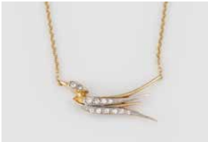
515 | COLLIER Gelbgold, Weißgold. L. 42 cm, Ges.-Gew. ca. 5,1 g. Gest. 585, Karabiner später ergänzt 333. 12 facettierte Steine im 8/8-Schliff, Diamanten und Similisteine. € 200,-