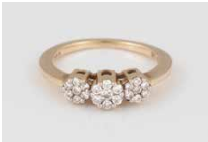
114 | DIAMANT-RING Gelbgold. Ringmaß ca. 49, Ges.-Gew. ca. 2,4 g. Gest. 585. 21 Brillanten, zusammen ca. 0,2 ct. € 100,-