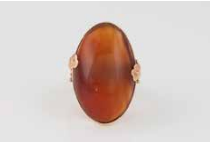
475 | RING Gelbgold, Rotgold. Ringmaß ca. 55, Ges.-Gew. ca. 15,2 g. Gest. 585, Herstellerzeichen ‚Katzler - Düsseldorf‘. Ein ovaler Karneol-Cabochon, ca. 30 ct. Besch. € 300,-