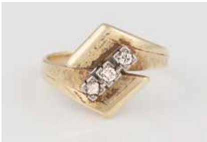
108 | BRILLANT-RING Gelbgold, Weißgold. Ringmaß ca. 60,5, Ges.- Gew. ca. 5,1 g. Gest. 585, Herstellerzeichen. Drei Brillanten, zusammen ca. 0,12 ct. Schie- nengröße geändert. € 180,-