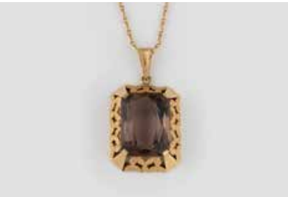
504 | RAUCHQUARZ-ANHÄNGER MIT KETTE Gelbgold. Beide Stücke gest. 585. 1) Anhänger 4,0 x 2,2 cm, Ges.-Gew. ca. 8,5 g. Ein rechteckig facettierter Rauchquarz, ca. 18 ct., minimale Tragespuren. 2) Kette L. 60 cm, Ges.-Gew. ca. 4,6 g. € 450,-