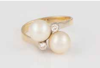
392 | PERL-RING MIT BRILLANTBESATZ Gelbgold. Ringmaß ca. 55, Ges.-Gew. ca. 5,4 g. Gest. 585. Zwei Perlen, D. jeweils ca. 8,5 mm, zwei Brillanten, zus. ca. 0,14 ct. Min. besch. € 200,-