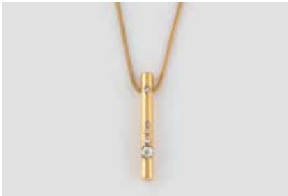
145 | COLLIER MIT DIAMANTBESATZ Gelbgold. L. 40,5 cm, Hängелеment L. 4,0 cm. Ges.-Gew. zus. ca. 19,7 g. Beide Stücke gest. 750, Kette Herstellersignet UnoAERre, Hängелеment mit Herstellersignet (ungedeutet). Hängелеment mit vier Diamanten im Alt- und 8/8-Schliff, zus. ca. 0,09 ct. ein Diamant im Altschliff, ca. 0,25 ct. Min. besch. € 950,-