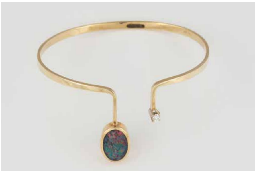
399 | ARMREIF Gelbgold. Innemaß ca. 6,3 x 5,5 cm, Ges.-Gew. ca. 15,5 g. Gest. 585, Herstellerzeichen. Eine ovale Opaltriplette, ca. 13,1 x 9,0 x 3,8 mm, ein Brillant, ca. 0,1 ct. € 580,-