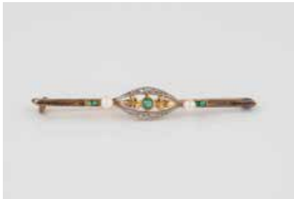
388 | BROSCHE Gelbgold, Weißgold. 4,9 cm, Ges.-Gew. ca. 2,8 g. Geprüft 14 K. Zwei kleine Perlen, kleine Smaragde und Diamantrosen. Besch. € 90,-