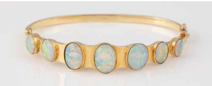
407 | OPAL-ARMREIF Gelbgold. Innenmaß ca. 5,5 x 4,2 cm, Ges.-Gew. ca. 15,4 g. Gest. 585. Sieben Opale (Doubletten?) im Verlauf, ca. 5,8 x 4,9 x 2,1 mm bis 10,6 x 7,0 x 2,1 mm. Sicherheitsacht nicht fassend. € 590,-