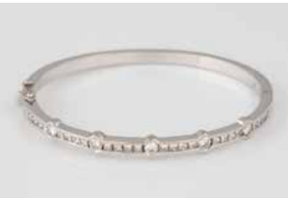
131 | DIAMANT-ARMREIF Weißgold. Innenmaß ca. 5,9 x 5,2 cm, Ges.-Gew. ca. 18,8 g. Gest. 750. fünf Brillanten, zus. ca. 0,75 ct., 24 Diamanten im Princess-Schliff, zus. ca. 1,44 ct. Min. Tragespuren. € 1.100,-