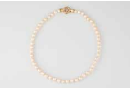
536 | PERL-COLLIER Gelbgold. L. 48 cm, Ges.-Gew. ca. 40,7 g. Gest. 585. D. der Perlen ca. 7,7 mm. Drei Perlen zusätzlich anbei. € 250,-