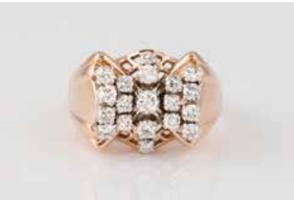
163 | BRILLANT-RING Roségold, Weißgold. Ringmaß ca. 55, Ges.-Gew. ca. 8,2 g. 18 K, gest. „Adlerkopf“. 19 Diamanten im Alt- und 8/8-Schliff, zusammen ca. 0,86 ct. Schiene minimalst besch. € 950,-