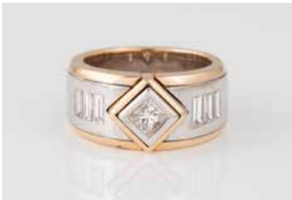
29 | DIAMANT-RING Weißgold, Gelbgold. Ringmaß ca. 54, Ges.-Gew. ca. 20,7 g. Gest. 750. Ein Diamant im Princess-Schliff, ca. 0,40 ct., etwa Top Wesselton, VS, sechs Diamanten im Baguetteschliff, zus. ca. 1,10 ct., etwa Top Wesselton VS-SI. € 2.000,-