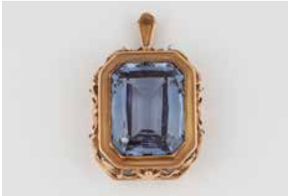
220 | ANHÄNGER Gelbgold, Rotgold. 5,2 x 3,3 cm, Ges.-Gew. ca. 33,5 g. Gest. 585. Ein rechteckig facettierter Spinell (synth.) ?, ca. 74,0 ct. Min. besch. € 650,-