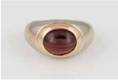
276 | RING Weißgold, Gelbgold. Ringmaß ca. 55, Ges.- Gew. ca. 11,1 g. Gest. 750. Ein roter Schmuck- stein-Cabochon, Granat (?) (leicht locker in der Fassung). Min. Tragespuren. € 500,-