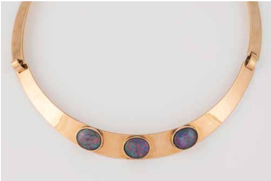
398 | OPAL-COLLIER Rotgold, Gelbgold. Ges.-Gew. ca. 50,7 g. Gest. 585. Gliedercollier mit drei ovalen Opalen (Doubletten oder Tripletten?), jeweils ca. 11,7 x 9,6 mm, verso geschlossen gearbeitet. Karabiner später ergänzt. € 2.000,-