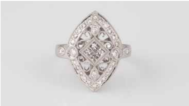
171 | DIAMANT-RING Weißgold. Ringmaß ca. 51, Ges.-Gew. ca. 6,7 g. Gest. 18 K. 32 Diamanten im Princess- und Brillantschliff, zusammen ca. 0,82 ct. € 1.000,-