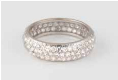
33 | DIAMANT-RING Weißgold. Ringmaß ca. 53, Ges.-Gew. ca. 3,3 g. Geprüft 18 K. Ca. 119 Diamanten im 8/8-Schliff, zusammen ca. 1,19 ct. € 750,-