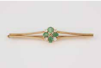
305 | BROSCHKE Gelbgold. L. 7,7 cm, Ges.-Gew. ca. 14,0 g. Gest. 585. Vier Smaragde im Tropfenschliff, zus. ca. 1,2 ct., drei Brillanten, zus. ca. 0,3 ct., ein weißer, rund facettierter Stein. Besch. € 450,-