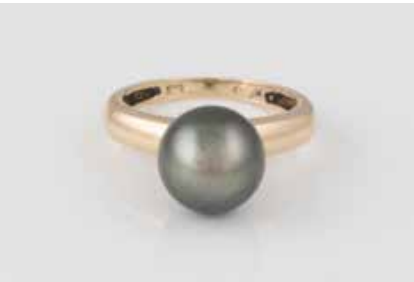
349 | PERL-RING Gelbgold. Ringmaß ca. 49, Ges.-Gew. ca. 3,6 g. Gest. 585. Eine Perle, D. ca. 9,5 mm. € 100,-