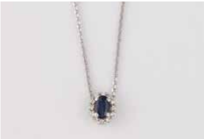
203 | EDELSTEIN-ANHÄNGER MIT KETTE Weißgold. Anhänger 0,7 x 0,5 cm. Gest. 585 und 14 K. L. Kette 45 cm. Ges.-Gew. zus. ca. 2,0 g. Ein oval facettierter Saphir, ca. 0,3 ct., 12 Brillanten, zus. ca. 0,05 ct. € 210,-