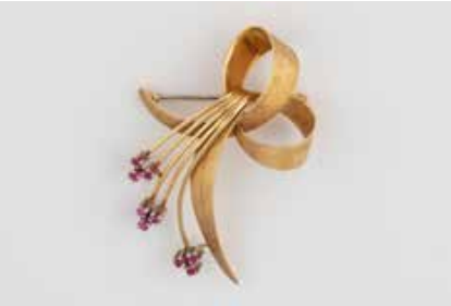
264 | RUBIN-BROSCH Gelbgold. 6,0 x 5,0 cm, Ges.-Gew. ca. 14,7 g. Gest. 750, Nadel wohl sekundär, ungeprüft. Neun rund facettierte Rubine, D jeweils ca. 1,88 mm. Leichte Tragespuren. € 360,-