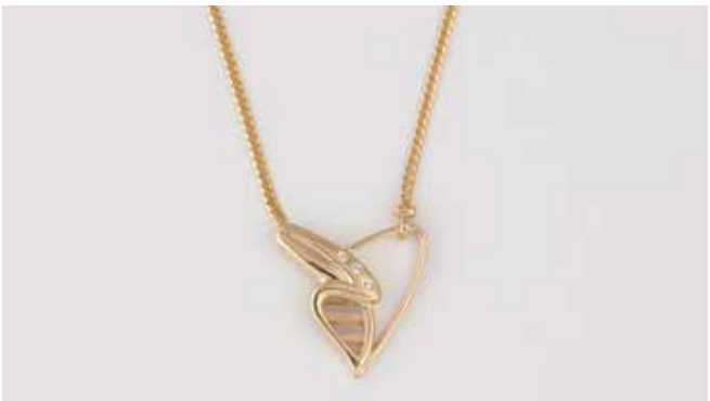
50 | DESIGN-COLLIER Gelbgold, Weißgold, Rotgold. L. 42 cm, Ges.-Gew. ca. 7,1 g. Gest. 585. Drei Brillanten, zusammen ca. 0,025 ct., etwa Top Wesselton Wesselton, VS-SI. Einlieferung aus Juwelierschließung. € 330,-