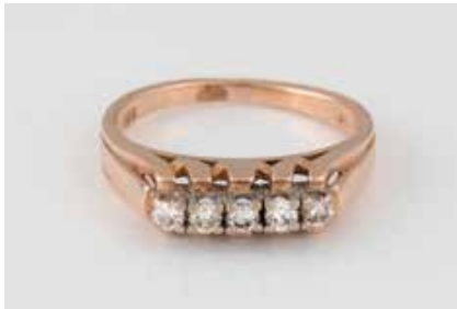
112 | BRILLANT-RING Rotgold. Ringmaß ca. 54,5, Ges.-Gew. ca. 3,5 g. Gest. 585, Herstellersignet. Fünf Brillanten, zusammen ca. 0,2 ct. Schienengröße geändert. € 190,-