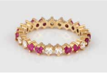
268 | EDELSTEIN-RING Gelbgold. Ringmaß ca. 62, Ges.-Gew. ca. 4,6 g. Gest. 750. 12 rund facettierte Rubine, zus. ca. 1,2 ct., 11 Brillanten, zus. ca. 0,77 ct. Besch. € 380,-