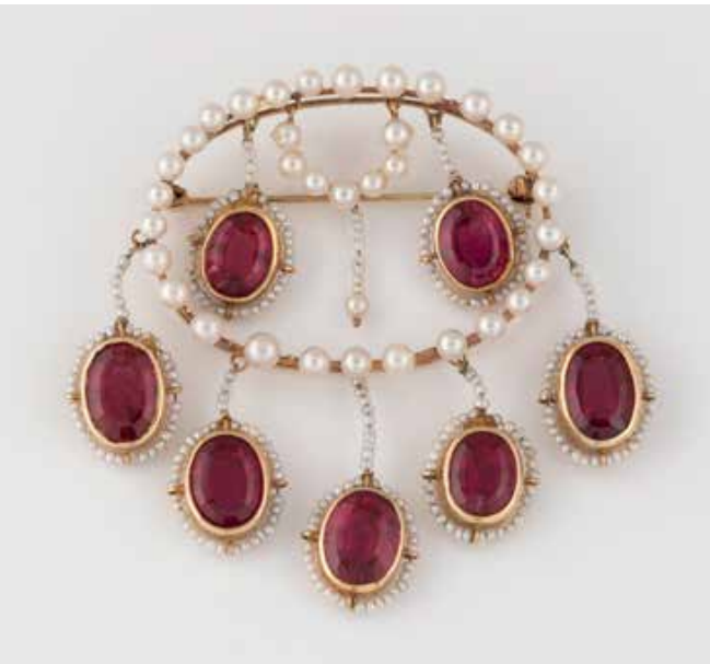
321 | BROSCHE Gelbgold. 5,0 x 6,0 cm, Ges.-Gew. ca. 20,5 g. Gest. 585. Sieben oval facet- tierte Turmaline, zusammen ca. 15,0 ct. Perlen unterschiedlicher Größen. Leicht besch. € 1.200,-