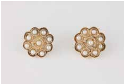
360 | PAAR PERL-OHRSTECKER Gelbgold. D. 2,6 cm, Ges.-Gew. ca. 14,0 g. Gest. 585 (Sicherheitsstecker 585 und 925er Silber). Blütenförmige Grundform, fein gelegte Saatperl-Stränge. Perlen unterschiedlicher Größen. Montierungsreste. € 550,-