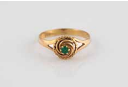
307 | RING Gelbgold. Ringmaß ca. 57, Ges.-Gew. ca. 2,4 g. Gest. 585. Ein rund facettierter Smaragd. Minimalste Tragespuren. € 80,-