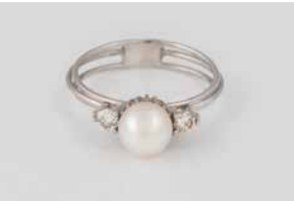
328 | PERL-RING MIT DIAMANTEN Weißgold. Ringmaß ca. 60, Ges.-Gew. ca. 4,1 g. Gest. 750. Eine Perle, D. ca. 7,5 mm, zwei Brillanten, zusammen ca. 0,24 ct. € 160,-