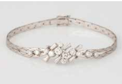
130 | DIAMANT-ARMBAND Weißgold. L. 18 cm, Ges.-Gew. ca. 14,3 g. Gest. 750, Herstellerzeichen ‚CB‘, wohl Carl Bucherer. 18 Diamanten im Trapez- und Brillantschliff, zusammen ca. 1,52 ct. etwa Wesselton, SI. € 1.600,-