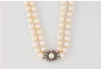
352 | PERL-COLLIER MIT DIAMANT-SCHLIESSE Weißgold. L. 48,5 cm, Ges.-Gew. ca. 79,9 g. Gest. 585. Zweireihiges Collier, D. der Perlen ca. 7,70 mm, 14 Diamanten im Brillant- und 8/8-Schliff, zusammen ca. 0,5 ct. Mit Zertifikat, Mikimoto-Zuchtperlen. € 300,-