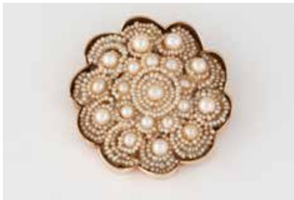
361 | PERL-BROSCH Gelbgold. D. 4,0 cm, Ges.-Gew. ca. 18,7 g. Gest. 585. Blütenförmige Grundform, Fein gelegte Saatperl-Stränge. Perlen unterschiedlicher Größen. Besch. € 700,-

Weißgold. L. 42,5 cm, Ges.-Gew. ca. 19,7 g. Gest. 585. Fünf Perlen, D. ca. 6,0 bis 7,3 mm. Vier Brillanten, zusammen ca. 0,3 ct. € 650,-