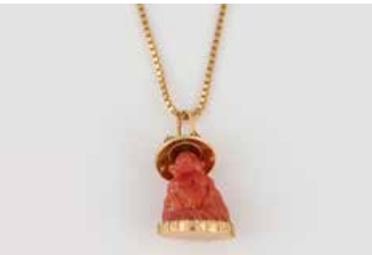
426 | KORALL-ANHÄNGER MIT KETTE * Gelbgold. Anhänger 2,8 x 1,5 cm, Ges.-Gew. ca. 7,8 g. Gest. 18 K. Geschnittene Figur eines sitzenden Buddhas. Kette L. 54 cm, Gew. ca. 7,9 g. Gest. 585 € 440,-