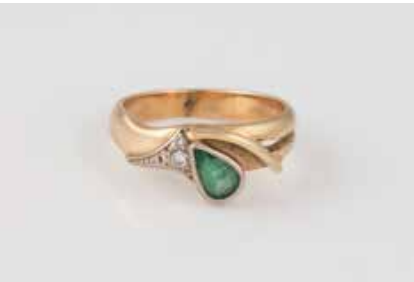
303 | RING Gelbgold, Weißgold. Ringmaß ca. 60, Ges.-Gew. ca. 6,4 g. Gest. 585, Herstellerzeichen. Ein Smaragd im Tropfenschliff, ca. 0,3 ct., drei Brillanten, zusammen ca. 0,05 ct. Schienengröße geändert. Tragespuren. € 220,-