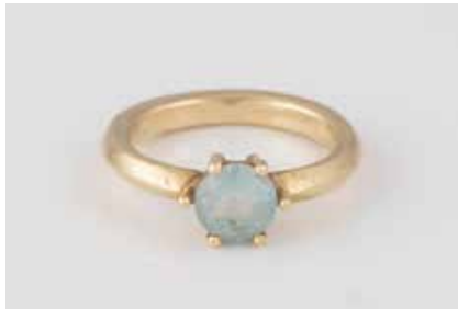
245 | RING Gelbgold. Ringmaß ca. 48, Ges.-Gew. ca. 4,0 g. Geprüft 14 K. Ein rund facettierter Topas, ca. 1,0 ct. € 120,-