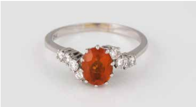
450 | RING Weißgold. Ringmaß ca. 57,5, Ges.-Gew. ca. 3,5 g. Gest. 750. Ein oval facettierter Citrin, ca. 1,1 ct., acht Brillanten, zusammen ca. 0,3 ct. € 180,-