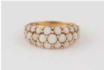
514 | OPAL-RING Gelbgold. Ringmaß ca. 50, Ges.-Gew. ca. 2,2 g. Gest. 585, Herstellerzeichen. Kopf besetzt mit runden Opalcabochons im Verlauf. € 80,-