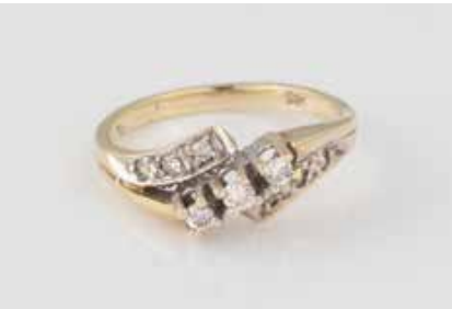
179 | DIAMANT-RING Gelbgold, Weißgold. Ringmaß ca. 45, Ges.-Gew. ca. 1,8 g. Gest. 585. Neun Diamanten im 8/8- und Brillantschliff, zusammen ca. 0,12 ct. € 50,-