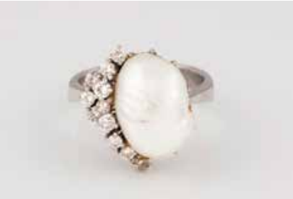
325 | PERL-RING MIT DIAMANTBESATZ Weißgold. Ringmaß ca. 58, Ges.-Gew. ca. 8,3 g. Gest. 585. Eine Barockperle, L. ca. 15,4 mm, 11 Brillanten, zus. ca. 0,33 ct. Part. leicht besch. € 280,-