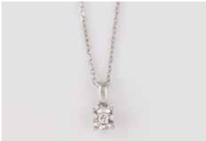
143 | BRILLANT-ANHÄNGER MIT KETTE Weißgold. Anhänger L. 0,8, Kette L. 43 cm. Ges.-Gew. ca. 1,9 g. Gest. 750. Ein Brillant, ca. 0,03 ct. € 240,-