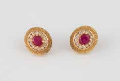
270 | PAAR OHRSTECKER Gelbgold. 1,2 x 1,1 cm, Ges.-Gew. ca. 3,3 g. Geprüft 14 K. Jeweils ein oval facettierter Ru- bin, zus. ca. 0,6 ct., jeweils 14 rund facettierte Similisteine. € 100,-