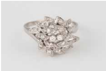
34 | DIAMANT-RING Weißgold. Ringmaß ca. 54, Ges.-Gew. ca. 4,1 g. Gest. 585. 18 Diamanten im Brillant- und 8/8-Schliff, zus. ca. 0,2 ct. Schienengröße geändert. € 350,-