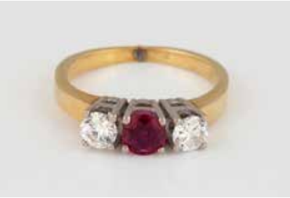
271 | EDELSTEIN-RING Gelbgold, Weißgold. Ringmaß ca. 51, Ges.- Gew. ca. 4,4 g. Gest. 750. Ein rund facettierter, flacher Rubin ca. 0,2 ct., zwei Brillanten, zu- sammen ca. 0,5 ct. Schienengröße geändert. € 300,-