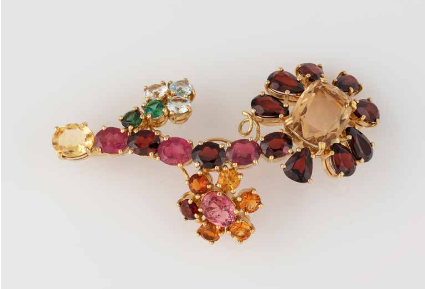
466 | MULTICOLOR-BROSCHE Gelbgold. 7,5 x 4,4 cm, Ges.-Gew. ca. 31,6 g. Gest. 750. Multicolor-Farbsteinbesatz, u.a. Turmalin, Citrin, Aquamarin. unterschiedliche Facettierungen. Minimale Tragespuren. € 3.000,-