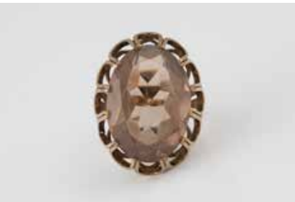
501 | RING Gelbgold. Ringmaß ca. 55, Ges.-Gew. ca. 10,0 g. Gest. 333. Ein oval facettierter Rauchquarz, ca. 26,0 ct. Tragespuren. € 80,-