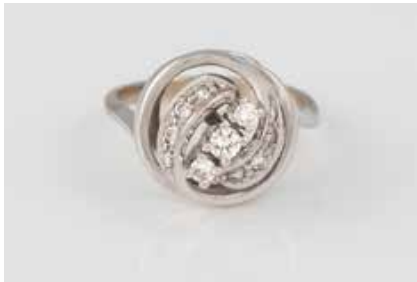
37 | BRILLANT-RING Weißgold. Ringmaß ca. 52, Ges.-Gew. ca. 5,0 g. Gest. 585, Caratangabe der Diamanten gemarkt. 11 Brillanten, zusammen ca. 0,30 ct. Schienengröße geändert, Besch. € 200,-