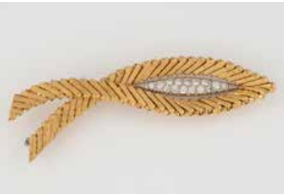
57 | DIAMANT-NADEL Gelbgold, Weißgold. L. 7,0 cm, Ges.-Gew. ca. 20,0 g. Geprüft 18 K. 15 Diamanten im Brillant- und 8/8-Schliff, zusammen ca. 0,45 ct. € 1.000,-