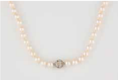
355 | PERL-COLLIER MIT DIAMANT-SCHLIESSE Weißgold. L. 49 cm, Ges.-Gew. ca. 39,5 g. Schließe (separat) gest. 750. Bajonettansätze des Colliers ungeprüft. Kugelschließe (Bajonett) mit 16 fanyfarbenen Brillanten (behandelt) und 16 weißen Brillanten, zusammen ca. 0,96 ct. D. der Kugeln jeweils ca. 7,5 mm. € 600,-