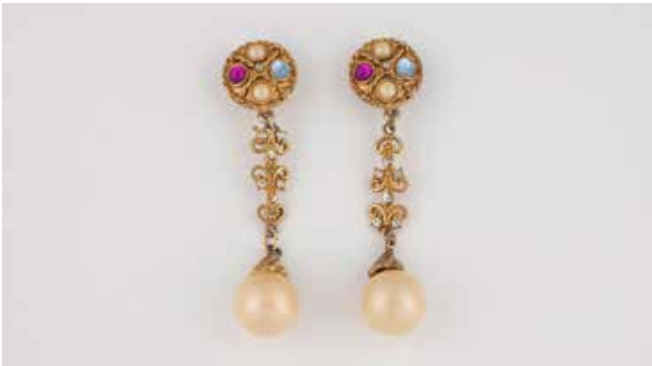
454 | ,COSTUME JEWELLERY' - PAAR OHRCLIPS' Metall, vergoldet. 10,2 cm. Kunstperlen und farbige und weiße Schmucksteine, z.T. facettiert. Besch. € 600,-