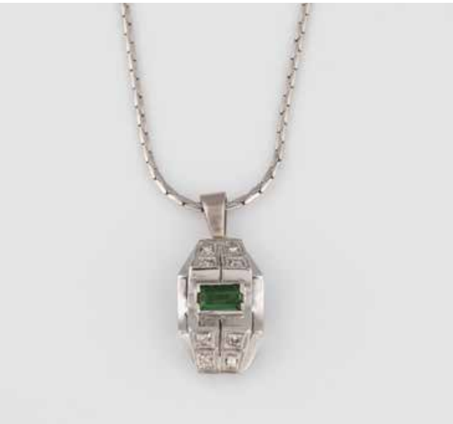
309 | ANHÄNGER MIT KETTE Weißgold. Anhänger 2,5 x 1,7 cm, Kette L. 45 cm. Ges.-Gew. zus. ca. 7,7 g. Gest. 585. Acht Diamanten im 8/8-Schliff, zusammen ca. 0,08 ct., ein Turmalin (?), ca. 5,0 x 2,7 mm, Höhe nicht messbar. € 300,-