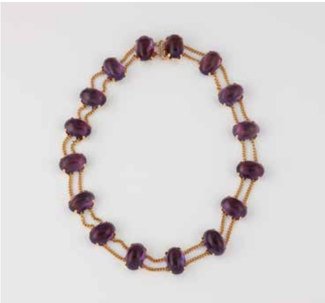
247 | AMETHYST-COLLIER Gelbgold. L.36,5 cm, Ges.-Gew. ca. 50,5 g. Gest. 585. 16 ovale Amethyst-Cabochons, zus. ca. 128 ct. € 900,-