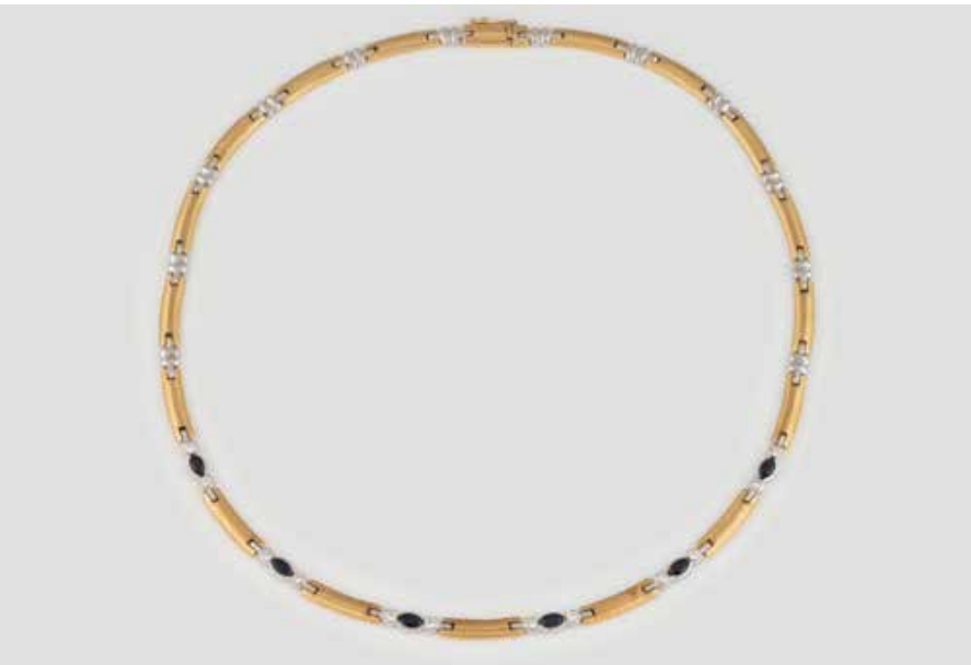
205 | EDELSTEIN-COLLIER Gelbgold, Weißgold. Innen-D. 14 cm, Ges.-Gew. ca. 41,4 g. Gest. 750. Sechs Saphire im Navetteschliff, zus. ca. 1,26 ct., 12 Brillanten, zus. ca. 0,48 ct. € 2.000,-