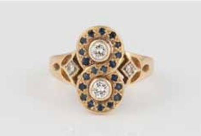
212 | EDELSTEIN-RING Gelbgold. Ringmaß ca. 57, Ges.-Gew. ca. 5,4 g. Gest. 585. 20 rund facettierte Saphire, Schultern besetzt mit zwei Brillanten, zus. ca. 0,04 ct., zwei Brillanten, zus. ca. 0,3 ct. Leichte Tragespuren. € 300,-