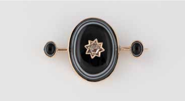
482 | BROSCH Gelbgold. 4 x 2,6 cm, Ges.-Gew. ca. 8,2 g. Geprüft 14 K, wohl österreichische Marke. Achat als Cabochon geschliffen, eine Diamantrose, D. ca. 3,3 mm. € 700,-