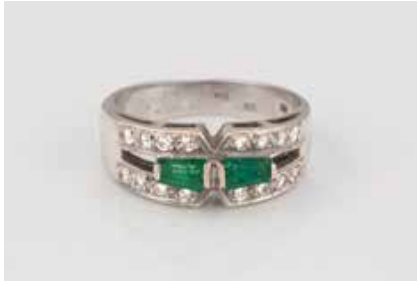
293 | RING Weißgold. Ringmaß ca. 53, Ges.-Gew. ca. 5,1 g. Gest. 585, Herstellerzeichen. 16 Brillanten, zusammen ca. 0,144 ct., zwei Smaragde im Trapezschliff. Leichte Tragespuren. € 160,-