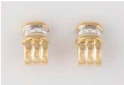
38 | PAAR DIAMANT-OHRSTECKER Gelbgold, Weißgold. 1,8 x 1,3 cm, Ges.-Gew. ca. 14,7 g. Gest. 750, Herstellerzeichen ‚Derix‘. Zusammen acht Diamanten im Princess-Schliff, zus. ca. 1,30 ct., etwa Top Wesselton, VS-SI. € 1.700,-