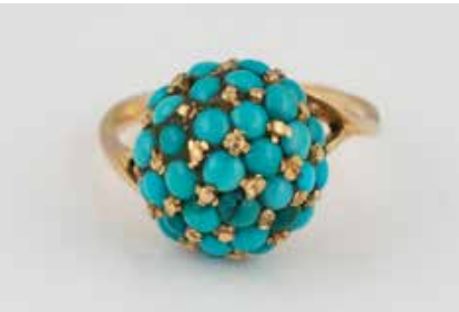
422 | TÜRKIS-RING Gelbgold. Ringmaß ca. 56, Ges.-Gew. ca. 5,4 g. Geprüft 18 K. Halbierter Türkisperlen, eine grünlich verfärbt. Besch. € 150,-