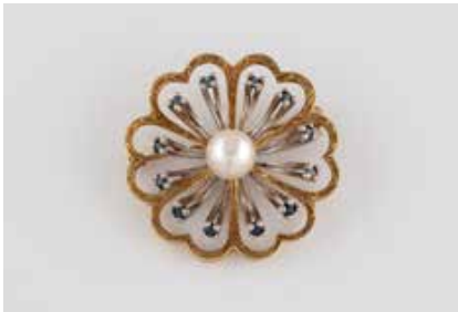
386 | PERL-BROSCHE MIT SAPHIRBESATZ Gelbgold, Weißgold. D. ca. 3,3 cm, Ges.-Gew. ca. 10,4 g. Gest. 585. Stilisierte Blütenform, eine Perle, D. ca. 7,7 mm, 12 rund facettierte Saphire. € 320,-