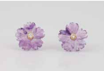
462 | PAAR OHRSTECKER Gelbgold. D. 1,4 cm, Ges.-Gew. ca. 2,3 g. Gest. 750. Ohrstecker aus geschnittenem Amethyst in Blütenform. Jeweils ein Brillant, ca. 0,08 ct., etwa Wesselton, VS-SI. Minimalst besch. € 200,-