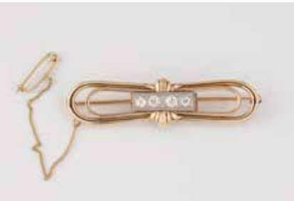
60 | DIAMANT-BROSCH Gelbgold, Weißgold. 5,9 cm, 1,5 cm, Ges.-Gew. ca. 11,2 g. Gest. 585, Herstellerzeichen. Vier Di- amanten im Altschliff, zusammen ca. 0,5 ct., etwa VS-SI. Min. besch. Durch Goldschmied 2022 aufgearbeitet. Sicher- heitskettchen dabei neu ergänzt. € 620,-