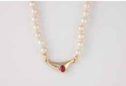
354 | PERL-COLLIER MIT EDELSTEIN-SCHLIESSE Gelbgold. L. 42,5 cm, Ges.-Gew. ca. 28,1 g. Gest. 585. D. der Perlen ca. 7,2 mm, Schließe mit einem ovalen Rubin-Cabochon, ca. 0,6 ct., ein Diamant im 8/8-Schliff. Einlieferung aus Juwelierschließung. € 160,-