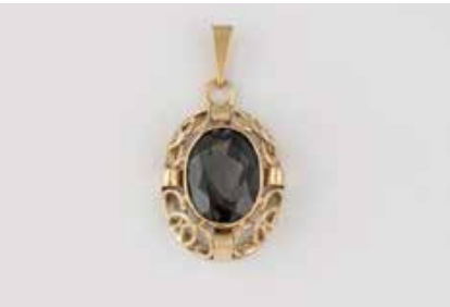
503 A | TURMALIN-ANHÄNGER Gelbgold. 3,5 x 1,8 cm, Ges.-Gew. ca. 4,4 g. Gest. 585, Herstellerzeichen. Ein oval facettierter Turmalin, ca. 5,30 ct. Minimale Tragespuren. Durch Goldschmied 2022 aufgearbeitet. € 140,-