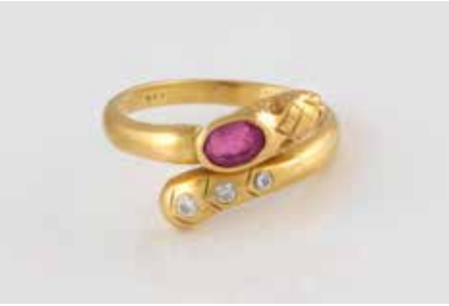
267 | SCHLANGEN-RING MIT EDELSTEIN- BESATZ Gelbgold. Ringmaß ca. 55, Ges.-Gew. ca. 4,8 g. Gest. 750. Ein oval facettierter Rubin, ca. 0,36 ct., drei Brillanten, zusammen ca. 0,06 ct. Mi- nimalste Tragespuren. € 320,-