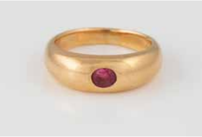
272 | RUBIN-RING Gelbgold. Ringmaß ca. 60, Ges.-Gew. ca. 12,9 g. Gest. 750, Herstellerzeichen. Ein oval facet- tierter Rubin, ca. 0,45 ct. Leichte Tragespuren. € 580,-