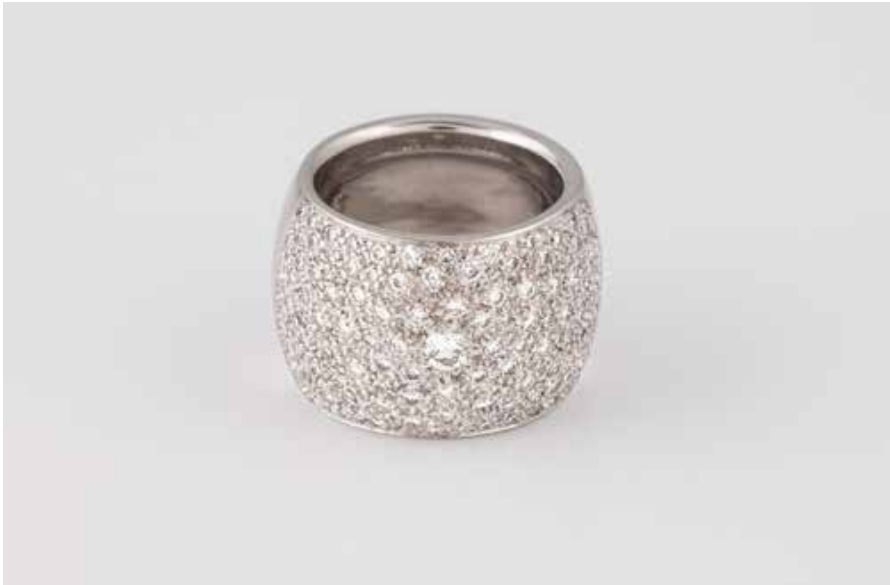
81 | BRILLANT-RING Weißgold. Ringmaß ca. 53,5, Ges.-Gew. ca. 25,8 g. Gest. 750. Ein Brillant, ca. 0,16 ct., Brillantbesatz in Pavé gefasst, zusammen ca. 2,70 ct. € 4.500,-