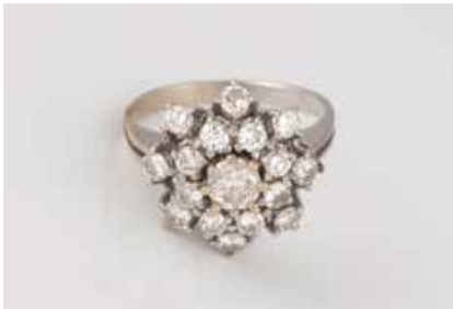
32 | DIAMANT-RING Weißgold (Gelbgold part. durchscheinend). Ringmaß ca. 53, Ges.-Gew. ca. 4,9 g. Geprüft 14 K. Hauptstein ca. 0,35 ct., 16 Brillanten, zusammen ca. 0,8 ct. Alle Steine Piqué. Part. Tragespuren. Schiene mit Reparaturstelle. € 280,-