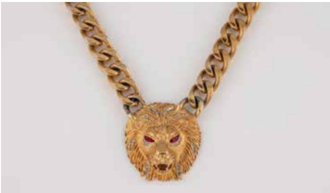
452 | ,COSTUME JEWELLERY' - LÖWEN-COLLIER Metall, vergoldet. L. 38 cm. Weiße und rote facettierte Schmucksteine. € 300,-