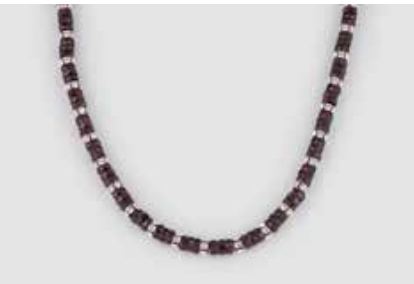
533 | COLLIER Vergoldung. L. 54,5 cm, Ges.-Gew. ca. 61,5 g. Facettierte Granatsteine sowie weiße Schmucksteine. € 80,-