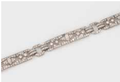
141 | DIAMANT-ARMBAND Platin. L. 18,5 cm, Ges.-Gew. ca. 25,2 g. Ca. 285 Diamanten im 8/8-, Alt- und Navetteschliff, zusammen ca. 7,5 ct. Ein Stein wohl durch Diamantrose ersetzt. € 6.500,-