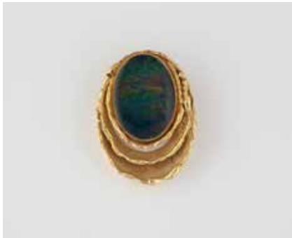
401 | OPAL-ANHÄNGER Gelbgold. 4,0 x 3,0 cm, Ges.-Gew. ca. 20,4 g. Geprüft 14 K. Einer Opal-Triplette, ca. 24,9 x 17,8 x 3,1 mm. Leicht besch. € 650,-