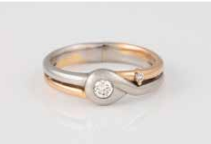
167 | DIAMANT-RING Platin, Gelbgold. Ringmaß ca. 54,5, Ges.-Gew. ca. 6,2 g. Gest. 950 Platin und 750, Herstellerzeichen. Ein Brillant, ca. 0,01 ct. und ein Brillant, ca. 0,14 ct. Schiene besch. € 250,-