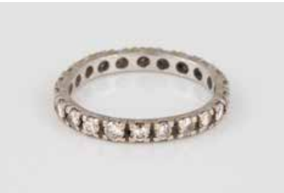
76 | ETERNITY-RING Gelbgold, Weißgold. Ringmaß ca. 54, Ges.-Gew. ca. 1,8 g. Geprüft 14 K. 22 Brillanten, zusammen ca. 0,88 ct. Part. min. besch., Schiene leicht unrund. € 200,-