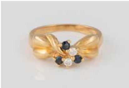
188 | EDELSTEIN-RING Gelbgold. Ringmaß ca. 51,5, Ges.-Gew. ca. 3,9 g. Gest. 750. Drei rund facettierte Saphire, zwei Brillanten, zus. ca. 0,08 ct. € 180,-