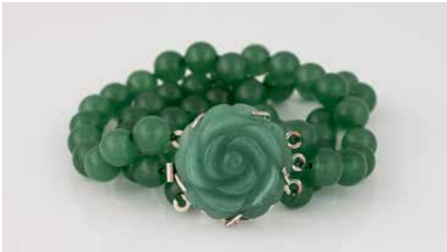
491 | ARMBAND Weißgold, Metall. L. 18,5 cm, Ges.-Gew. ca. 50,1 g. Schließe geprüft 8 K, Steckelement Schließe Metall. Dreireihiges Perl-Band aus Jadeit(?) - Perlen, D. ca. 8,3 mm, Schließe besetzt mit geschnittenem Jadeit(?) - Stein in Blütenform. € 300,-