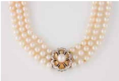
350 | PERL-COLLIER MIT DIAMANT-SCHLIESSE Gelbgold, Weißgold. L. 37,5 cm, Ges.-Gew. ca. 69,8 g. Gest. 585, Herstellerzeichen. Dreireihiges Collier, D. der Perlen ca. 6,3 mm, Schließe besetzt mit 16 Brillanten, zus. ca. 0,14 ct. € 280,-