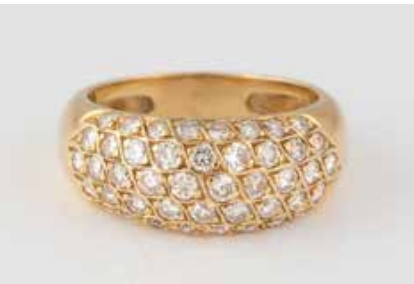
20 | BRILLANT-RING Gelbgold. Ringmaß ca. 54, Ges.-Gew. ca. 5,3 g. Geprüft 18 K, französische Marke ‚Adlerkopf‘, weitere Punzierung. 44 Brillanten, zusammen ca. 1,10 ct. € 1.150,-