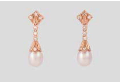
374 | PAAR PERL-OHRSTECKER MIT DIAMANTEN Roségold. L. 2,8 cm, Ges.-Gew. ca. 4,9 g. Gest. 585. Jeweils eine leicht ovale Perle, ca. 8,0 x 7,5 mm, zus. 20 Diamanten im 8/8-Schliff, zus. ca. 0,34 ct., etwa Top Wesselton-Wesselton, VS-SI. € 480,-