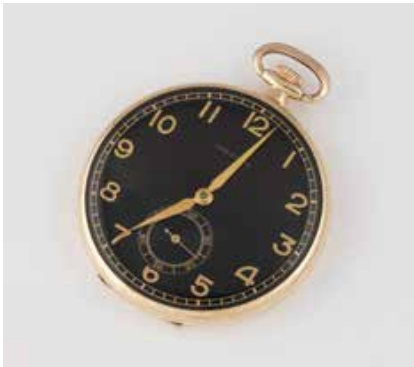
560 | TASCHENUHR ,MOERIS' Schweiz, 20. Jh. Gelbgold. D. 4,5 cm, Ges.-Gew. ca. 44,4 g. Gest. 585. Schwarzes Zifferblatt, bez. ,Moeris', Stunden- und Minutenzeiger, dezentrale Sekunde auf der ,6', 16 Rubine, Kompensationsunruhe mit gebläuter Breguetspirale. Bei der Prüfung funktionstüchtig. Aufgearbeitet, überholt und gereinigt 2022. € 550,-