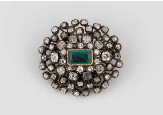
310 | HISTORISCHE BROSCHKE Gold, Silber. 2,9 x 2,8 cm, Ges.-Gew. ca. 8,9 g. Geprüft mindestens 8 K. Ein unbehandelter, kolumbianischer Smaragd, ca. 0,7 ct., 62 Diamanten im 8/8-Schliff und Old Mine Cut, zusammen ca. 2,8 ct. Rest. € 3.500,-