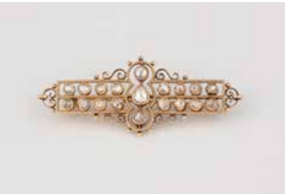
56 | DIAMANT-BROSCH Gelbgold. 5,0 x 2,0 cm, Ges.-Gew. ca. 6,2 g. Geprüft 14 K. 19 Diamantrosen unterschiedli- cher Größen. € 300,-