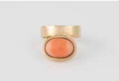
433 | KORALL-RING * Gelbgold. Ringmaß ca. 58,5, Ges.-Gew. ca. 8,4 g. Geprüft 14 K. Ein ovaler Korall-Cabochon, ca. 13,8 x 9,6 mm, verso geschlossen gearbeitet. € 360,-