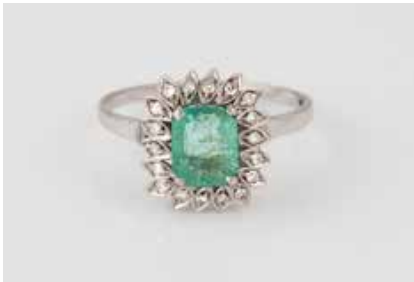
294 | EDELSTEIN-RING Weißgold. Ringmaß ca. 66, Ges.-Gew. ca. 3,9 g. Gest. 750. Ein Smaragd, ca. 1,60 ct., 18 weiße, rund facettierte Edelsteine. Besch. € 1.000,-