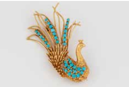
420 | BROSCHÉ ‚PFAU‘ Gelbgold. 5,5 x 3,7 cm, Ges.-Gew. ca. 11,6 g. Geprüft 18 K. Brosche in Form eines Pfau, besetzt mit Türkis-Cabochons. Besch. € 1.200,-