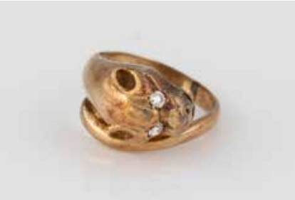
174 | RING Gelbgold. Ringmaß ca. 46, Ges.-Gew. ca. 4,0 g. Geprüft 14 K. Pantherkopf mit zwei weißen, rund facettierten Similisteinen als Augen. Schienengröße geändert. € 90,-