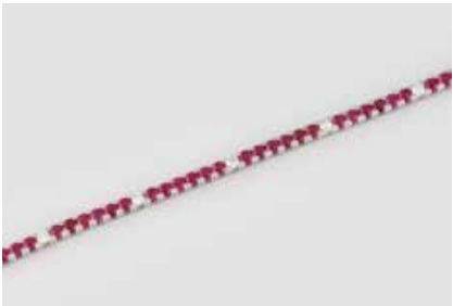
263 | EDELSTEIN-ARM BAND Weißgold. L. 18 cm, Ges.-Gew. ca. 11,3 g. Gest. 750, italienische Marke (Genova). 53 rund facettierte Rubine, zus. ca. 6,50 ct., acht Brillanten, zus. ca. 0,58 ct. etwa Top Wesselton - Wesselton, VS-SI. € 1.800,-