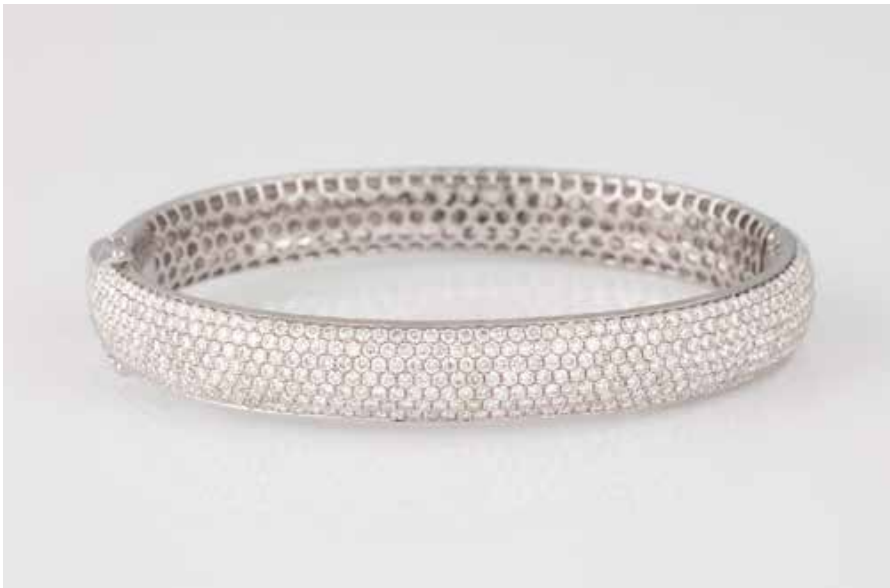
80 | DIAMANT-ARMREIF Weißgold. Innenmaß ca. 5,5 x 4,5 cm, Ges.-Gew. ca. 22,4 g. Gest. 750. Ca. 446 Brillanten, zus. ca. 2,30 ct., einer fehlend (unauffällig), etwa Top Wesselton, VS-SI. € 2.900,-