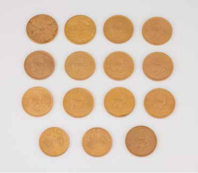
500 | KONVOLUT MÜNZEN 25-tlg. Gelbgold: 1) United States of America - Twenty Dollars, Liberty - 1908, Ges.-Gew. ca. 33,4 g. 2) United States of America - Twenty Dollars, Liberty - 1911, Ges.-Gew. ca. 33,4 g. 3) United States of America - Twenty Dollars, Liberty - 1923, Ges.-Gew. ca. 33,4 g. 4) United States of America - Twenty Dollars, Liberty - 1924, Ges.-Gew. ca. 33,4 g. 5) United States of America - Twenty Dollars, Liberty - 1927, Ges.-Gew. ca. 33,4 g. 6) United States of America - Twenty Dollars, Liberty - 1927, Ges.-Gew. ca. 33,4 g. 7) United States of America - Twenty Dollars, Liberty - 1927, Ges.-Gew. ca. 33,4 g. 8) United States of America - Twenty Dollars, Liberty - 1927, Ges.-Gew. ca. 33,4 g. 9) United States of America - Twenty Dollars, Liberty - 1927, Ges.-Gew. ca. 33,4 g. 10) United States of America - Twenty Dollars, Liberty - 1928, Ges.-Gew. ca. 33,4 g. 11) United States of America - Twenty Dollars, 1894, Ges.-Gew. ca. 33,4 g. 12) United States of America - Twenty Dollars, 1904, Ges.-Gew. ca. 33,4 g. 13) Republica de Chile - 1962, Cien Pesos - 100 Ps Diez Condores, Ges.-Gew. ca. 20,3 g. 14) Republica de Chile - 1962, Cien Pesos - 100 Ps Diez Condores, Ges.-Gew. ca. 20,3 g. 15) Suid-Afrika - South Africa - Krugerrand Fyngoud 1 Oz - Fine Gold, 1970, Ges.-Gew. ca. 33,9 g. 16) Suid-Afrika - South Africa - Krugerrand Fyngoud 1 Oz - Fine Gold, 1971, Ges.-Gew. ca. 33,9 g. 17) Suid-Afrika - South Africa - Krugerrand Fyngoud 1 Oz - Fine Gold, 1975, Ges.-Gew. ca. 33,9 g. 18) Suid-Afrika - South Africa - Krugerrand Fyngoud 1 Oz - Fine Gold, 1975, Ges.-Gew. ca. 33,9 g. 19) Suid-Afrika - South Africa - Krugerrand Fyngoud 1 Oz - Fine Gold, 1976, Ges.-Gew. ca. 33,9 g. 20) Suid-Afrika - South Africa - Krugerrand Fyngoud 1 Oz - Fine Gold, 1977, Ges.-Gew. ca. 33,9 g. 21) Suid-Afrika - South Africa - Krugerrand Fyngoud 1 Oz - Fine Gold, 1977, Ges.-Gew. ca. 33,9 g. 22) Suid-Afrika - South Africa - Krugerrand Fyngoud 1 Oz - Fine Gold, 1978, Ges.-Gew. ca. 33,9 g. 23) Suid-Afrika - South Africa - Krugerrand Fyngoud 1 Oz - Fine Gold, 1978, Ges.-Gew. ca. 33,9 g. 24) Suid-Afrika - South Africa - Krugerrand Fyngoud 1 Oz - Fine Gold, 1984, Ges.-Gew. ca. 33,9 g. 25) Suid-Afrika - South Africa - Krugerrand Fyngoud 1 Oz - Fine Gold, 1984, Ges.-Gew. ca. 33,9 g. € 46.000,-