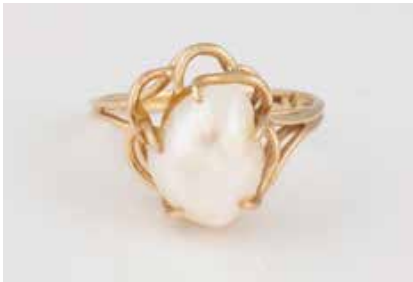
337 | PERL-RING Gelbgold. Ringmaß ca. 55, Ges.-Gew. ca. 3,1 g. Gest. 10 K, weitere Punzierungen. Eine Barock-Perle, L. ca. 11,9 mm. € 80,-