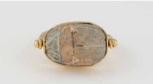
487 | SKARABÄUS-RING Gelbgold. Ringmaß ca. 53,5, Ges.-Gew. ca. 9,3 g. Geprüft 14 K. Drehbarer Kopf mit Skarabäus-Figur. € 380,-