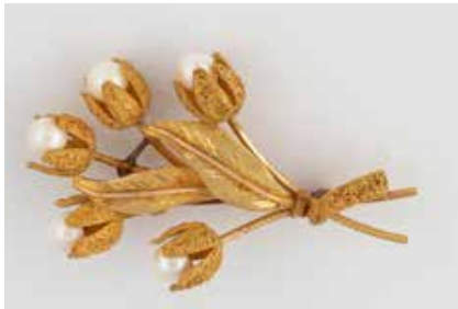
338 | PERL-BROSCHÉ Gelbgold, Rotgold. 6,0 x 3,7 cm, Ges.-Gew. ca. 17,4 g. Geprüft 18 K. Brosche in Blütenstraußform, fünf angeschnittene Perlen, D. ca. 6,1 mm. Wohl rest. € 650,-