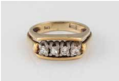
110 | BRILLANT-RING Gelbgold, Weißgold. Ringmaß ca. 54, Ges.- Gew. ca. 6,5 g. Gest. 585. Vier Brillanten, zu- sammen ca. 0,32 ct. € 220,-