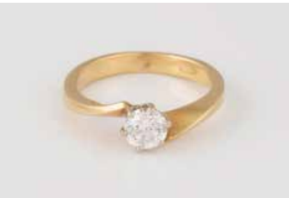
98 | BRILLANT-RING Gelbgold. Ringmaß ca. 50, Ges.-Gew. ca. 3,2 g. Gest. 750. Ein Brillant, ca. 0,5 ct., wohl Span- nungsriß an einer Krappe. € 200,-