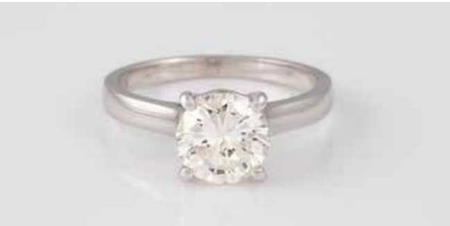
159 | BRILLANT-RING Weißgold. Ringmaß ca. 55, Ges.-Gew. ca. 4,2 g. Gest. 750. Ein natürlicher Brillant, 2.05 ct., Slightly Tinted White + (I), P1, Proportions good, Polish very good, Symmetry very good, Fluorescence nil. Laser Inscription. Angaben laut beigefügtem Report. Expertise: Diamond Grading Report, HRD Antwerp, Februar 2021. € 7.500,-