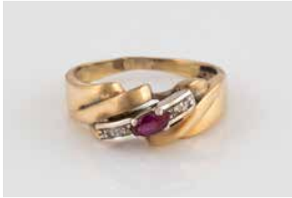
281 | EDELSTEIN-RING Gelbgold, Weißgold. Ringmaß ca. 55, Ges.- Gew. ca. 3,5 g. Gest. 585. Ein Rubin im Navet- teschliff, vier kleine Diamanten. Schienengröße geändert, besch. € 120,-