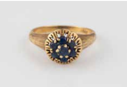
217 | SAPHIR-RING Gelbgold. Ringmaß ca. 55, Ges.-Gew. ca. 4,1 g. Gest. 750. Sieben rund facettierte Saphire. Tragespuren. € 80,-