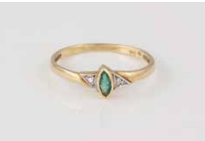
302 | RING Gelbgold. Ringmaß ca. 54, Ges.-Gew. ca. 1,4 g. Gest. 585, Herstellerzeichen. Ein Smaragd im Navetteschliff, ca. 0,08 ct., zwei kleine Diamanten im 8/8-Schliff. € 60,-