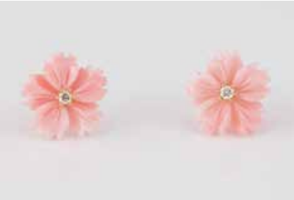
459 | PAAR OHRSTECKER Roségold. D. 1,4 cm, Ges.-Gew. ca. 2,2 g. Gest. 750. Ohrstecker aus geschnittenem Achat, in Blütenform. Jeweils ein Brillant, zus. ca. 0,08 ct., etwa Top Wesselton-Wesselton, VS-SI. € 200,-