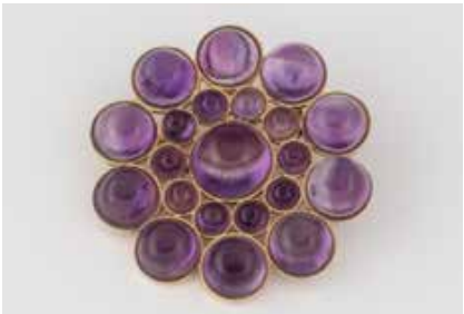
248 | ANHÄNGER / BROSCHE Gelbgold. D. 3,7 cm, Ges.-Gew. ca. 12,3 g. Geprüft 18 K. 21 Amethyst-Cabochons, zusammen ca. 24,8 ct. Part. Montierungsreste. € 250,-