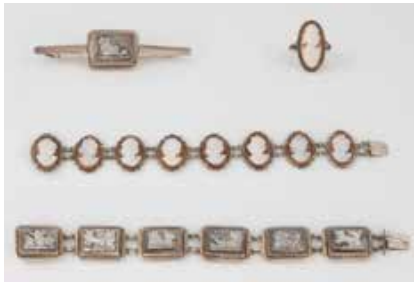
550 | KONVOLUT GEMMEN- UND KAMEE-SCHMUCK 4-tlg. Silber, geprüft oder gestempelt. Ges.-Gew. zus. ca. 68,0 g. 2 x Armband, 1 x Brosche, 1 x Ring. Unterschiedliche Herstellungszeiten und Erhaltungszustände. € 150,-