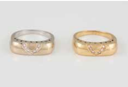
151 | PAAR DIAMANT-RINGE Gelbgold, Weißgold (Gelbgold durchscheinend). Ringmaß ca. 54, Ges.-Gew. ca. 11,3 g. Gest. 750, Herstellerzeichen ‚HPB‘. Jeweils sieben Brillanten, zusammen ca. 0,05 ct. An den Seiten der Köpfe und unterseitig jeweils Sonne-, Mond- und Sternausschnitte. € 550,-