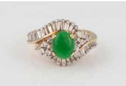
312 | RING Gelbgold, Weißgold. Ringmaß ca. 51, Ges.-Gew. ca. 6,0 g. Gest. 14 K. Ein ovales Jadeit-plättchen, ca. 8,0 x 6,4 x 2,2 mm, 44 Diamanten im Brillant-, Trapez- und Baguetteschliff, zusammen ca. 0,8 ct. € 700,-