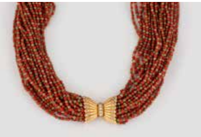
428 | COLLIER * Italien, 1970er Gelbgold. L. 43 cm, Ges.-Gew. ca. 105 g. Gest. 750, Herstellersignet. Mehrreihiges Collier aus Korall- und wohl Jadeit-Perlen, D. jeweils ca. 2,3 mm. Muschelförmige Goldschließe, besetzt mit 33 Brillanten, zusammen ca. 0,4 ct. € 300,-