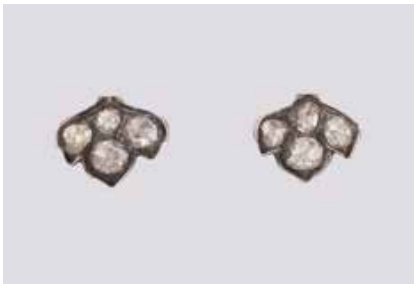
62 | PAAR DIAMANT-OHRSTECKER Gelbgold, Silber. 1,2 x 0,9 cm, Ges.-Gew. ca. 3,3 g. Gest. 585, 935. Zusammen acht Diam- antrosen, zus. ca. 1,0 ct. € 700,-