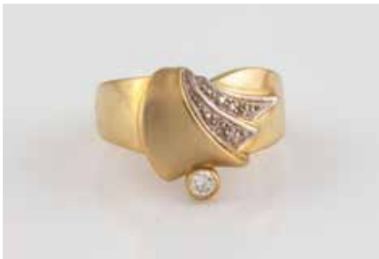
39 | DIAMANT-RING Gelbgold. Ringmaß ca. 54, Ges.-Gew. ca. 5,1 g. Gest. 585, Herstellersignet. Ein Brillant, ca. 0,07 ct., vier kleine Diamanten. € 160,-