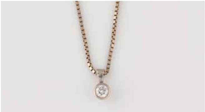
51 | DIAMANT-ANHÄNGER MIT KETTE Weißgold. Anhänger L. 1,0 cm, Kette L. 42,5 cm. Ges.-Gew. ca. 4,7 g. Gest. 585. Ein Brillant, ca. 0,25 ct. Kette Gelbgold durchscheinend. € 280,-