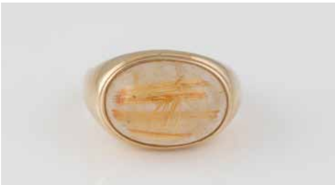
413 | RING Gelbgold. Ringmaß ca. 59, Ges.-Gew. ca. 8,3 g. Gest. 375. Ein Rutilquarz-Cabochon, ca. 8,6 ct. Leichte Tragespuren. € 120,-