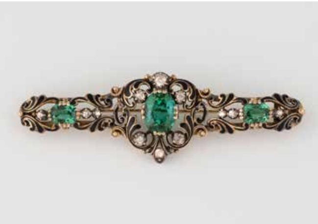
311 | BROSCHKE Gelbgold, Silber. L. 6,2 cm, Ges.-Gew. ca. 10,6 g. Gest. 585. Drei oval facettierte Turmaline, zusammen ca. 2,8 ct., 12 Diamantrosen, schwarzes Emaille. Minimalst besch. € 650,-