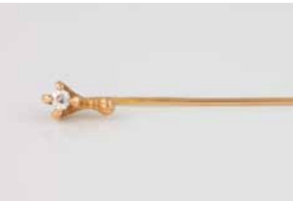
149 | DIAMANT-NADEL Gelbgold. L. 6,9 cm, Ges.-Gew. ca. 1,9 g. Geprüft 18 K, französische Marke ‚Adlerkopf‘, weitere Punzierungen. Ein Diamant im Altschliff, ca. 0,1 ct. Besch. € 190,-