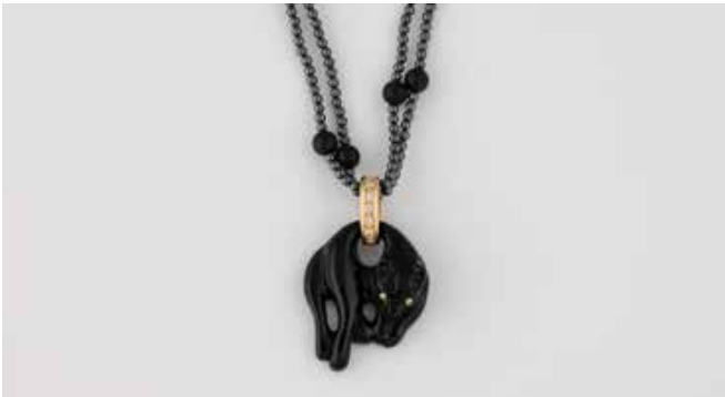
499 | ANHÄNGER MIT KETTE Gelbgold. Anhänger 3,9 x 2,4 cm, Ges.-Gew. ca. 7,5 g. Gest. 750, Herstellerzeichen. Hängender Panther aus Onyx (?), Öse besetzt mit vier Brillanten, zus. ca. 0,1 ct., ein weißer, rund facettierter Edelstein, wohl ergänzt, Augen aus zwei rund facettierten, weißen Edelsteinen. Kette mit Hämatitperlen und Onyx oder Jet (?), L. ca. 166 cm, Ges.-Gew. Kette ca. 26,2 g. € 120,-