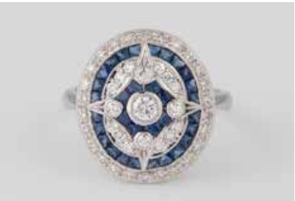
202 | EDELSTEIN-RING Weißgold. Ringmaß ca. 54, Ges.-Gew. ca. 3,2 g. Gest. 14 K. 32 Sapphire, zus. ca. 1,30 ct., 43 Diamanten, zus. ca. 0,58 ct., etwa Top Wesselton VS-SI. € 1.000,-