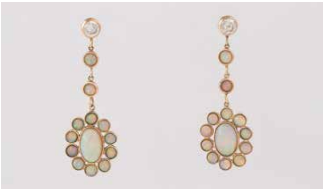
409 | PAAR OPAL-ANHÄNGER Gelbgold. L. 5,4 cm, Ges.-Gew. ca. 8,1 g. Geprüft 14 K, Sicherheitsstecker Doublé. Rund und oval geschliffene Opale, Doubletten oder Tripletten (?), verso geschlossen gearbeitet, jeweils ein rund facettierter Similistein. € 250,-