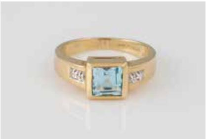
237 | RING Gelbgold. Ringmaß ca. 53, Ges.-Gew. ca. 4,4 g. Gest. 585, Herstellerzeichen, Carat- und Reinheitsangabe der Diamanten gemarkt. Ein rechteckig facettierter Topas, ca. 1,2 ct., vier Diamanten im 8/8-Schliff, zusammen ca. 0,015 ct. € 160,-