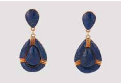
418 | PAAR OHRHÄNGER Gelbgold. L. 3,9 cm, Ges.-Gew. ca. 8,9 g. Geprüft 18 K (Sicherheitsstecker ungeprüft). Lapislazuli-Plättchen. Verso geschlossen gearbeitet. Brisuren gebogen. € 550,-