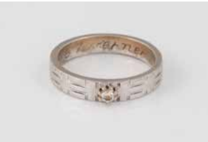
176 | BRILLANT-RING Weißgold. Ringmaß ca. 50, Ges.-Gew. ca. 3,6 g. Gest. 585, Herstellerzeichen, persönliche Gravur. Ein Brillant, ca. 0,05 ct. € 120,-