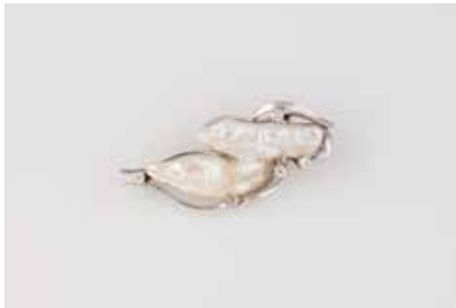
385 | PERL-BROSCHE Weißgold. 5,0 x 2,0 cm, Ges.-Gew. ca. 11,0 g. Geprüft 14 K. Vier Brillanten, zus. ca. 0,27 ct. € 300,-