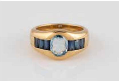
235 | EDELSTEIN-RING Gelbgold. Ringmaß ca. 56, Ges.-Gew. ca. 9,7 g. Gest. 750. Sechs Saphire (wohl synth.) im Baguetteschliff, zusammen ca. 0,96 ct., ein oval facettierter Topas, ca. 1,20 ct. € 480,-