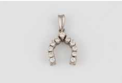
175 | ANHÄNGER ‚HUFEISEN‘ Weißgold. L. 2,0 cm, Ges.-Gew. ca. 2,1 g. Geprüft 18 K. 11 Diamanten, zusammen ca. 0,33 ct. Leichte Tragespuren. € 150,-