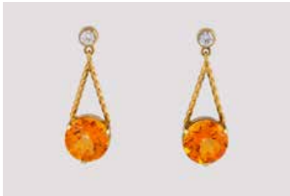
443 | PAAR EDELSTEIN-OHRHÄNGER Gelbgold. L. 3,2 cm, Ges.-Gew. ca. 6,3 g. Gest. 585. Jeweils ein orangefarbener Edelstein, ca. 10,9 x 7,2 mm sowie jeweils ein rund facettierter, weißer Similistein. Besch. € 160,-