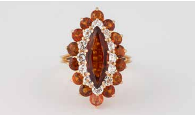
445 | CITRIN-RING MIT BRILLANTEN Gelbgold. Ringmaß ca. 54, Ges.-Gew. ca. 8,5 g. Geritzt 750, weitere Punzierungen, undeutlich, nummeriert. Ein Citrin im Navetteschliff, 14 rund facettierte Citrine. 12 Brillanten, zus. ca. 1,20 ct., etwa Top Wesselton - Wesselton, VS-SI. € 1.700,-