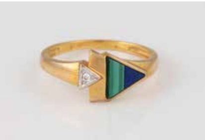
464 | RING Gelbgold, Weißgold. Ringmaß ca. 57,5. Gest. 375, Herstellerzeichen. Ein weißer, rund facettierter Similitstein, Malachit- und Lapislazuli-plättchen. € 50,-