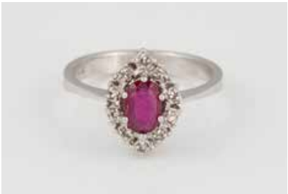
261 | EDELSTEIN-RING Weißgold. Ringmaß ca. 54, Ges.-Gew. ca. 3,6 g. Gest. 750. Ein oval facettierter Rubin, ca. 0,42 ct., 10 Diamanten im 8/8-Schliff. € 300,-