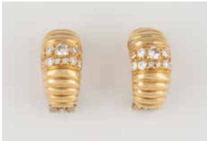
67 | PAAR OHRCLIPS MIT BRILLANTEN Gelbgold. 2,1 x 1,0 cm, Ges.-Gew. ca. 19,5 g. Schaustück geprüft 18 K. Zusammen besetzt mit 22 Brillanten, zus. ca. 1,10 ct. Min. besch. € 1.200,-