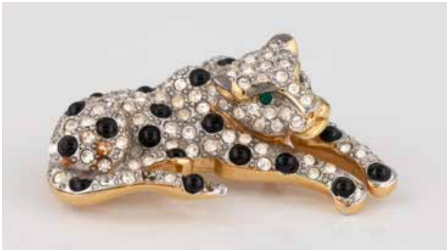
453 | ,COSTUME JEWELLERY' - PANTHER-BROSCHE Metall, vergoldet. L. 4,0 cm. Signiert, undeutlich. Liegende Pantherfigur, Part. Steine fehlend. € 180,-