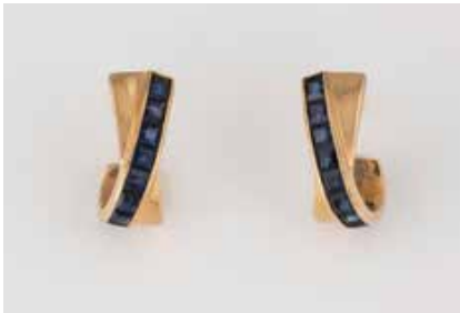
184 | PAAR SAPHIR-OHRSTECKER Gelbgold. L. 1,5 cm, Ges.-Gew. ca. 4,1 g. Gest. 585. Zusammen besetzt mit 18 rechteckig facettierten Saphiren, zus. ca. 0,72 ct. € 140,-