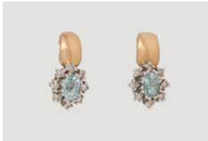
243 | PAAR OHRSTECKER Gelbgold, Weißgold. 1,6 x 0,8 cm, Ges.-Gew. ca. 4,2 g. Gest. 585. Jeweils ein oval facettierter Aquamarin, ca. 4,8 x 3,4 mm, Höhe nicht messbar, zusammen 16 Brillanten, zus. ca. 0,16 ct. € 130,-