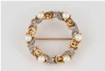
365 | PERL-BROSCH MIT DIAMANTBESATZ Gelbgold, Weißgold. D. 3,0 cm, Ges.-Gew. ca. 7,6 g. Gest. 585. Sechs Perlen, D. ca. 4,2 mm, sechs Diamantrosen. Minimalst besch. € 230,-