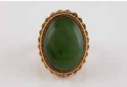
317 | RING Rotgold. Ringmaß ca. 56, Ges.-Gew. ca. 7,5 g. Gest. 14 K. Ein ovaler, grüner Cabochon, wohl Nephrit oder Achat (?), ca. 19,9 x 14,9 x 4,7 mm. € 180,-