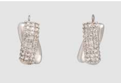
71 | PAAR OHRSTECKER Weißgold. 2,0 x 0,9 cm, Ges.-Gew. ca. 5,3 g. Gest. 585, Caratangabe der Diamanten gemarkt. Zusammen besetzt mit 54 Brillanten, zusammen ca. 1,0 ct. € 180,-