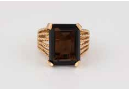
503 | RING Gelbgold. Ringmaß ca. 53, Ges.-Gew. ca. 7,8 g. Gest. 14 K. Ein rechteckig facettierter Rauchquarz, ca. 9,0 ct. Leichte Tragespuren. € 240,-