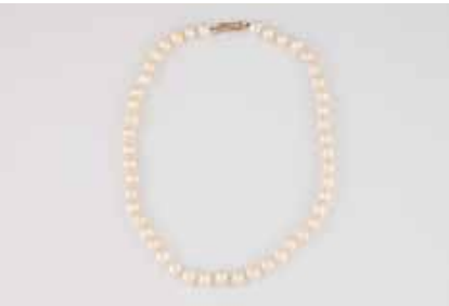
539 | PERL-COLLIER Gelbgold. L. 48 cm, Ges.-Gew. ca. 51,2 g. Gest. und geprüft 585 bzw. 14 K. Schließeelement separat abnehmbar. gemarkt ‚Handarbeit‘, D. der Perlen ca. 9,2 mm, unrund. € 80,-