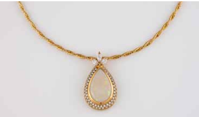
402 | OPAL-ANHÄNGER MIT DIAMANTBESATZ MIT KETTE Gelbgold. Anhänger L. 3,7 cm, Kette L. 41,5 cm. Ges.-Gew. zus. ca. 22,4 g. Beide Stücke gest. 750, Anhänger mit Caratangabe der Diamanten. Ein Opal-Cabochon im Tropfenschliff, ca. 20,3 x 12,9 mm (verso geschlossen gearbeitet), 69 Brillanten und drei Diamanten im Navetteschliff, zusammen 1,55 ct. Kette aus Golddraht. Expertise: Beigefügtes Zertifikat W. Weber & Sohn, Diamantenschleiferei und Juwelenfabrikation GmbH, Schönenberg-Kübelberg. € 1.600,-