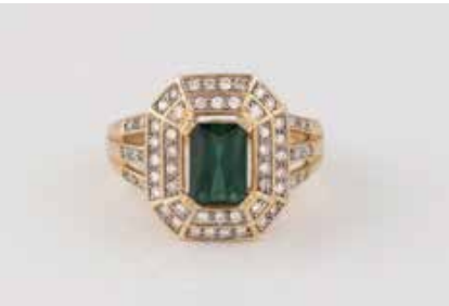
285 | TURMALIN-RING MIT DIAMANTEN Gelbgold. Ringmaß ca. 48, Ges.-Gew. ca. 4,7 g. Geprüft 14 K. Ein Turmalin, ca. 1,0 ct., 56 Brillanten, zusammen ca. 0,28 ct. Leichte Tragespuren. € 180,-