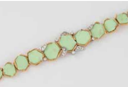
318 | ARMBAND Gelbgold, Weißgold. L. 17,5 cm, Ges.-Gew. ca. 42,4 g. Gest. 750, Herstellerzeichen. 13 Zitro- nenchrysopras-Plättchen, fünf Brillanten, zus. ca. 0,37 ct., 16 Brillanten, zusammen ca. 0,4 ct. € 900,-