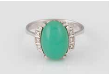
315 | CHRYSOPRAS-RING Weißgold. Ringmaß ca. 55, Ges.-Gew. ca. 3,8 g. Gest. 585. Ein ovaler Chrysopras-Cabochon, ca. 12,9 x 8,9 x 4,4 mm, sechs Diamanten im 8/8-Schliff, zusammen ca. 0,06 ct. € 120,-