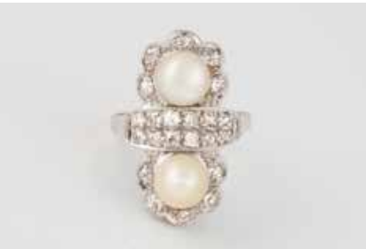
327 | RING Schiene Gelbgold, Kopf wohl Platin. Ringmaß ca. 54, Ges.-Gew. ca. 6,9 g. Schiene geprüft 18 K. Zwei Bouton-Perlen, D. ca. 6,9 und 6,8 mm, 22 Diamanten im Altschliff, zusammen ca. 0,55 ct. € 600,-