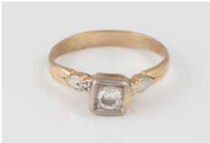
513 | BILLANT-RING Gelbgold, Weißgold. Ringmaß ca. 52, Ges.-Gew. ca. 1,8 g. Geprüft 14 K. Ein Brillant, ca. 0,15 ct. Besch. € 50,-