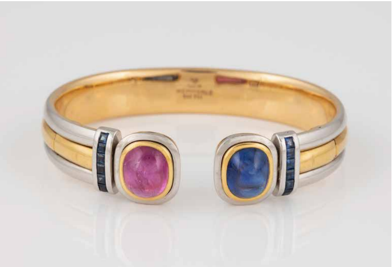
208 | EDELSTEIN-ARMREIF ‚HEMMERLE‘ Gelbgold, Platin. Innenmaß ca. 5,9 x 4,5 cm, Ges.-Gew. ca. 96,7 g. Gest. 759, 900 Platin, Herstellerzeichen. Ein Saphir-Cabochon, ca. 6,5 ct., ein rosa Saphir-Cabochon, ca. 6,3 ct., 12 rechteckig facettierte Saphire, zusammen ca. 0,6 ct. Tragespuren. € 15.000,-