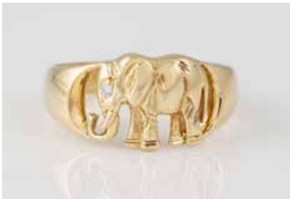
542 | RING Gelbgold. Ringmaß ca. 56, Ges.-Gew. ca. 4,1 g. Gest. 14 Ct.. Ring mit Elefantenfigur, ein Brillant als Auge, ca. 0,015 ct., etwa Wesselton, Sl. Durch Goldschmied 2022 aufgearbeitet. € 170,-