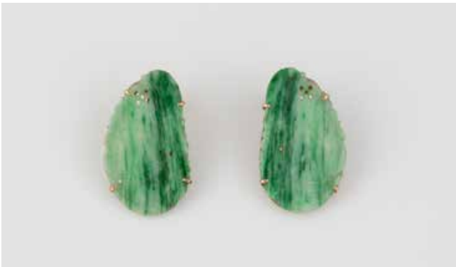
490 | PAAR OHRCLIPS Gelbgold. 2,8 x 1,7 cm, Ges.-Gew. ca. 7,4 g. Gest. 585, 14 K, Reste asiatischer Schriftzeichen. Jeweils ein grün-weißer Schmuckstein mit geschnittenem Muster. € 140,-