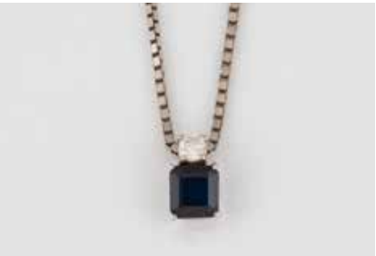
204 | EDELSTEIN-ANHÄNGER MIT KETTE Weißgold. Anhänger 1,0 x 0,6 cm, Kette L. 43,5 cm. Ges.-Gew. ca. 4,6 g. Gest. oder geprüft 585 und 14 K. Ein Saphir, ca. 0,7 ct., ein Brillant, ca. 0,1 ct. Leicht besch. € 150,-