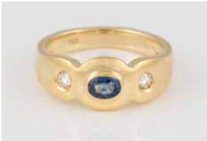
187 | EDELSTEIN-RING Gelbgold. Ringmaß ca. 55, Ges.-Gew. ca. 7,8 g. Gest. 750. Ein rund facettierter Moissanite, ca. 2,3 x 1,4 mm, ein Brillant, ca. 0,05 ct., ein oval facettierter Saphir, ca. 0,26 ct. Leichte Tragespuren. € 330,-