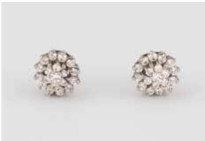
63 | PAAR DIAMANT-OHRSTECKER Weißgold. D. ca. 0,8 cm, Ges.-Gew. ca. 2,0 g. Geprüft 14 K. Zusammen besetzt mit 38 Bril- lanten, zusammen ca. 0,30 ct. € 100,-