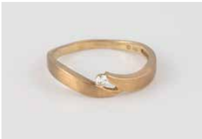
510 | RING Gelbgold. Ringmaß ca. 56, Ges.-Gew. ca. 1,8 g. Gest. 333, Herstellerzeichen. Ein rund facettierter Similistein. € 40,-