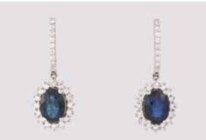
196 | PAAR EDELSTEIN-OHRHÄNGER Weißgold. L. 2,6 cm, Ges.-Gew. ca. 6,1 g. Gest. 750. Jeweils ein oval facettierter Saphir, zus. ca. 1,6 ct., zus. 48 Brillanten, zus. ca. 0,67 ct., etwa Top Wesselton, VS-SI. € 1.000,-