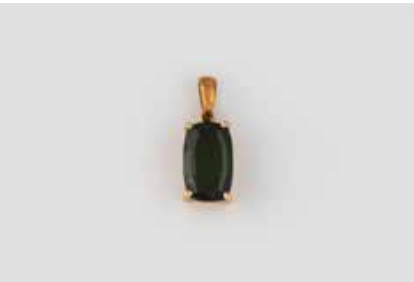
308 | ANHÄNGER Gelbgold. L. 1,9 cm, Ges.-Gew. ca. 2,0 g. Gest. 750. Ein Turamlin, ca. 3,1 ct. € 100,-