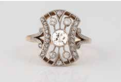
138 | DIAMANT-RING Gelbgold, Platin. Ringmaß ca. 52, Ges.-Gew. ca. 3,5 g. Gest. 750, Pt. 900. 31 Diamanten im Alt- und Rosenschliff, zusammen ca. 0,60 ct. € 750,-