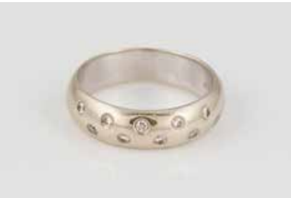
135 | BRILLANT-RING Weißgold (Gelbgold durchscheinend). Ringmaß ca. 51, Ges.-Gew. ca. 3,9 g. Gest. 585, Caratangabe der Diamanten gemarkt. 10 Brillanten, zus. ca. 0,20 ct. € 180,-