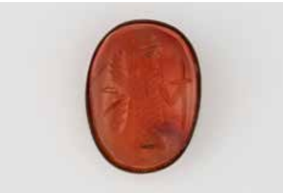
430 | GEMMEN-ANHÄNGER Silber. 2,5 x 1,8 cm, Ges.-Gew. ca. 6,3 g. Gest. 935. Ovale Karneol-Gemme mit geschnittener Antikenfigur. € 450,-