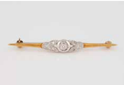
61 | DIAMANT-BROSCH Gelbgold, Weißgold. L. 5,2 cm, Ges.-Gew. ca. 3,3 g. Gest. 585, Caratangabe der Diamanten gemarkt. Fünf Diamanten, zusammen ca. 0,09 ct. € 100,-