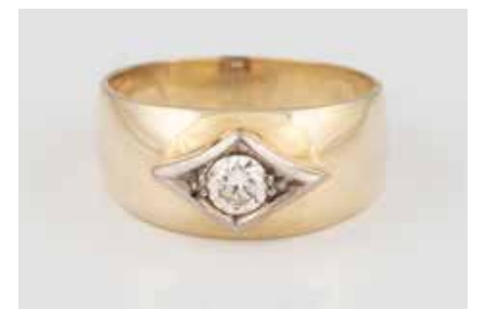
9 | BRILLANT-RING Gelbgold, Weißgold. Ringmaß ca. 57, Ges.- Gew. ca. 6,8 g. Gest. 585. Ein Brillant, ca. 0,25 ct. Schienengröße geändert. € 280,-