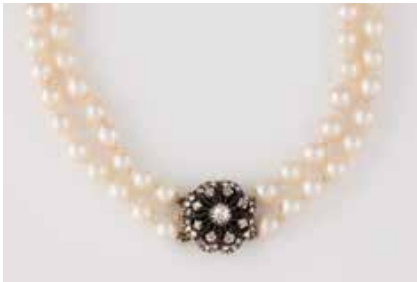
353 | PERL-COLLIER MIT DIAMANT-SCHLIESSE Gelbgold, Silber. L. 36 cm, Ges.-Gew. ca. 40,7 g. Gest. 585. Zweireihiges Collier, D. der Perlen ca. 6,4 mm, Schließe besetzt mit insgesamt 33 Diamantrosen unterschiedlicher Größen. € 450,-