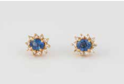
214 | PAAR EDELSTEIN-OHRSTECKER Gelbgold. 0,8 x 0,9 cm, Ges.-Gew. ca. 2,3 g. Gest. 750. Jeweils ein oval facettierter Saphir, ca. 5,1 x 4,1 mm, Höhe nicht messbar, zusammen besetzt mit 20 Brillanten, zusammen ca. 0,18 ct. € 150,-