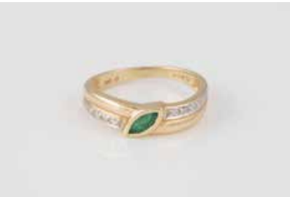
306 | RING Gelbgold, Weißgold. Ringmaß ca. 55, Ges.-Gew. ca. 2,8 g. Gest. 585. Ein Smaragd im Navetteschliff, ca. 0,16 ct., zwei kleine Diamanten im 8/8-Schliff. Minimale Tragespuren. € 90,-