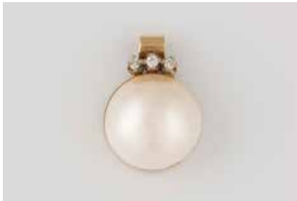
367 | PERL-ANHÄNGER Gelbgold. 2,2 x 1,5 cm, Ges.-Gew. ca. 4,5 g. Geprüft 14 K. Eine Mabe-Perle, D. ca. 15,2 mm, drei Brillanten, zus. ca. 0,075 ct. € 120,-

Weißgold. Anhänger L. 3,0 cm, Ges.-Gew. ca. 2,2 g. Gest. 585. Anhänger mit einer Perle, ca. 9,0 x 7,9 mm, 11 Diamanten im 8/8-Schliff, zus. ca. 0,15 ct. Kette L. 37,5 cm, Gest. 585, Gew. ca. 1,7 g. € 360,-