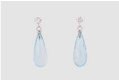
231 | PAAR TOPAS-OHRHÄNGER MIT DIAMANTBESATZ Weißgold. L. 2,8 cm, Ges.-Gew. ca. 5,6 g. Gest. 750. Jeweils ein Topas im Brioletteschliff, ca. 19,3 x 7,2 mm, jeweils ein Brillant, zus. ca. 0,24 ct., etwa Top Wesselton, VS-SI. Minimalste Tragespuren. € 470,-