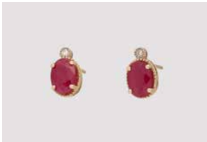
544 | PAAR OHRSTECKER Gelbgold. 1,0 x 0,5 cm, Ges.-Gew. ca. 1,8 g. Gest. 585. Jeweils ein oval facettierter Rubin, ca. 7,0 x 5,0 mm, Höhe nicht messbar, jeweils ein Brillant, zus. ca. 0,02 ct. € 90,-