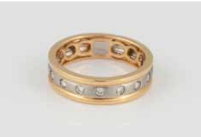
26 | BRILLANT-RING Gelbgold, Platin. Ringmaß ca. 50, Ges.-Gew. ca. 5,0 g. Gest. 750, Pt. 950. Sieben Brillanten, zusammen ca. 0,07 ct. € 280,-