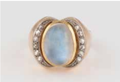
424 | RING Gelbgold. Ringmaß ca. 55, Ges.-Gew. ca. 9,0 g. Gest. 585, Meistermarke. Ein ovaler Cabochon, ungedeutet, wohl hinterlegt, ca. 12,79 x 8,72 mm, verso geschlossen gearbeitet, 12 Diamanten im 8/8-Schliff, zusammen ca. 0,2 ct. Leichte Tragespuren. Schiene min besch. Ein Schiennenteil später ergänzt. € 280,-