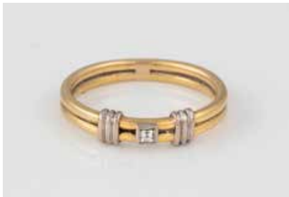
109 | DIAMANT-RING Gelbgold, Weißgold. Ringmaß ca. 50, Ges.- Gew. ca. 3,2 g. Geprüft 18 K. Ein rechteckig fa- cettierter Diamant, ca. 0,025 ct. € 140,-