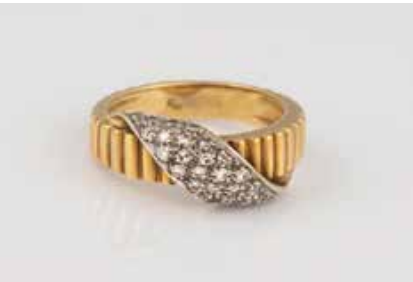
105 | DIAMANT-RING Gelbgold, Weißgold. Ringmaß ca. 52, Ges.- Gew. ca. 6,1 g. Gest. 750. Ca. 26 Diamanten, zus. ca. 0,18 ct. € 250,-