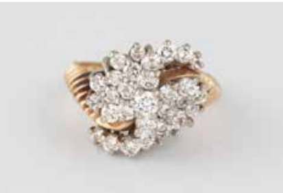
137 | DIAMANT-RING Gelbgold, Weißgold. Ringmaß ca. 57,5, Ges.-Gew. ca. 7,2 g. Schiene geprüft 14 K. 33 Brillanten, zusammen ca. 1,3 ct. Schienengröße geändert. Leicht besch. € 350,-