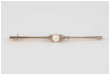
387 | PERL-BROSCHE Gelbgold, Platin. L. 6,2 cm, Ges.-Gew. ca. 3,7 g. Gest. 585. Eine Perle, wohl halbiert, D. ca. 5,3 mm. € 80,-