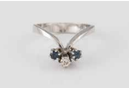
195 | EDELSTEIN-RING Weißgold. Ringmaß ca. 51, Ges.-Gew. ca. 4,1 g. Gest. 750. Ein Brillant, ca. 0,1 ct., zwei rund facettierte Sapphire. € 280,-