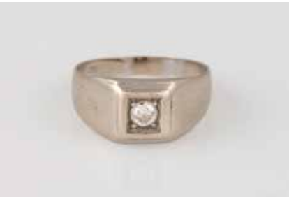
166 | DIAMANT-RING Weißgold. Ringmaß ca. 59, Ges.-Gew. ca. 5,6 g. Gest. 750. Ein Brillant, ca. 0,25 ct. Schienengröße geändert. € 280,-