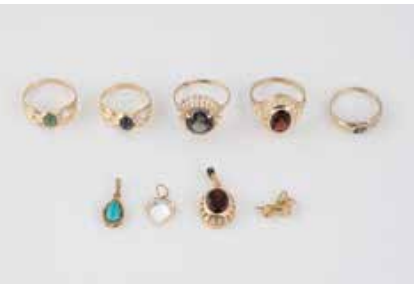
553 | KONVOLUT SCHMUCK 9-tlg. Gelbgold. Ges.-Gew. zus. ca. 14,1 g. Alle gest. oder geprüft 333 bzw. 8 K. Fünf Ringe, vier Anhänger. Zum Teil mit Besatz, u.a. Saphir, Diamant, Türkis. Einlieferung aus Juwelierschließung. € 280,-