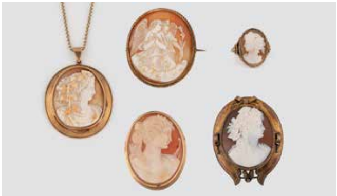
527 | KONVOLUT KAMEE-SCHMUCK 5-tlg. Gelbgold, Metall. Drei Anhänger, davon zwei mit Broschierung, Rah-mungen geprüft 14 K. Ges.-Gew. ca. 36,2 g. Dazu Kette, gest. 585, Gew. ca. 13,2 g. Brosche und Ring, geprüft 8 K, Ges.Gew. ca. 17,2 g. Unter-schiedliche Erhaltungszustände. € 400,-