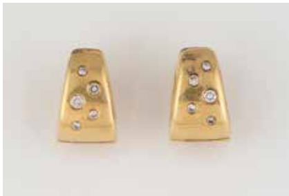
40 | PAAR DIAMANT-OHRSTECKER Gelbgold. L. 1,5 cm, Ges.-Gew. ca. 9,8 g. Gest. 750. 10 Diamanten, zus. ca. 0,15 ct. € 500,-