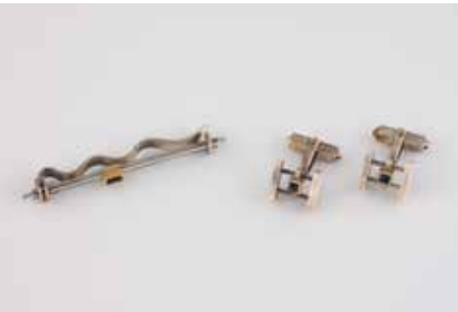
526 | SCHMUCK-SET 2-tlg. Silber, part. vergoldet, part. berieben. Alle Stücke gest. 925, Herstellersignet. Paar Manschettenknöpfe sowie eine Krawatten-klammer, jedes Stück mit einem rechteckig fa-cettierten, synth. Saphir. Ges.-Gew. zusammen ca. 16,6 g. € 70,-