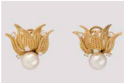
364 | PAAR PERL-OHRSTECKER MIT BRILLANTEN Gelbgold. 2,2 x 2,5 cm, Ges.-Gew. ca. 14,0 g. Gest. 750. Jeweils eine Perle, D. ca. 8,6 mm, zus. 10 Brillanten, zus. ca. 0,4 ct., etwa Top Wesselton, VS-SI. € 1.250,-

Weißgold. L. 42,5 cm, Ges.-Gew. ca. 13,7 g. Gest. 585. Eine Perle, D. ca. 7,2 mm, drei Diamanten im 8/8-Schliff, zus. ca. 0,09 ct., sechs rund facettierte Rubine. € 470,-