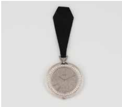
562 | FRACKUHR ,PIAGET' Schweiz, 1970er Weißgold. D. 4,3 cm, Ges.-Gew. ca. 37,9 g. Geprüft 18 K, schweizer Prüfstempel. Strukturiert gearbeitetes Gehäuse und Zifferblatt, bez. ,Piaget', Stabindexe, Stunden- und Minutenzeiger, Krone auf der ,6', 52 Brillanten, zusammen ca. 1 ct., Lederbändchen an abnehmbarer Öse. Zifferblatt mit Besch. Bei der Prüfung nicht funktionstüchtig, ungeöffnet. € 2.000,-