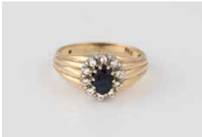
189 | EDELSTEIN-RING Gelbgold, Weißgold. Ringmaß ca. 53, Ges.-Gew. ca. 4,3 g. Gest. 585. 10 Brillanten, zusammen ca. 0,1 ct., ein oval facettierter Saphir, ca. 0,39 ct. € 140,-