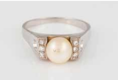
329 | PERL-RING MIT DIAMANTBESATZ Weißgold. Ringmaß ca. 60, Ges.-Gew. ca. 7,3 g. Gest. 590, Herstellerzeichen. Eine Perle, D. ca. 7,6 mm, sechs Brillanten, zus. ca. 0,1 ct. Leicht besch. € 220,-