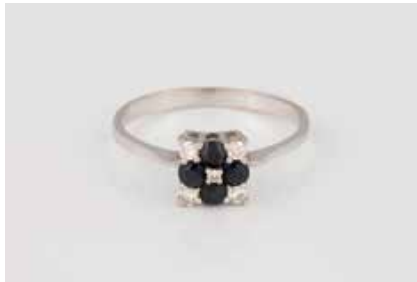
232 | RING Weißgold. Ringmaß ca. 58, Ges.-Gew. ca. 2,1 g. Gest. 585. Vier Diamanten im 8/8-Schliff, zusammen ca. 0,12 ct., ein kleiner Diamant im 8/8-Schliff, vier rund facettierte Saphire. Minimale Tragespuren. € 100,-