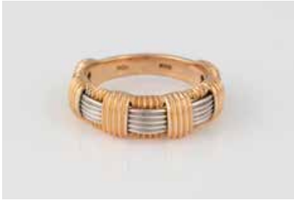
279 | RUBIN-RING Gelbgold, Weißgold. Ringmaß ca. 55, Ges.- Gew. ca. 7,0 g. Gest. 750, italienische Punzie- rung. Innenliegend in der Schiene ein rund fa- cettierter Rubin. € 500,-