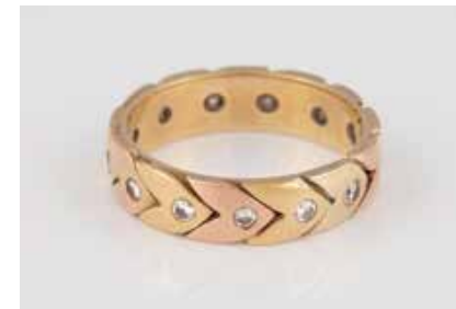
4 | DIAMANT-RING Gelbgold, Rotgold. Ringmaß ca. 59,5, Ges.- Gew. ca. 6,7 g. Geprüft 14 K. 13 Brillanten, zu- sammen ca. 0,5 ct. Leichte Tragespuren. € 250,-