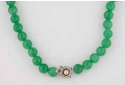
320 | JADEIT-COLLIER Metall. L 130 cm, Ges.-Gew. ca. 255 g. D. der Kugeln ca. 11,8 mm. Schließe mit rund facet- tierten Similisteinen. € 280,-