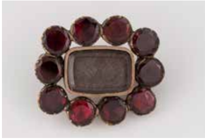
278 | HISTORISCHE MEMORIAL-BROSCH Metall, vergoldet. 2,4 x 2,1 cm, Ges.-Gew. ca. 4,1 g. 10 rund facettierte Granatsteine, Haar- einlage. Minimal besch. € 400,-