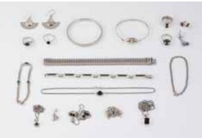
555 | KONVOLUT SCHMUCK 21-tlg. Silber. 800-925. Ges.-Gew. zus. ca. 135,5 g. Armbänder, Ringe, Ketten etc. Z.T. mit Besatz. Anhänger mit Kette als 2 Teile, Paar Ohrhänger jeweils als ein Teil gezählt. Einlieferung aus Juwelierschließung. € 120,-