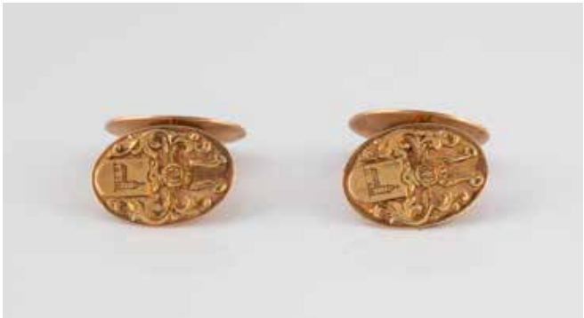
531 | PAAR MANSCHETTENKNÖPFE Gelbgold, Rotgold. 1,9 x 1,3 cm, Ges.-Gew. ca. 7,2 g. Gest. 585. Mit Wap-pen- und Kirchenarchitektur-Motiv. € 300,-