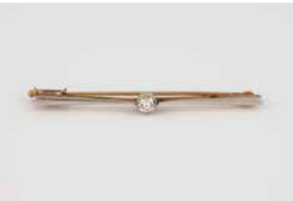
55 | DIAMANT-BROSCH Gelbgold, wohl Platin. L. 4,8 cm, Ges.-Gew. ca. 3,3 g. Nadel gest. 585, Reste eines Hersteller- zeichens. Ein Diamant, ca. 0,16 ct. € 250,-