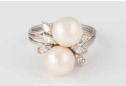
330 | PERL-RING MIT DIAMANTEN Weißgold. Ringmaß ca. 54,5, Ges.-Gew. ca. 4,8 g. Geprüft 14 K. Zwei Perlen, D. ca. 8,4 mm, sechs Diamanten im Navetteschliff, zus. ca. 0,48 ct. € 600,-