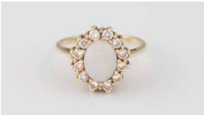
410 | OPAL-RING MIT BRILLANTBESATZ Gelbgold. Ringmaß ca. 47, Ges.-Gew. ca. 3,2 g. Gest. 585. Ein ovaler Opal-Cabochon, ca. 7,4 x 5,2 x 2,2 mm, 12 Brillanten, zus. ca. 0,3 ct. € 100,-