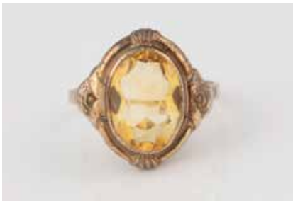
436 | CITRIN-RING Gelbgold. Ringmaß ca. 49, Ges.-Gew. ca. 2,4 g. Gest. 333. Ein oval facettierter Citrin, ca. 2,5 ct. Leichte Tragespuren. € 50,-