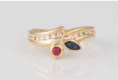
463 | EDELSTEIN-RING Gelbgold. Ringmaß ca. 55, Ges.-Gew. ca. 4,0 g. Gest. 750, Herstellerzeichen. Ein Saphir im Navetteschliff, ein Rubin-Cabochon, 10 Brillanten, zus. ca. 0,09 ct. Einlieferung aus Juwelierschließung. € 280,-