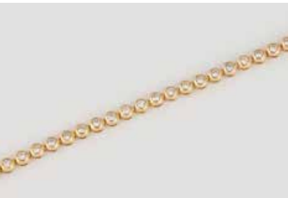
148 | BRILLANT-ARM BAND Gelbgold. L. 17 cm, Ges.-Gew. ca. 19,1 g. Gest. 750. 28 Brillanten, zusammen ca. 4,0 ct., etwa Top Wesselton, VS-SI. € 4.000,-