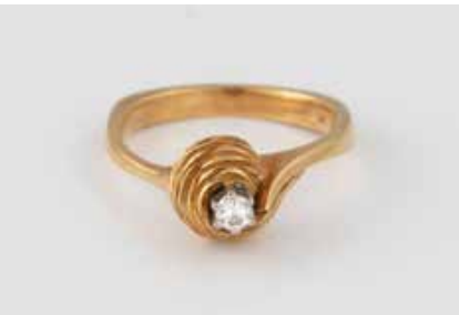
160 | BRILLANT-RING Gelbgold. Ringmaß ca. 52,5, Ges.-Gew. ca. 4,5 g. Gest. 750, Herstellerzeichen. Ein Brillant, ca. 0,07 ct. € 180,-