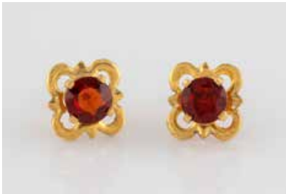
441 | PAAR OHRSTECKER Gelbgold. D. ca. 0,8 cm, Ges.-Gew. ca. 1,0 g. Geprüft 8 K. Jeweils ein rund facettierter Granat, zusammen ca. 0,7 ct. € 50,-