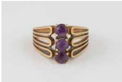
256 | AMETHYST-RING Gelbgold. Ringmaß ca. 55, Ges.-Gew. ca. 6,2 g. Gest. 585, Herstellerzeichen. Drei rund facettierte Amethyste. Besch. € 80,-