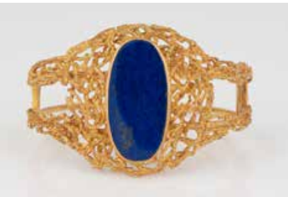
414 | LAPILAZULI-ARMREIF Gelbgold. Innenmaß ca. 6,0 x 5,5 cm, Ges.-Gew. ca. 52,7 g. Geprüft 18 K. Ovale Lapislazuli-Platte, ca. 3,3 x 1,6 x 0,4 cm. € 2.200,-