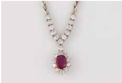
262 | EDELSTEIN-COLLIER Weißgold. L. 38 cm, Ges.-Gew. ca. 17,3 g. Geprüft 18 K. Ein Rubin, ca. 0,7 ct., 22 Brillanten, zusammen ca. 1,0 ct. € 900,-