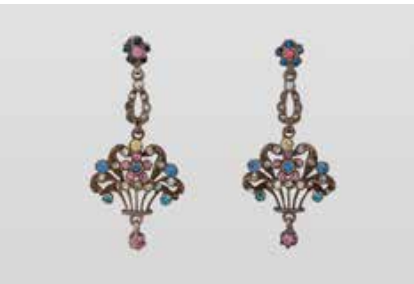
520 | PAAR OHRHÄNGER Silber. 4,5 x 2,0 cm, Ges.-Gew. ca. 6,0 g. Gest. 835. Unterschiedlich farbige Similisteine, fa-cettiert. Part. leicht besch. € 50,-