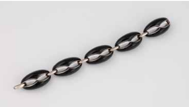
496 | ARMBAND Silber. 19,5 cm, Ges.-Gew. ca. 87,5 g. Gest. 925, italienische Punzierung. € 350,-