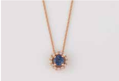
182 | EDELSTEIN-ANHÄNGER-KETTE Rotgold. L. 49,5 cm, Ges.-Gew. ca. 2,1 g. Gest. 14 K. Rundes Schaustück mit einem rund facettierten Saphir, ca. 0,25 ct., 13 Brillanten, zus. ca. 0,10 ct. € 220,-