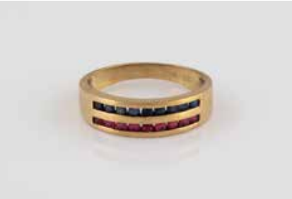
469 | EDELSTEIN-RING Gelbgold. Ringmaß ca. 54, Ges.-Gew. ca. 2,7 g. Gest. 333. 18 rund facettierte Rubine und Saphire. € 120,-