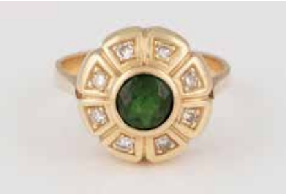
282 | RING Gelbgold. Ringmaß ca. 57, Ges.-Gew. ca. 5,8 g. Geprüft 14 K. Ein rund facettierter Turmalin (?), ca. 5,8 x 3,3 mm, acht Diamanten im 8/8-Schliff, zusammen ca. 0,2 ct. Besch. € 190,-