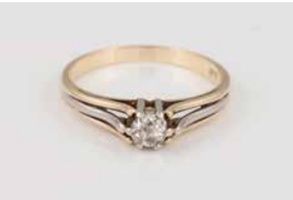
155 | DIAMANT-RING Gelbgold. Ringmaß ca. 56, Ges.-Gew. ca. 2,9 g. Gest. 585. Ein Diamant im Altschliff, ca. 0,24 ct. Besch. € 180,-