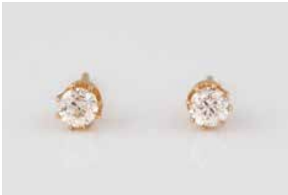
45 | PAAR DIAMANT-OHRSTECKER Gelbgold. D. 0,5 cm, Ges.-Gew. ca. 2,1 g. Gest. 585. Jeweils ein Diamant im Altschliff, zusammen ca. 0,76 ct., minimalst besch. € 1.000,-