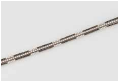
140 | DIAMANT-ARMBAND Weißgold. L. 18 cm, Ges.-Gew. ca. 12,8 g. Gest. 18 K, Herstellerzeichen, unterschiedliche Punzierungen. Ca. 374 schwarze und weiße Diamanten, zusammen ca. 1,37 ct. Part. minimale Tragespuren. € 1.700,-