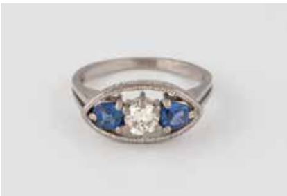
199 | EDELSTEIN-RING Weißgold. Ringmaß ca. 54, Ges.-Gew. ca. 5,6 g. Geprüft 18 K. Zwei Sapphire, zusammen ca. 0,5 ct., ein Brillant mit facettierter Kalette, ca. 0,33 ct. Schienengröße wohl geändert. Tragespuren. € 450,-