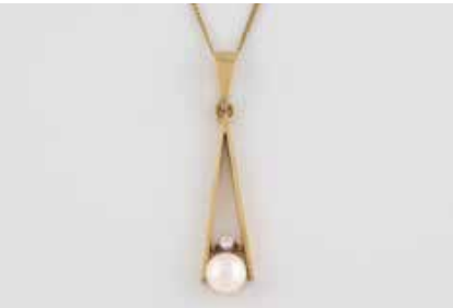
379 | PERL-ANHÄNGER MIT KETTE Gelbgold. Anhänger L. 3,9 cm, Kette L. 50 cm. Ges.-Gew. zus. ca. 4,1 g. Gest. 585. Eine Perle, D. ca. 5,9 mm, ein Brillant, ca. 0,03 ct. € 150,-